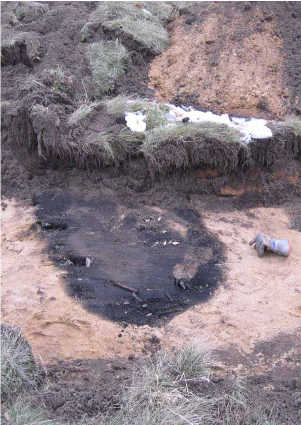
Figur 4. Anläggning i schakt 16, notera förekomst av obrända djurben i ytan. Foto från öst Ludvig Pappmehl-Dufay/Kalmar läns museum.