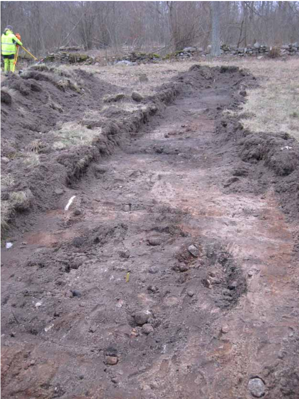
Figur 6. Översikt över schakt 7, med större hård/kokgrop i förgrunden och förmodat kulturlager längre bort. I ett mörkare parti ungefär i bildens mitt hittades ett avslag i sydsandinavisk flinta. Foto från sydväst Ludvig Papmehl-Dufay/Kalmar läns museum.