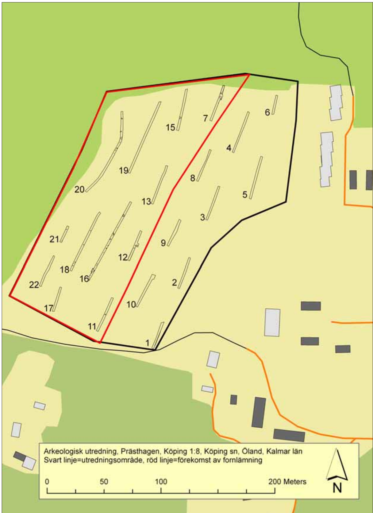
Figur 3. Plan över utredningsområdet, med schakten numrerade. Jämför tabell 1. Den röda linjen markerar gränsen mot öst för det område inom vilket fornlämningar påträffades.