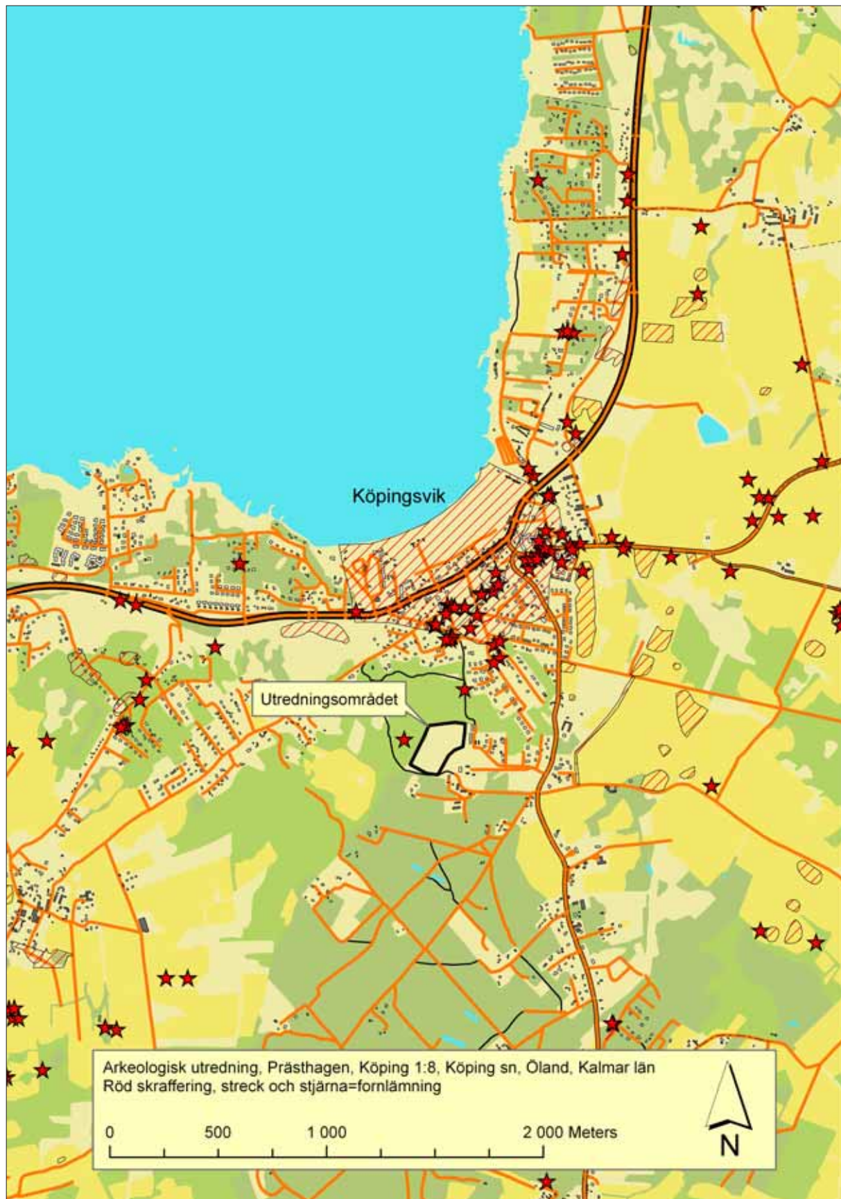
Figur 2. Området kring Köpingsvik, med utredningsområdet samt registrerade fornlämningar markerade (röda skrafferingar, stjärnor och linjer).