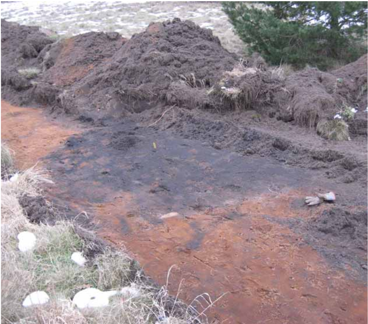
Figur 5. Större anläggning eller kulturlager i schakt 16.

Av de 21 schakten konstaterades förekomst av kulturhistoriska lämningar i 9 st. I ytterligare 5 schakt noterades vad som kan betraktas som osäkra indikationer på kulturhistoriska lämningar, framförallt i form av mindre sotfläckar och liknande. De 9 schakten med tydliga kulturhistoriska lämningar var alla belägna inom västra delen av området (se fig 3). Anläggningarna i detta område utgörs av härdar, gropar och andra nedgrävningar, och fynden utgörs av obrända djurben samt ett avslag i sydsandinavisk flinta (fig 4-6). På flera håll förekommer även vad som tolkats som kulturlager, i form