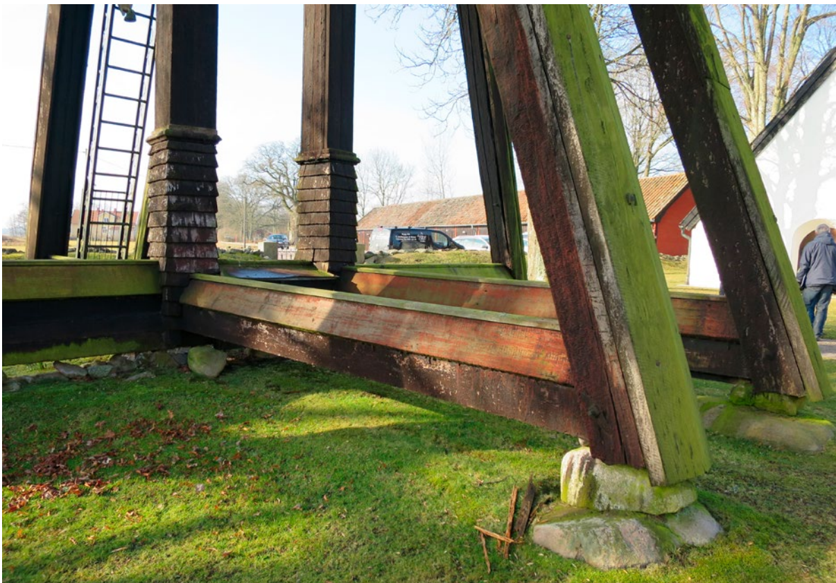
Klockstapeln före renoveringen, detaljbilder.