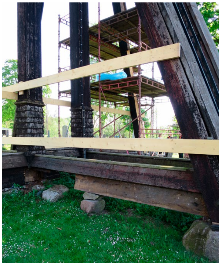
Dåligt virke på horisontellt stöbden borttaget.