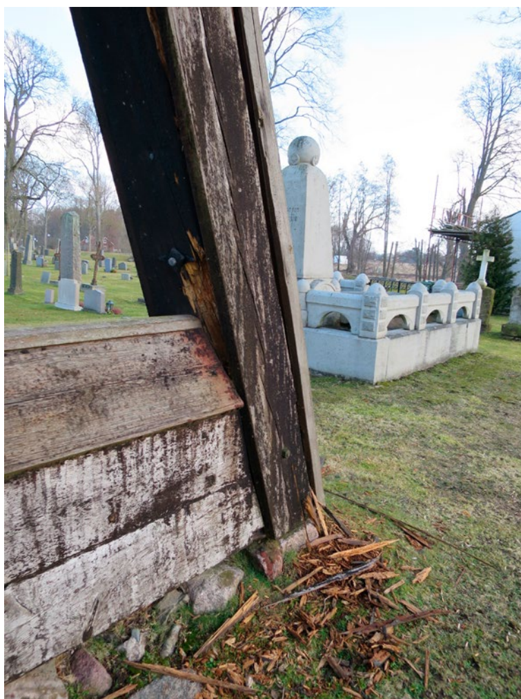
Klockstapeln före renoveringen, detaljbilder.