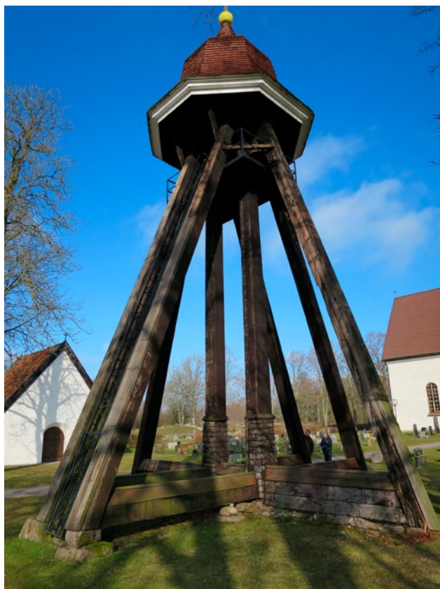
Klockstapeln före renoveringen.