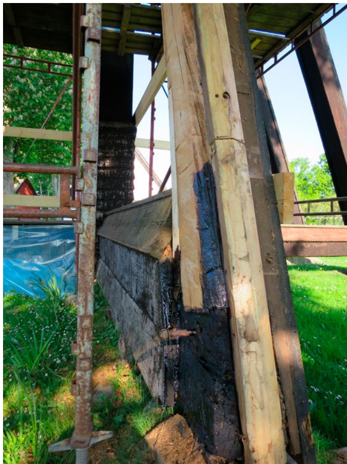
Lagd stomme på lodrätt stöbden.