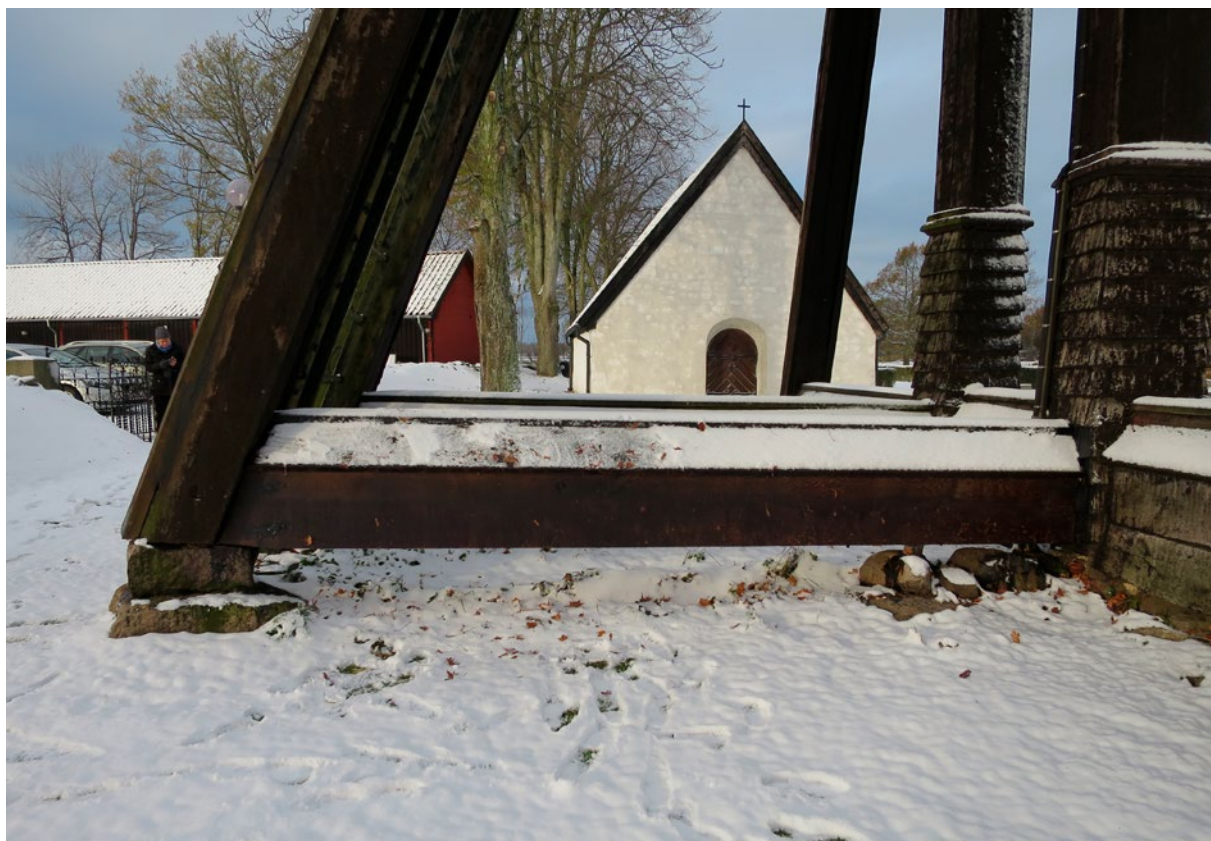
Klockstapeln efter renovering, detaljbilder.