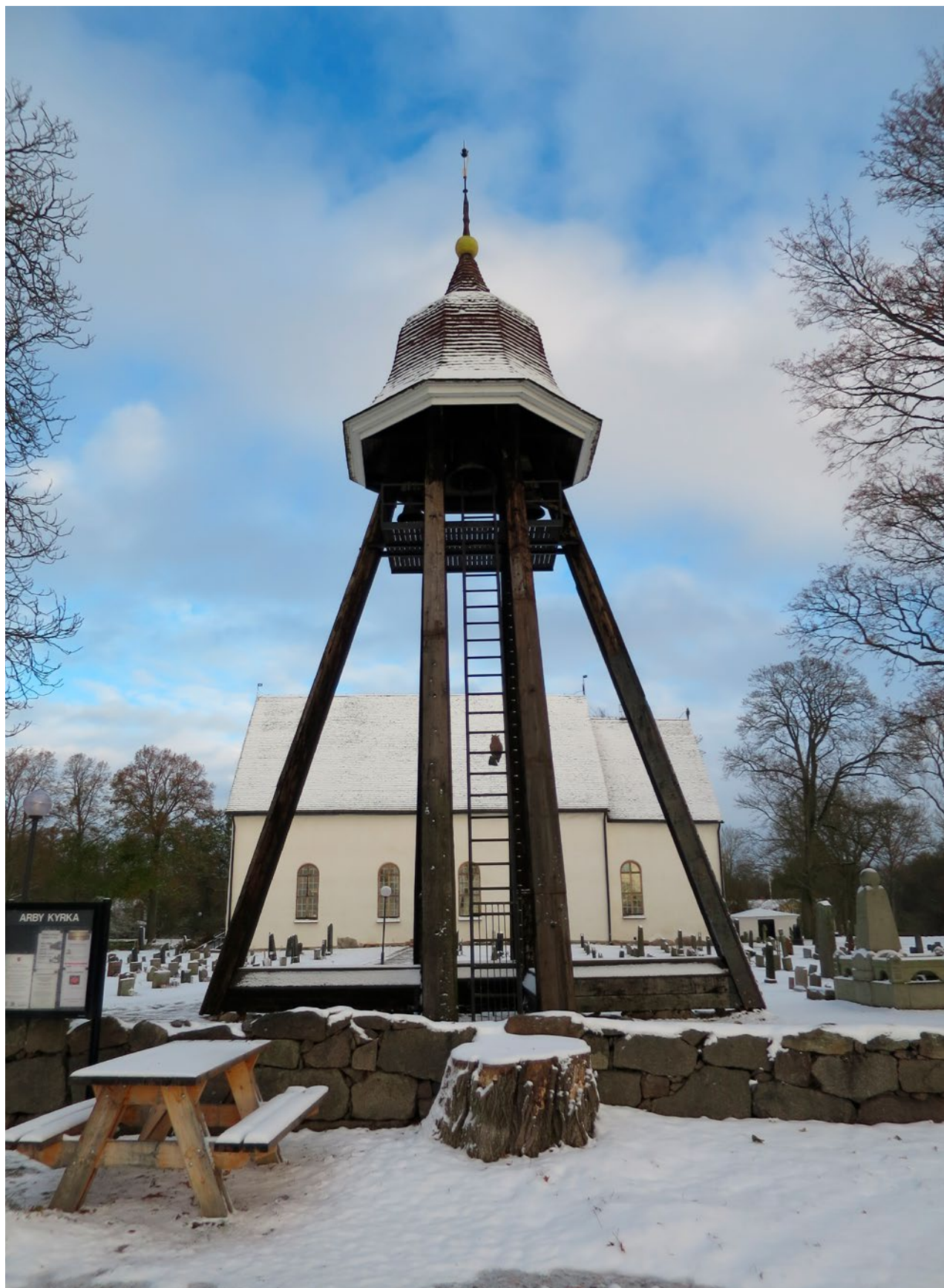
Klockstapeln efter reovering.