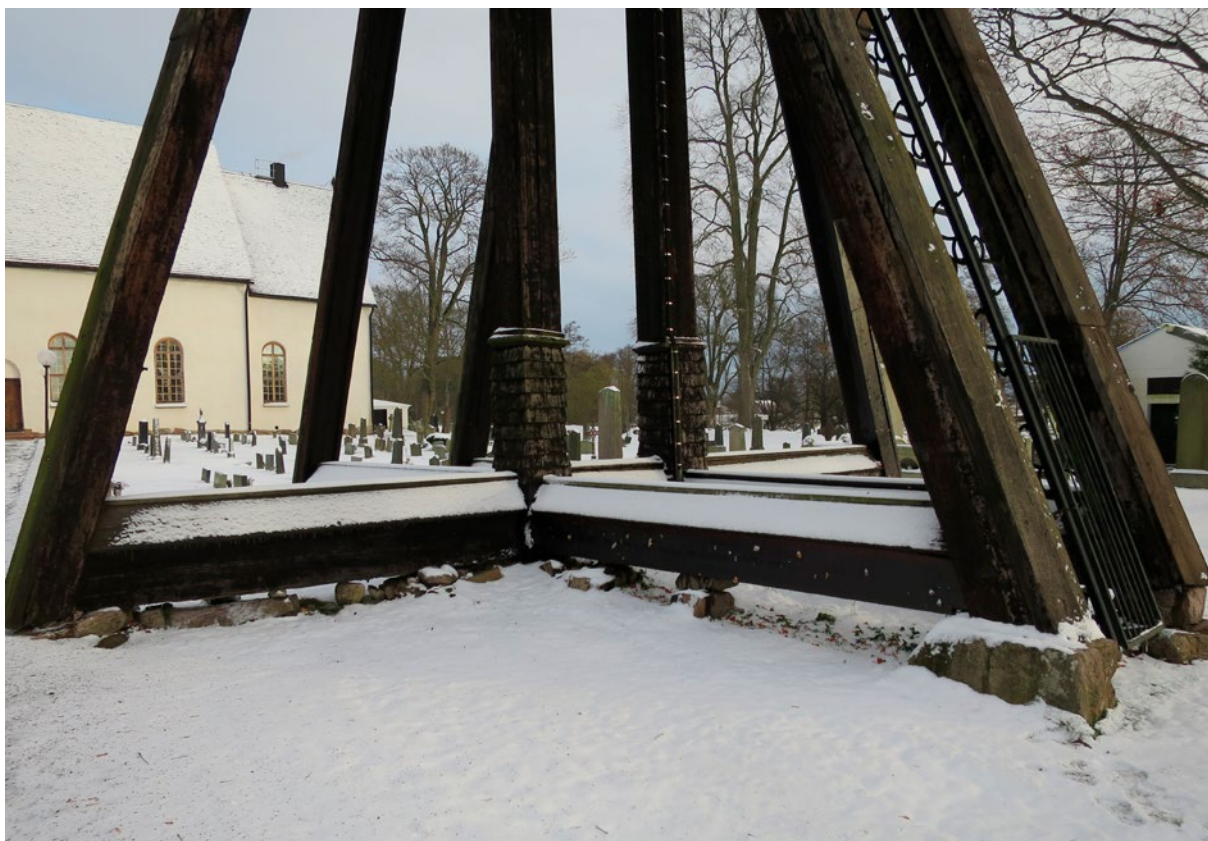
Klockstapeln efter renovering, detaljbilder.