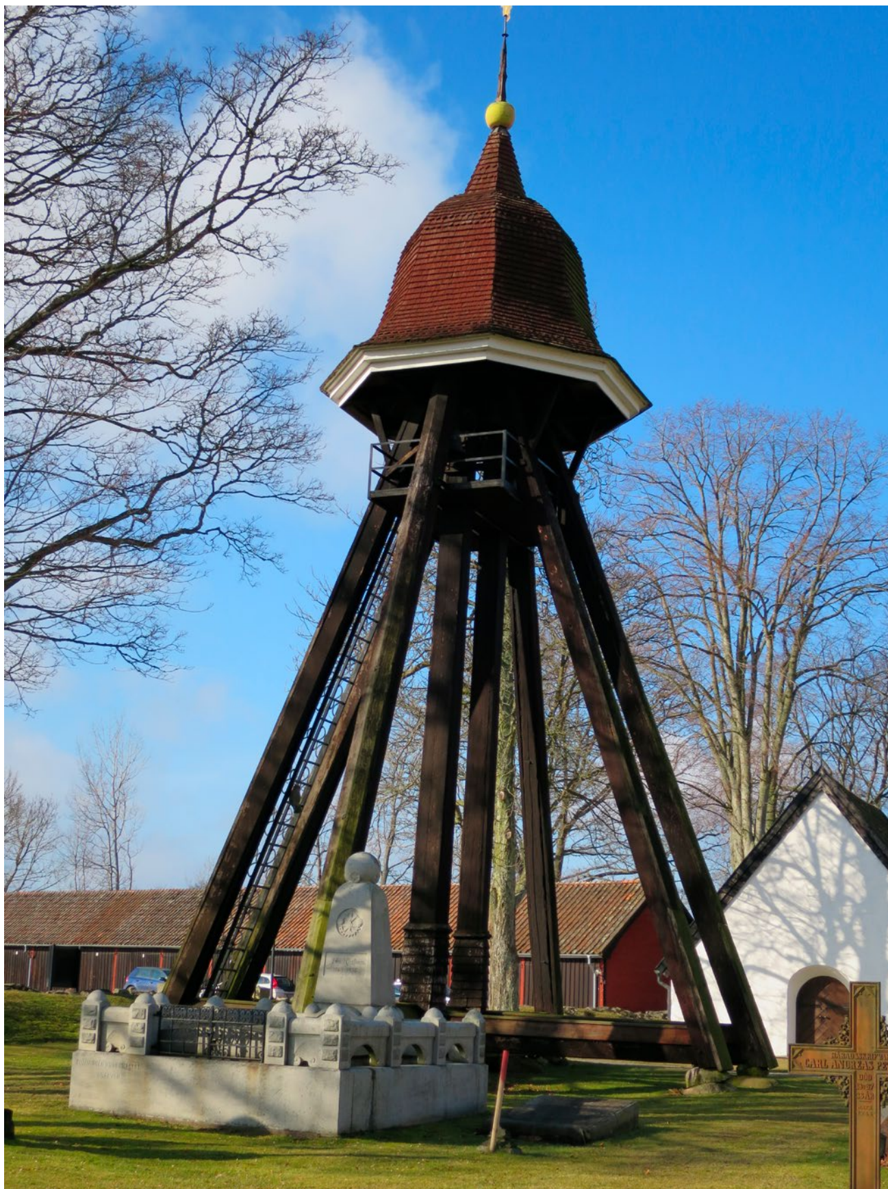
Klockstapeln före renoveringen.