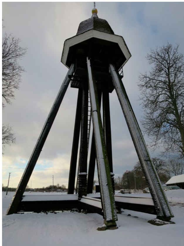
Klockstapeln efter renovering.