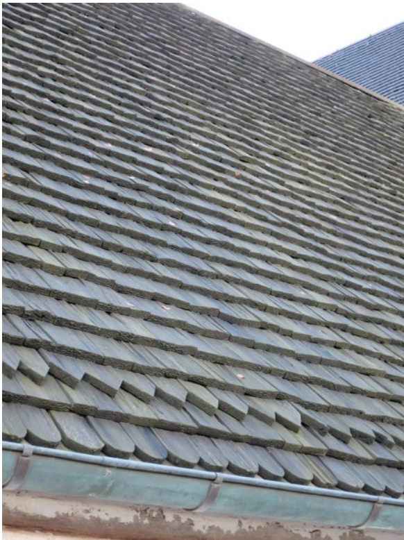
Detalj, spåntak på västra takfallet före omläggning.