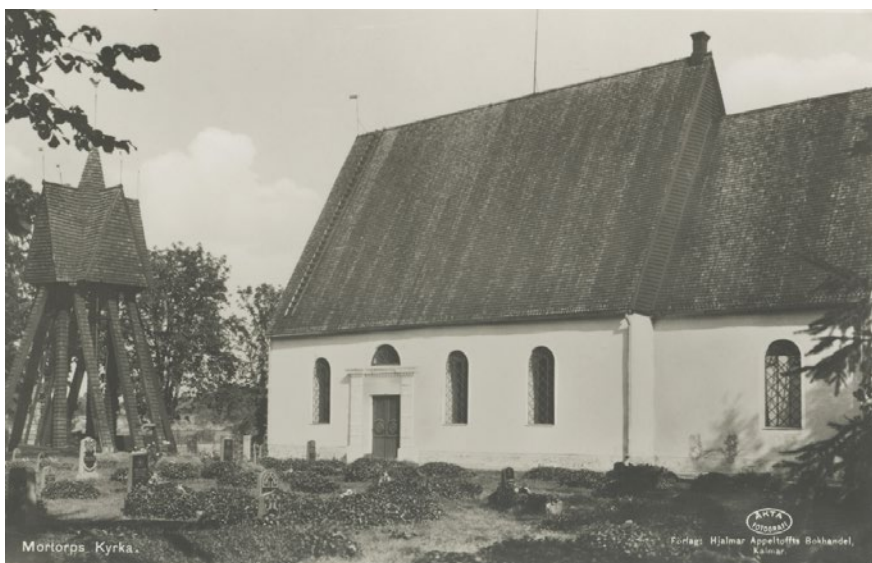
Vykort föreställande Mortorp kyrka och klockstapel. Okänt årtal.

Senaste översynen av kyrkomiljöns spåntäckning ägde rum år 2009.