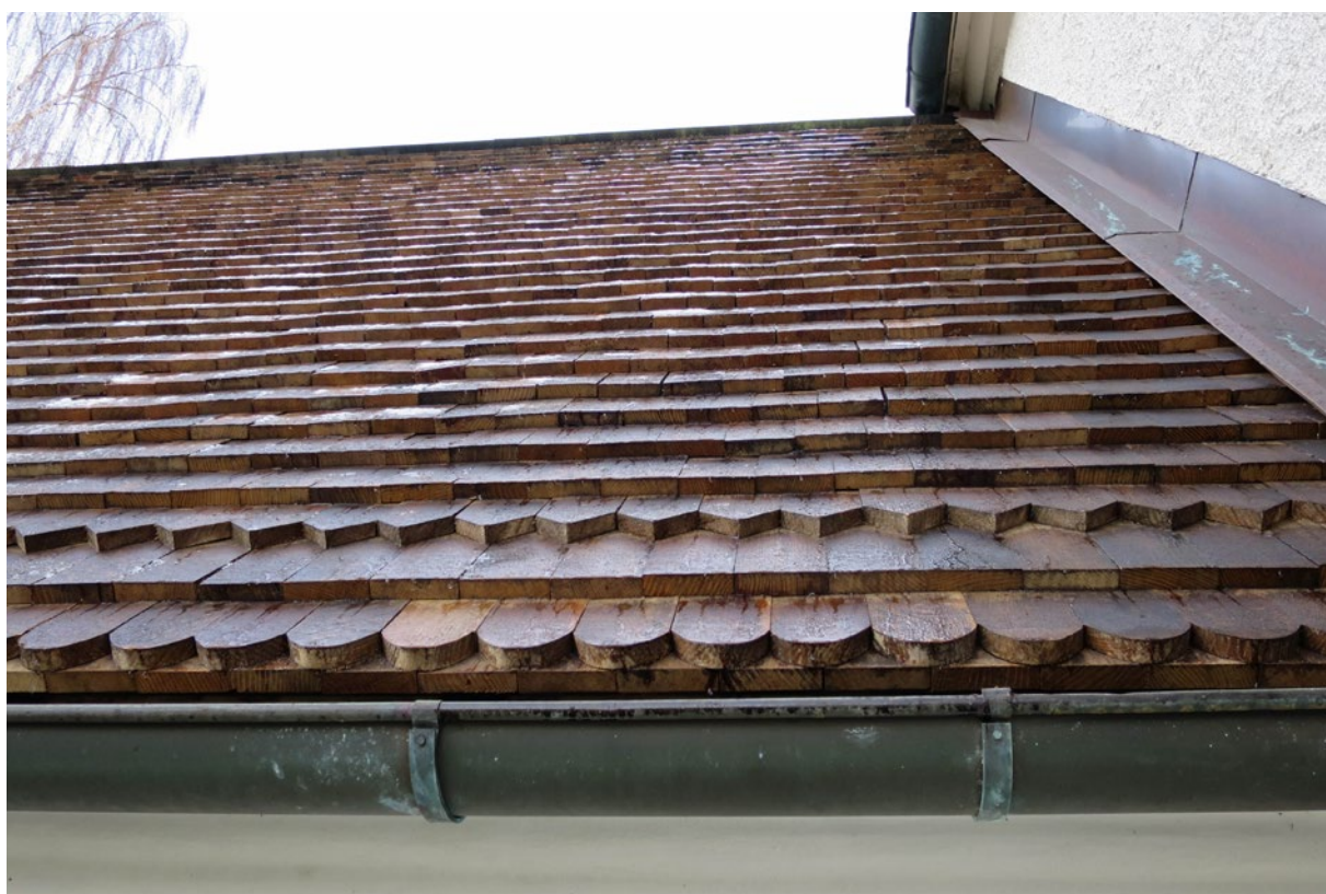
Nylagt spåntak på sakristians västra takfall.