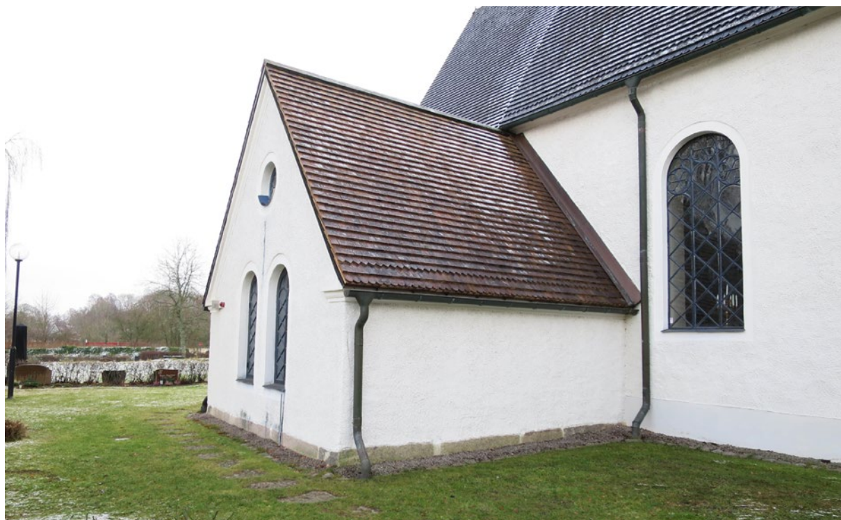
Nylagt spåntak på sakristians västra takfall.