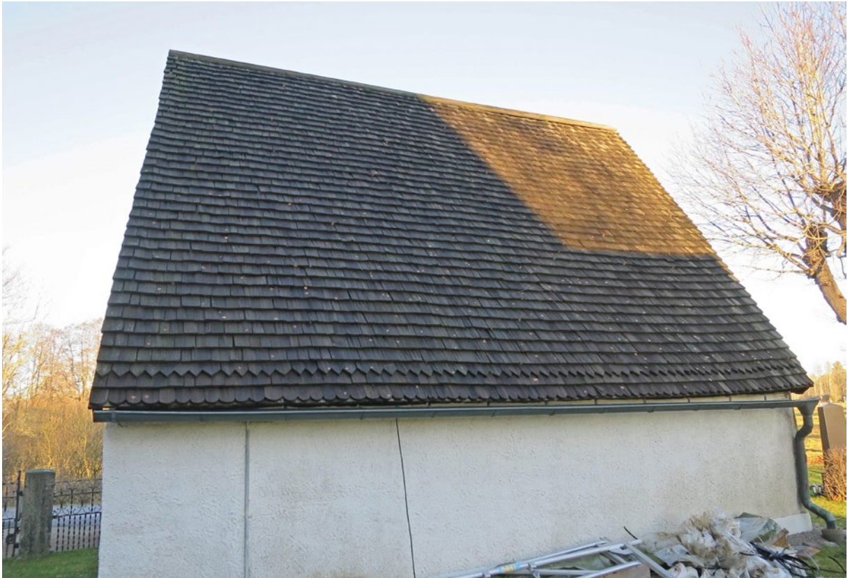
Spåntak på östra takfallet före omläggning.