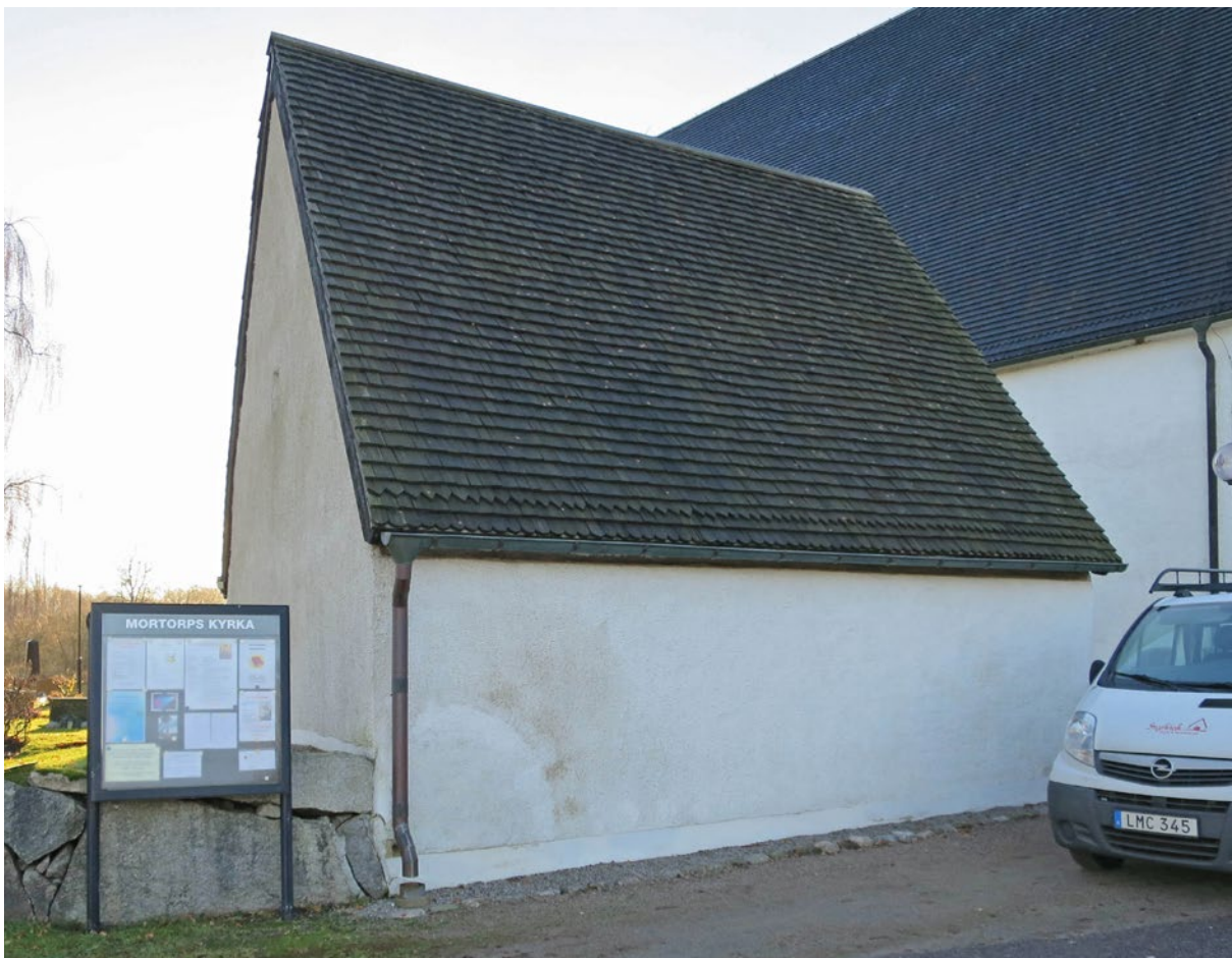
Spåntak på västra takfallet före omläggning.

skador. Konstruktionen består av återanvända ohyvlade furubrädor med olika ursågningar och passform. Flera brädor på det östra takfallet saknade förankring mot den södra takstolen, bärigheten var påverkad.