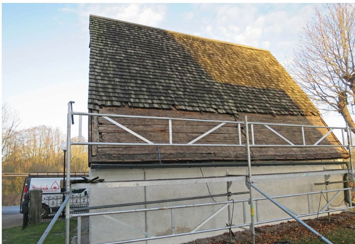
Nedtagning av spån på östra takfallet och synligt undertak.