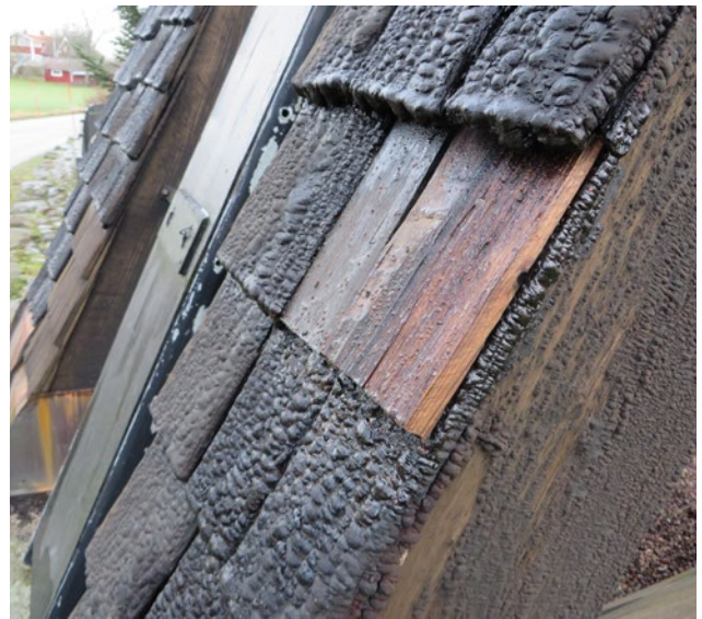
Detalj, bytta spån, efter åtgärd.