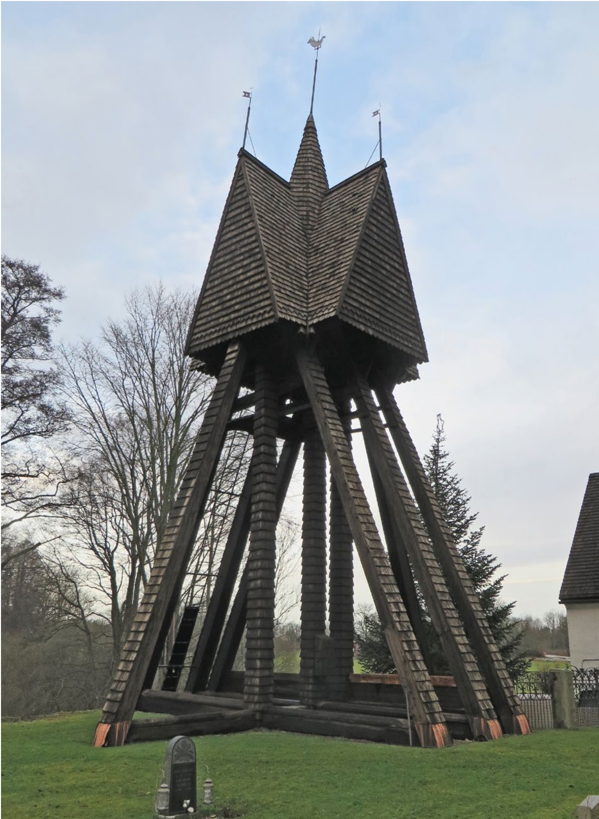
Klockstapeln efter åtgärd.