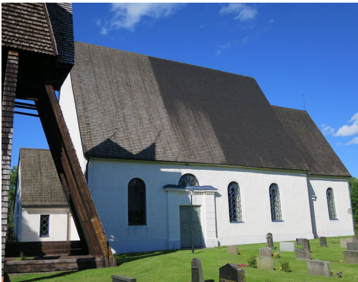
Kyrkan före åtgärd.