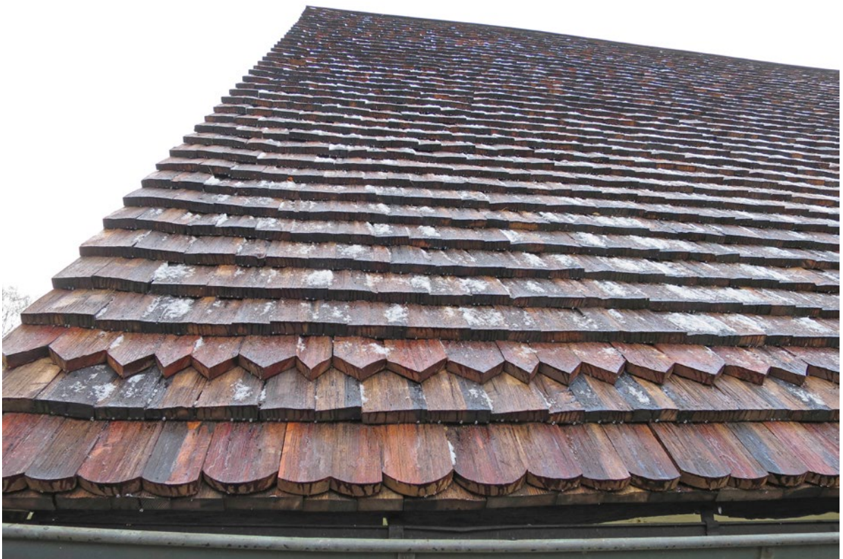
Spåntak på östra takfallet efter omläggning.