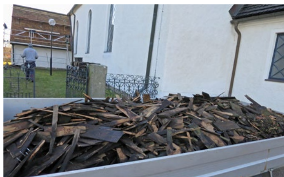
Nylagt spåntak. Kasserad spåntäckning i släpet.

tidigare. Spånen är lagda med ca. 3–5 mm mellanrum mellan varje spån och med större mellanrum med jämna intervaller. Dess mått är 45 cm långa, 10 cm breda och 0,5–2 cm tjocka. Spånen är lagda i tre skikt. Täckningen är utförd så att taket luftar. Nockbräder, plåtanslutningar och anslutningsbrädor har återanvänts. Rostfri spik har använts. Handsmidd spik har tagits tillvara och förvaras inom kyrkomiljön. Hela taket är tjärat ca 6 månader efter läggning med dalbränd furuträtjära från Claessons Trätjära AB.