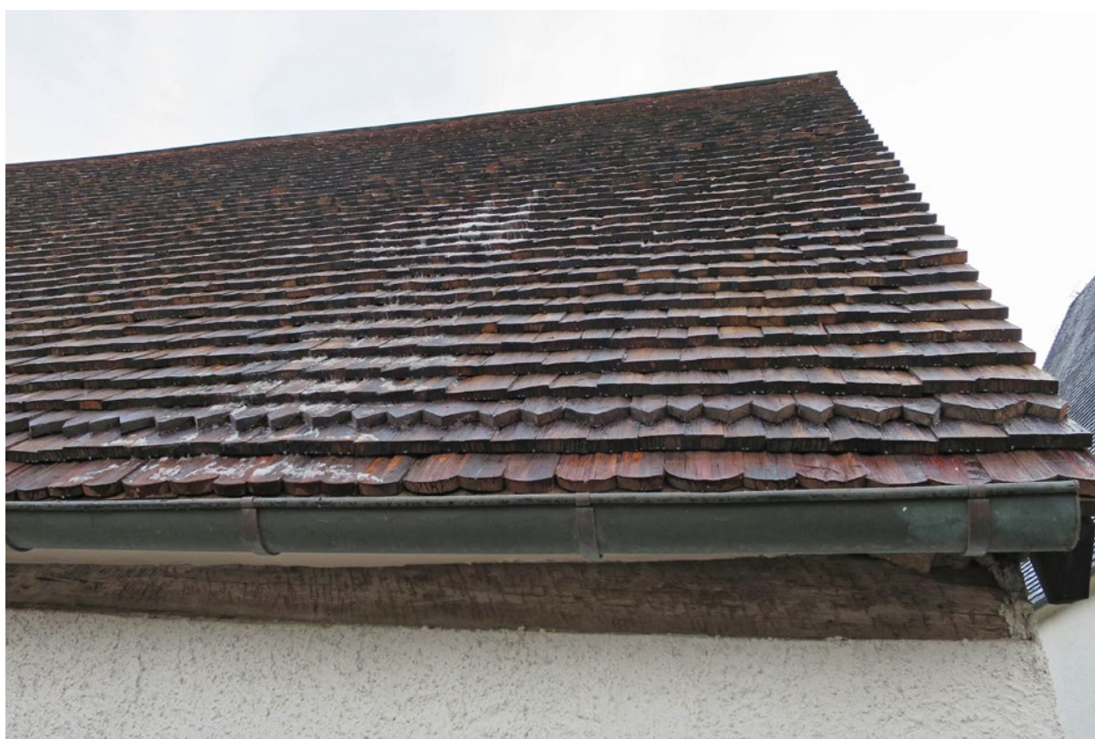
Spåntak på västra takfallet efter omläggning.