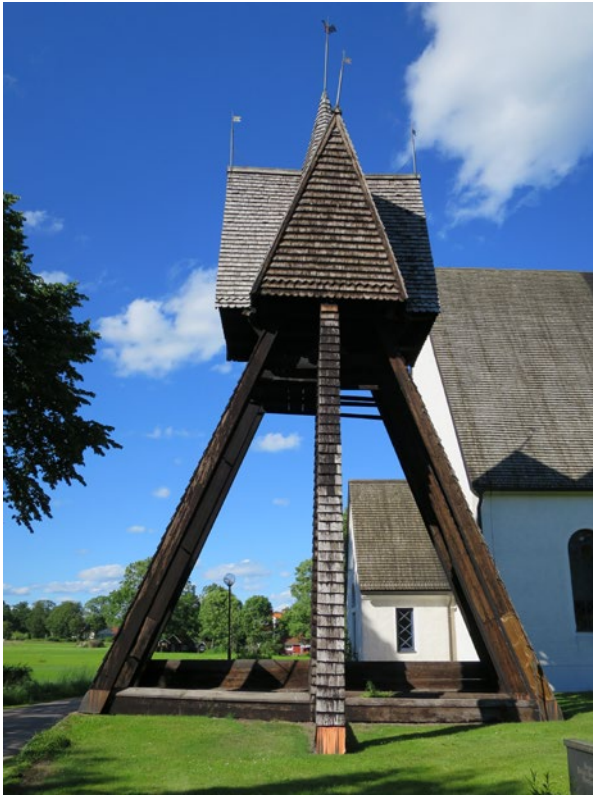
Klockstapeln före åtgärd.