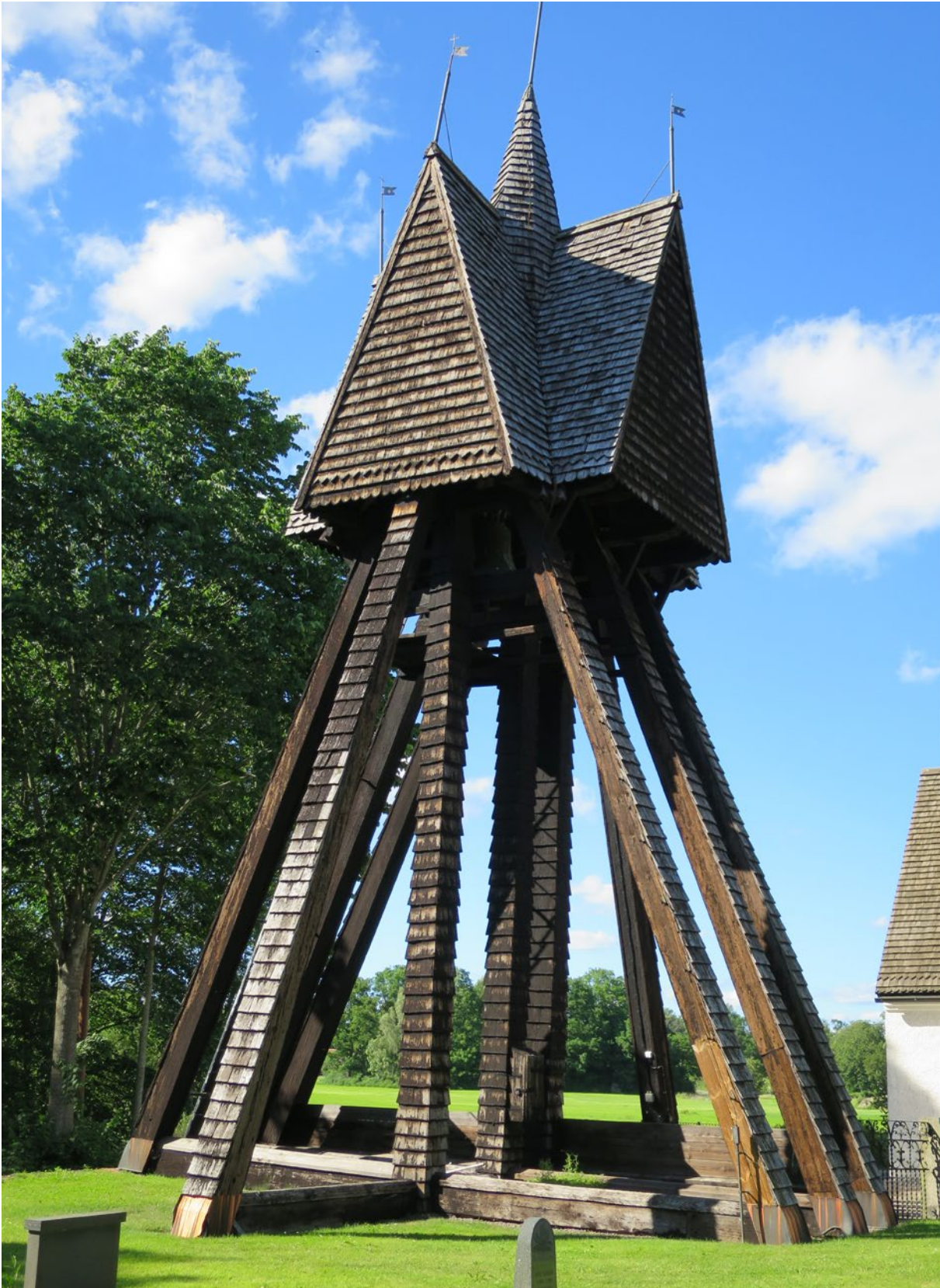
Klockstapeln före åtgärd.