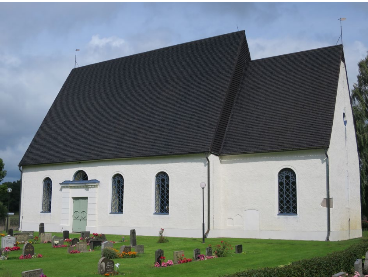
Kyrkan efter åtgärd.