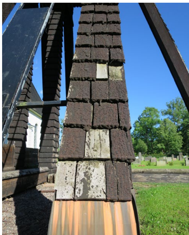
Detalj, saknade och skadade spån på klockstapelns ben före åtgärd.

Spåntäckningen sågs över, dåliga spån ersattes med friska ekspån från Jonssons Spån & Entreprenad i Rimforsa. Spånen var fördopade i mahognytjära – lika delar furutjära, linolja och terpentin från Claessons Trätjära AB. Dess mått är ca. 45 cm långa, 10 cm breda och 0,5–2 cm tjocka. Spånen är lagda i tre skikt. Täckningen är utförd så att taket luftar. Rostfri spik har använts. Upplagning med tjärnfuru av rötskadade bräder och bottenstycke på avskärmningarna. Hela klockstapeln är rengjord och tjärad med dalbränd furuträtjära från Claessons Trätjära AB.