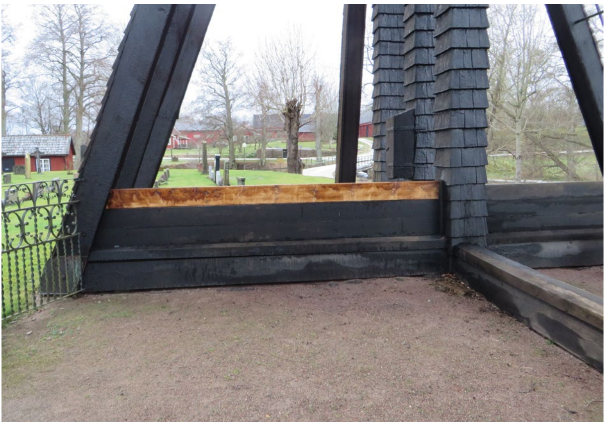
Detalj, efter åtgärd.