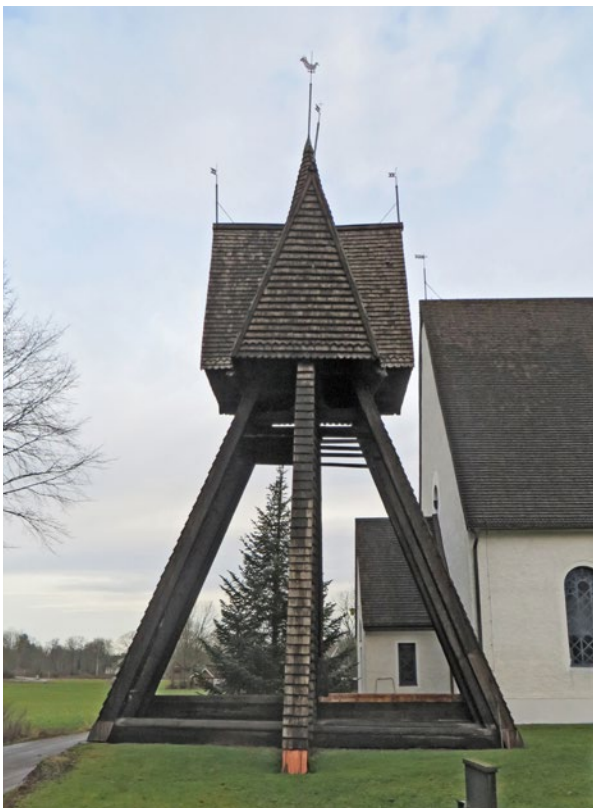
Klockstapeln efter åtgärd.