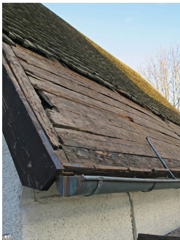
Detalj av undertaket på östra takfallet.

Spåntäckningen revs. Ny spåntäckning med handkluvan och tjärdoppad furuspån från Kyrktak Finland lades. Tjäran kommer från Claessons Trätjärna AB. Den nya spåntäckningen lades med rundade spån i det nedre varvet och spetsiga spån i det tredje varvet nerifrån så som tidigare. Spånen är lagda med ca 3–5 mm mellanrum mellan varje spån och med större mellanrum med jämna intervaller. Dess mått är 45 cm långa, 7–20 cm breda och 0,5–2 cm tjocka. Den spjälkade sidan är lagd uppåt. Spånen är lagda i tre skikt. Täckningen är utförd så att taket luftar. Varmförzinkad trådspik har använts. Undertaket lagades upp med ohyvlat furuvirke beställt från Sven Henriksson i Håknabo. De brädor som saknade förankring mot den södra takstolen byttes till nya så att hela undertaket nu kan bära spåntäckningen. Nockbräder och anslutningsbräder har återanvänts. Hela taket är tjärat ca 6 månader efter läggning med dalbränd furuträtjärna från Claessons Trätjärna AB.