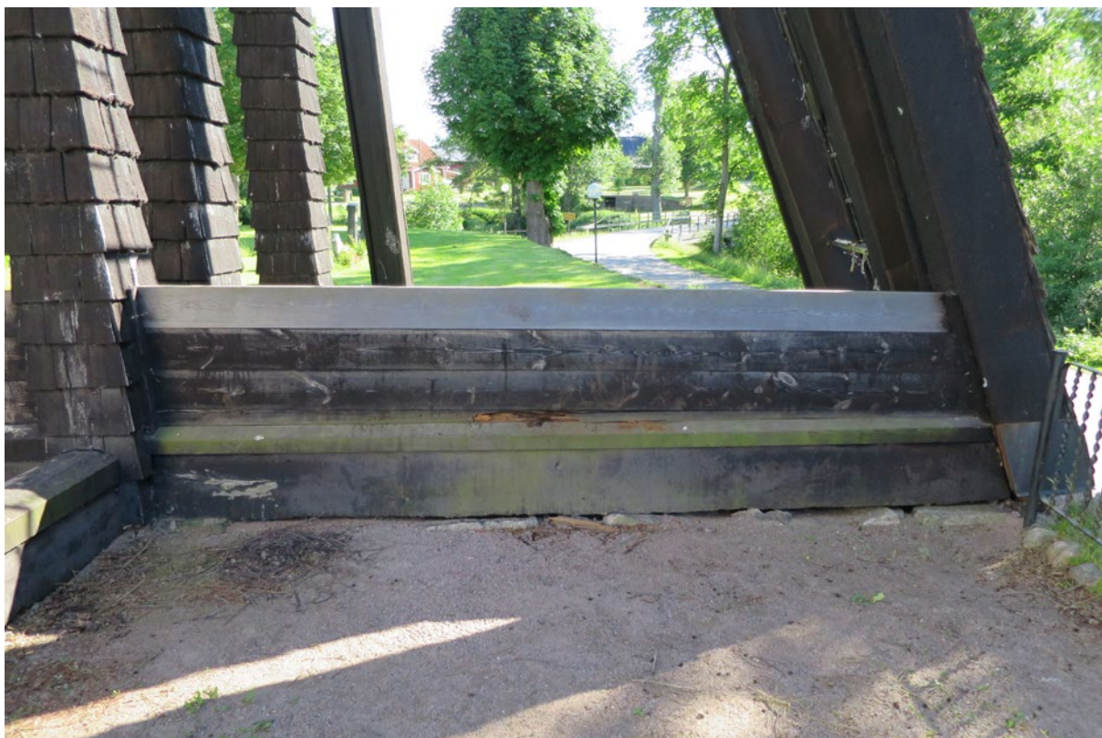
Detalj, rötskadade bräder före åtgärd.