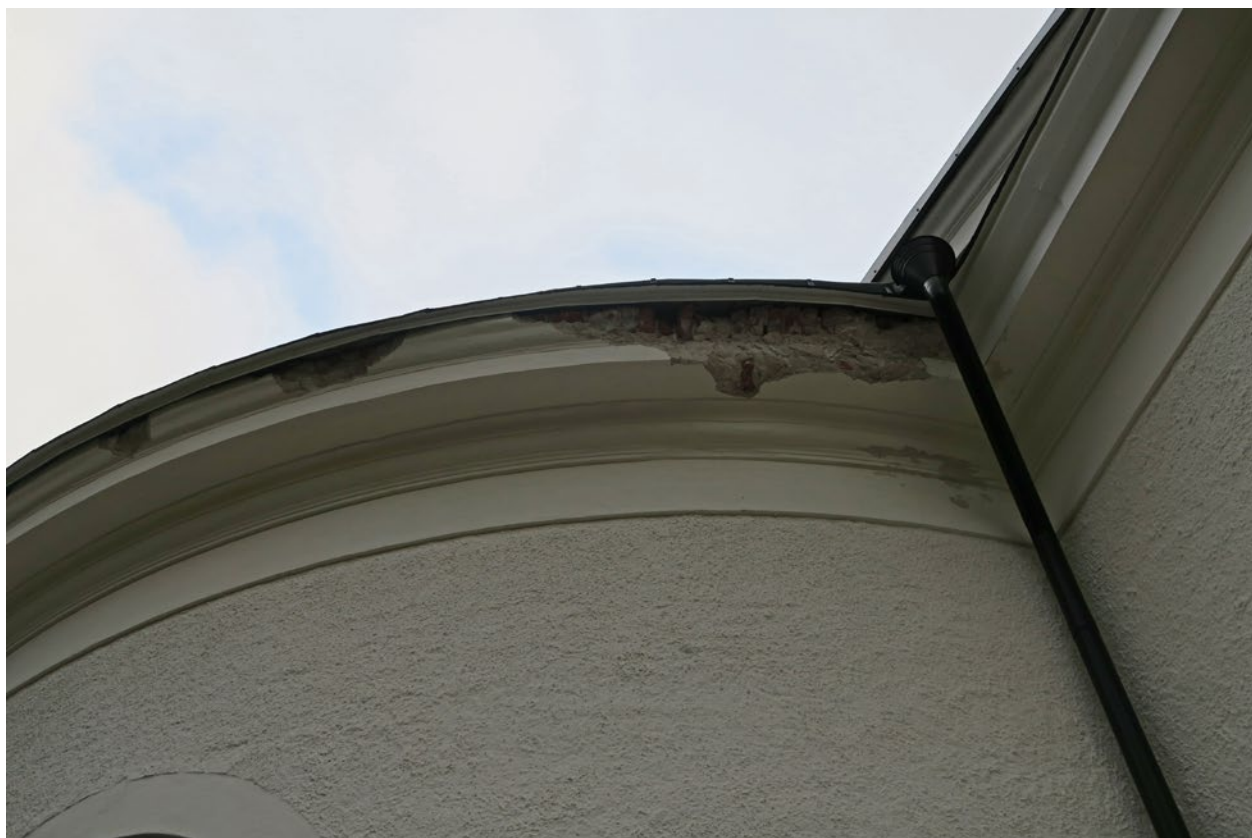
Kyrkan före åtgärd. Skadan på östra sidan av absiden.