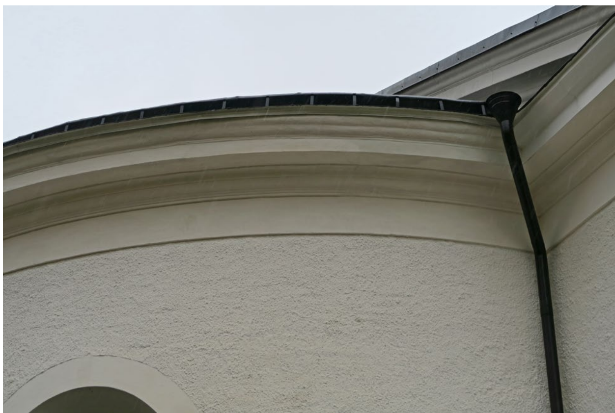
Kyrkan efter åtgärd på östra sidan.