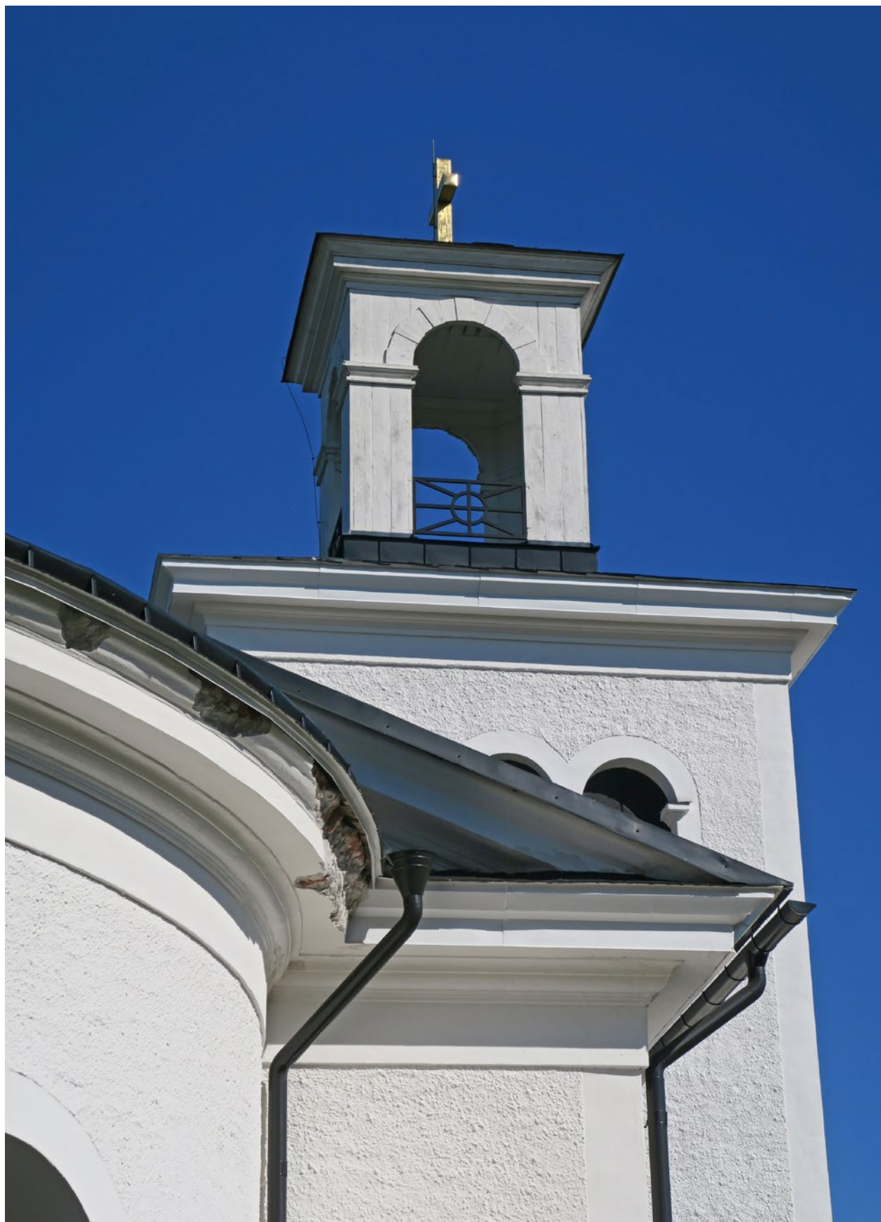
Kyrkan före åtgärd. Skadan på östra sidan av absiden.