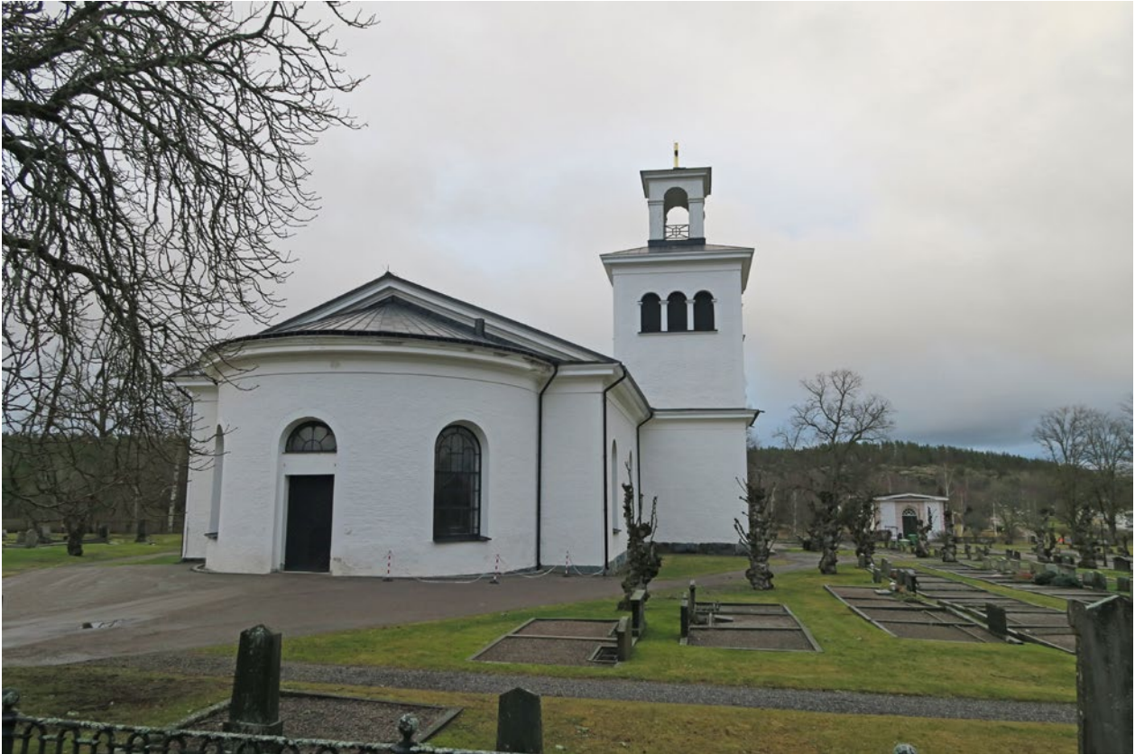
Kyrkan före åtgärd.