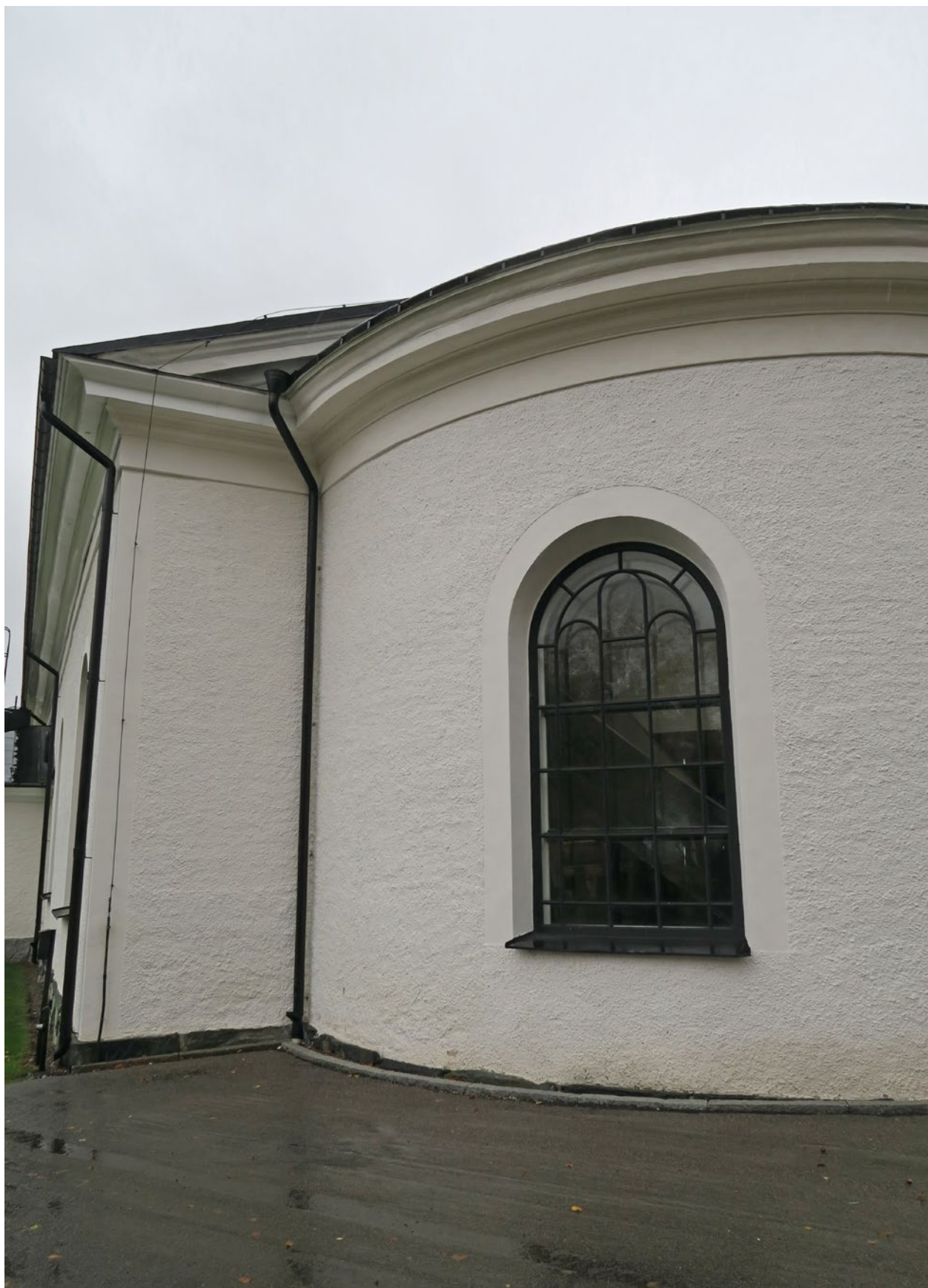
Kyrkan efter åtgärd på västra sidan.