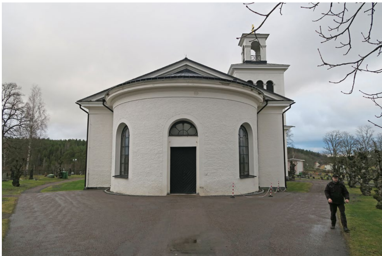
Kyrkan från söder före åtgärd.