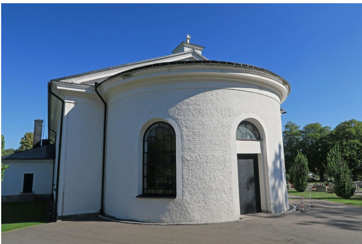
Kyrkan före åtgärd. Skador på västra sidan av absiden.