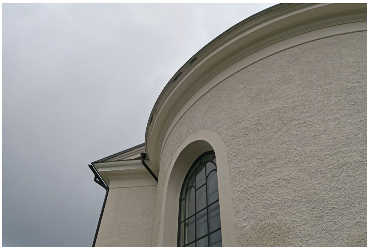
Kyrkan före åtgärd på västra sidan.