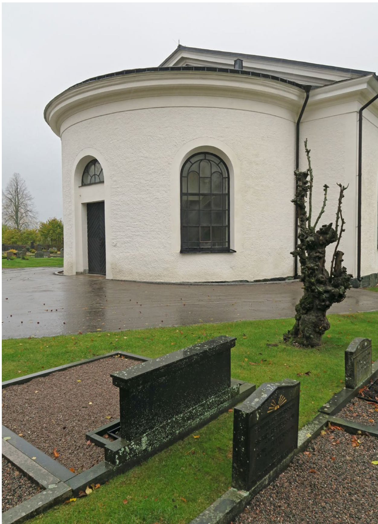
Kyrkan efter åtgärd på östra sidan.