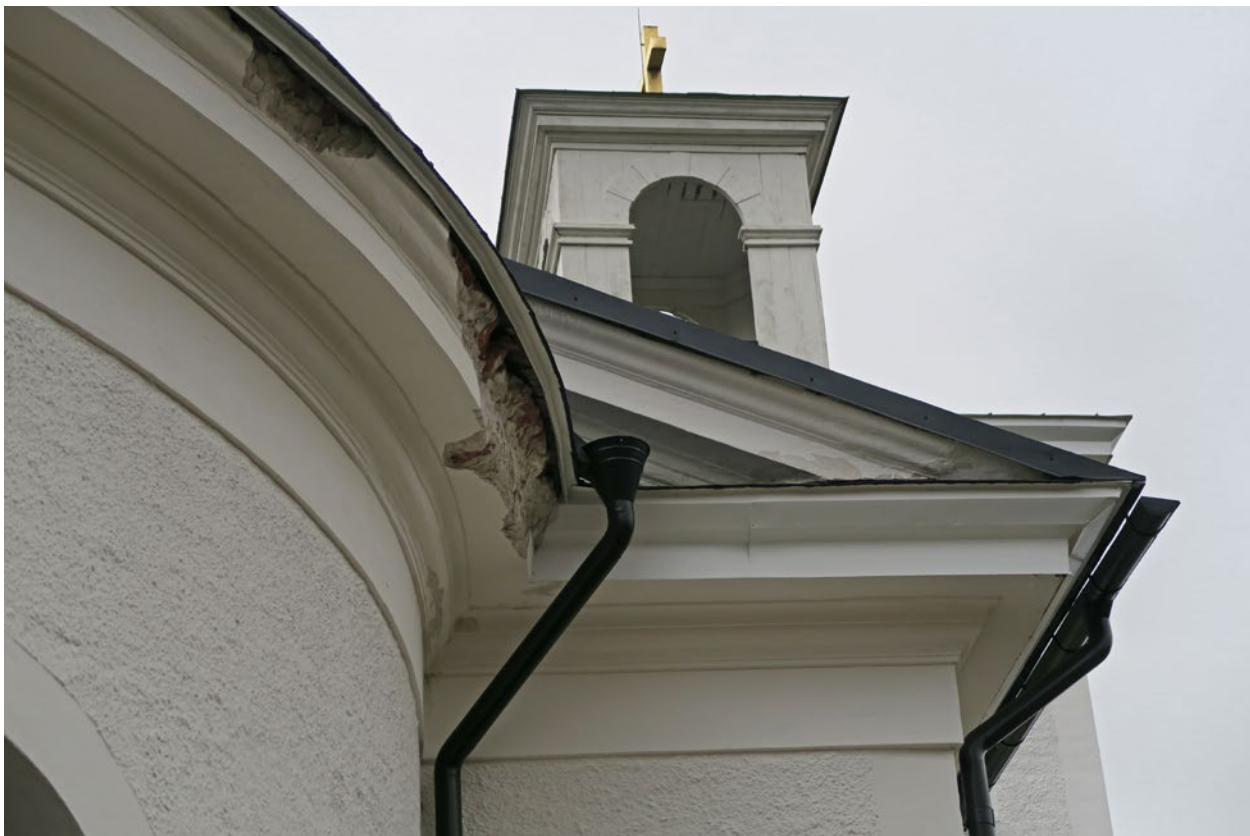
Kyrkan före åtgärd. Skadan på östra sidan av absiden.