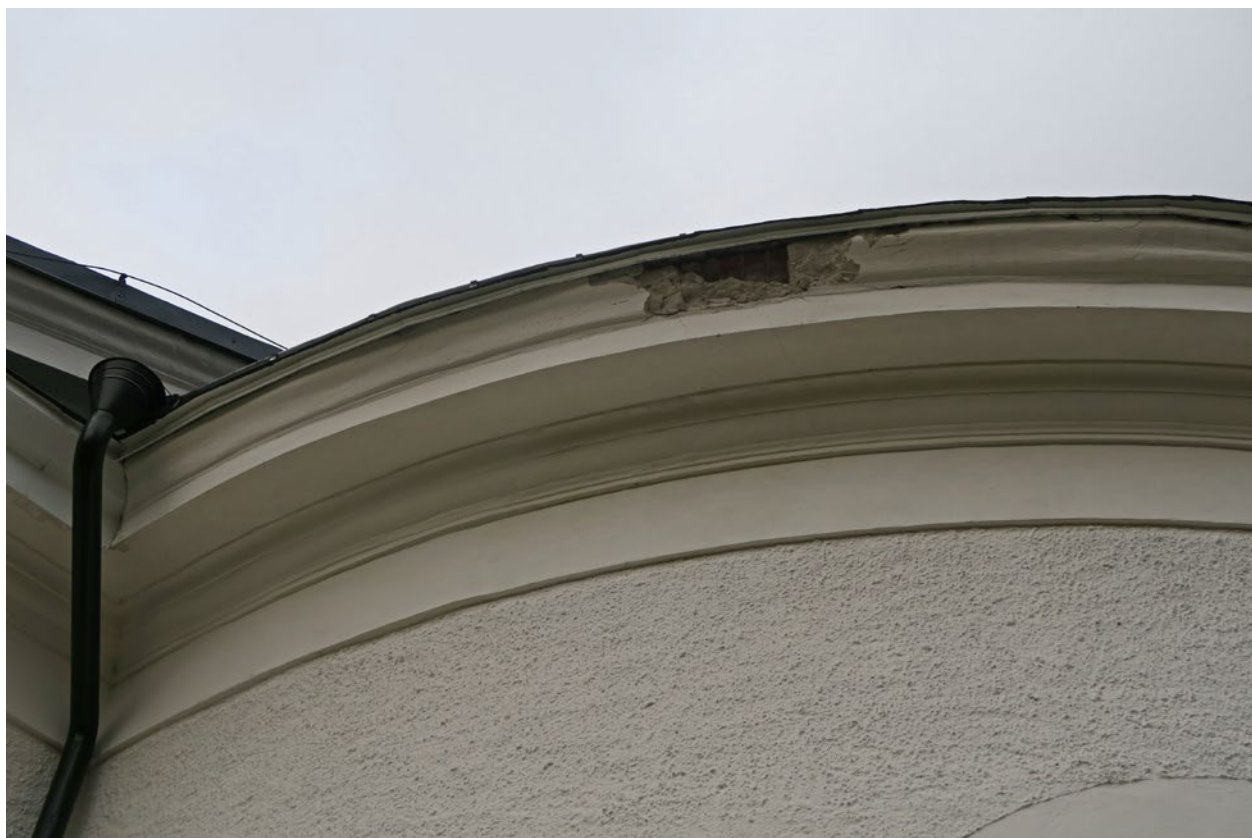
Kyrkan före åtgärd på västra sidan.