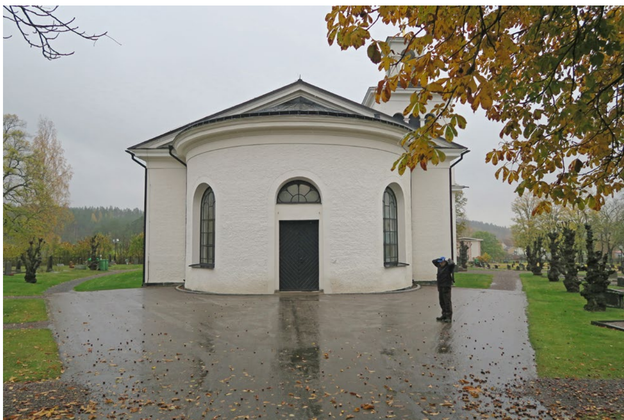
Kyrkan från söder efter genomförd åtgärd.