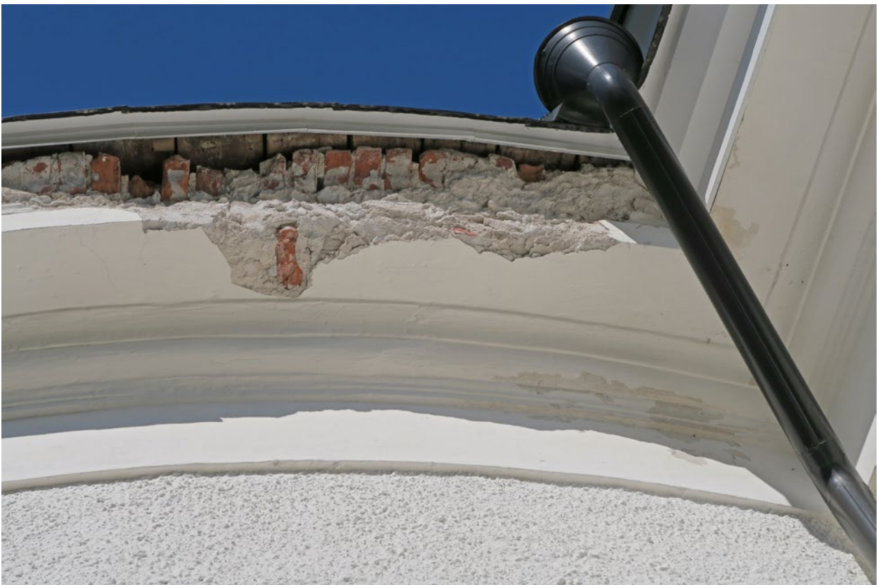
Kyrkan före åtgärd. Skadan på östra sidan av absiden.