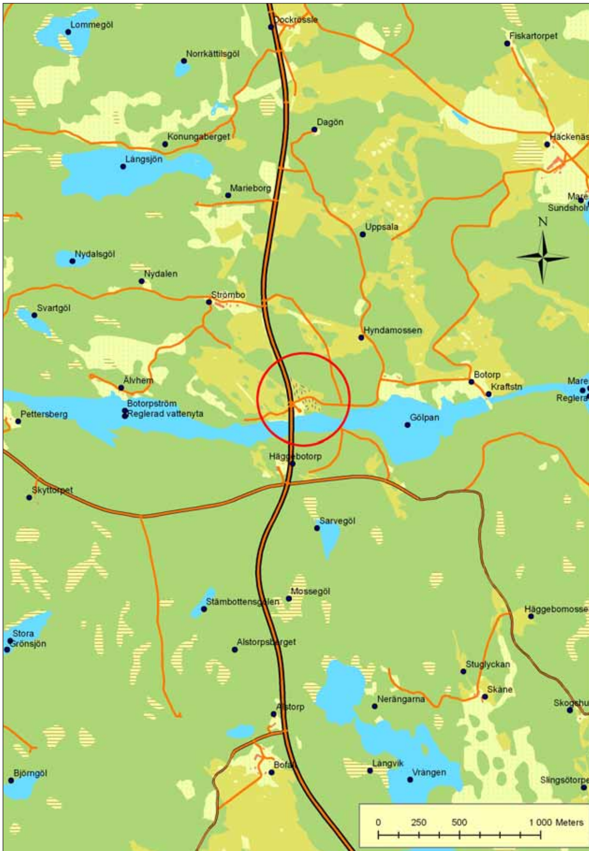
Fig. 2. Översiktspild Botorpström.