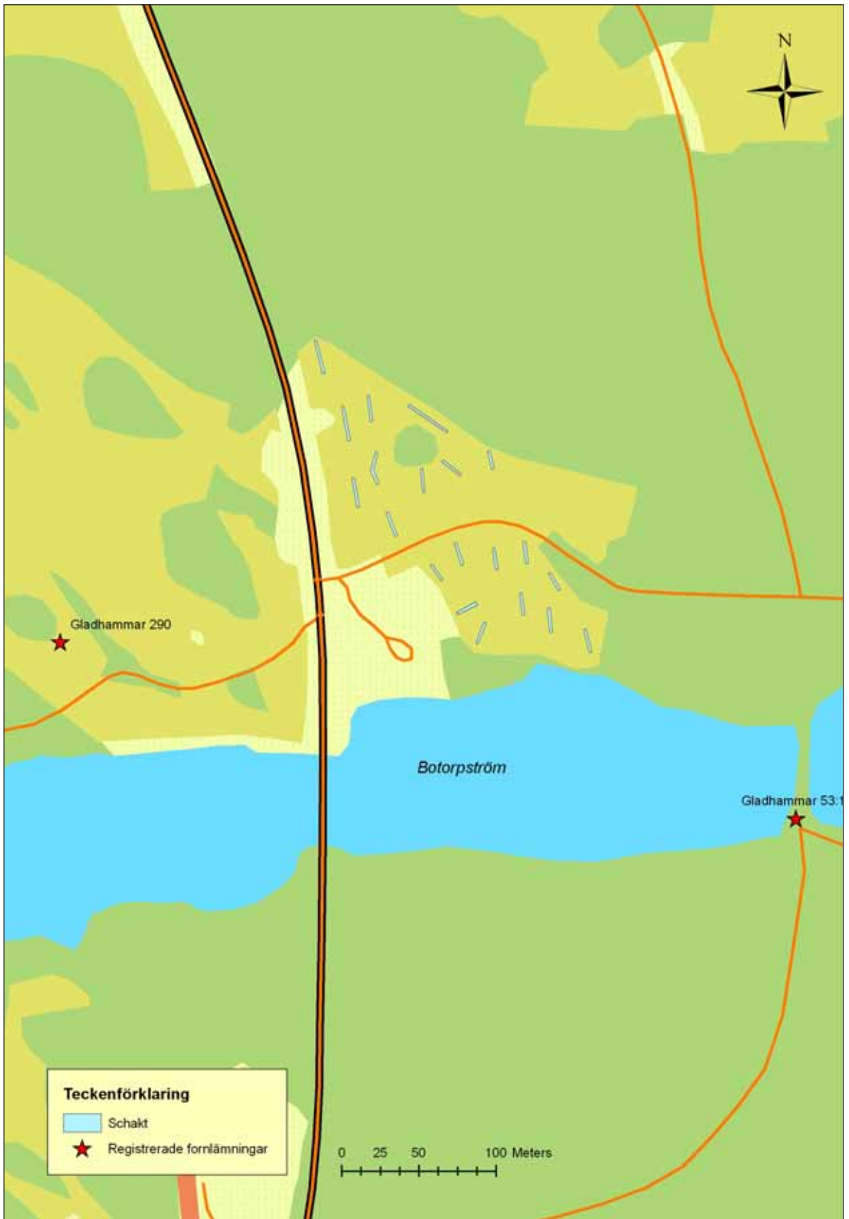
Fig. 1. Schaktplan Botorpström.