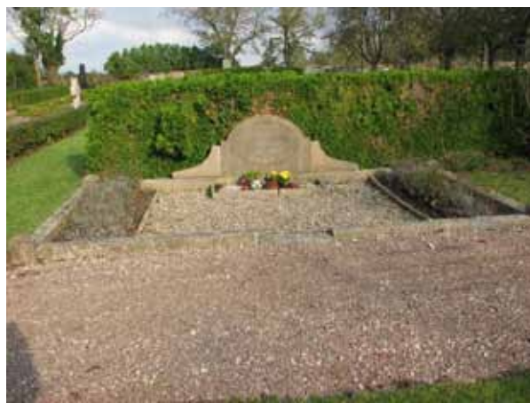
En av två gravplatser med stenram på den norra sidan. Tidstypiskt för 1930-40-tal (KI Resmo kyrkog 052)