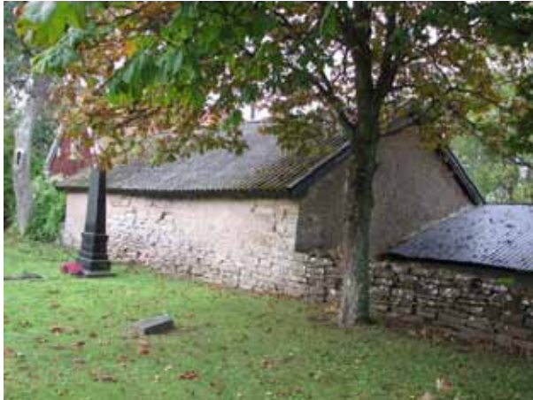
Som en del av den västra kyrkogårdsmuren ligger en av skolans gamla byggnader (KI Resmo kyrkog 012)