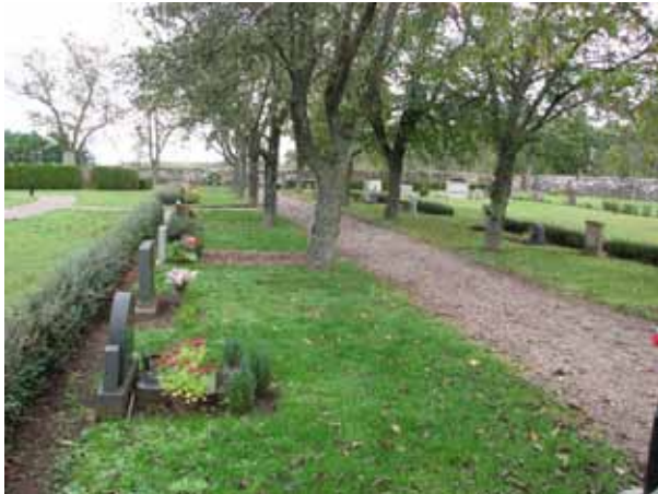
Översikt över kvarter 06 från söder (KI Resmo kyrkog 067)