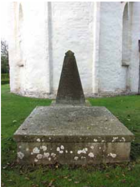
Öster om koret kv 01, de två vårdarna från 1700-talet. Kyrkogårdens äldsta vårdar (KI Resmo kyrkog 022)

På södra delen av kyrkogården finns det vårdar från slutet av 1700-talet och fram till 2000-talet, med en jämn spridning från 1900-talets alla årtionden. Äldst är den redan nämnda gravtumban över häradsposten och hans hustru, från 1792. Strax intill finns ytterligare en gravvård från 1700-talet. Det är en grå kalksten på ett postament av röd kalksten. Den resta stenen avsmalnar upptill och krönet har profilerad kant. Vården restes år 1799 över prosten och kyrkoherden Israel Ahlqvist och hans maka. Från 1800-talet finns det fyra vårdar varav den äldsta är från 1882. En av gravplatserna från 1800-talet har stenram och grusad yta. Utanför stenramen är det en låg buxbomshäck. Två av de med grus belagda gravplatserna har murgrönekullar bevarade, sammanlagt fem stycken. En gravplats omgärdas av gjutjärnskedja mellan pollare av granit.