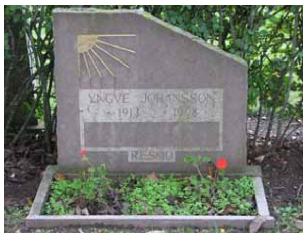
Modern kalkstensvård i kv 07 (KI Resmo kyrkog 076)