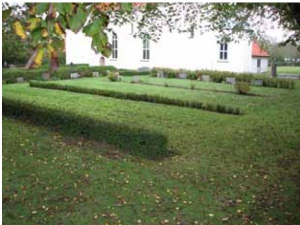
Översikt över kv 01 från sydost (KI Resmo kyrkog 014)

Kvarter 01 och 02 ligger på den södra sidan av kyrkogården och avgränsas åt alla håll förutom i norr av den kallmurade kyrkogårdsmuren. I norr ligger kyrkan. Gravvårdarna är placerade i rader och ryggtällda mot häckar av tuja, ölandstok eller häckoxbär. Ett fåtal gravplatser i kvarter 02 har kvar sina låga häckomgärdningar av buxbom. Mellan kvarteren går en gång av kalksten. Vårdarna är vända åt väster, öster, norr eller söder. I kvarter 02 finns idag endast ett fåtal vårdar som tillkommit efter omlagningen på 1950-talet.