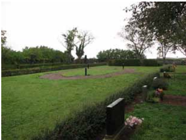
Man håller på att anlägga en minneslund i kv 04 (KI Resmo kyrkog 008)

Församlingen har fått tillstånd och har under 2006 påbörjat arbetet med att anlägga en minneslund i kvarter 04 norr om kyrkan.