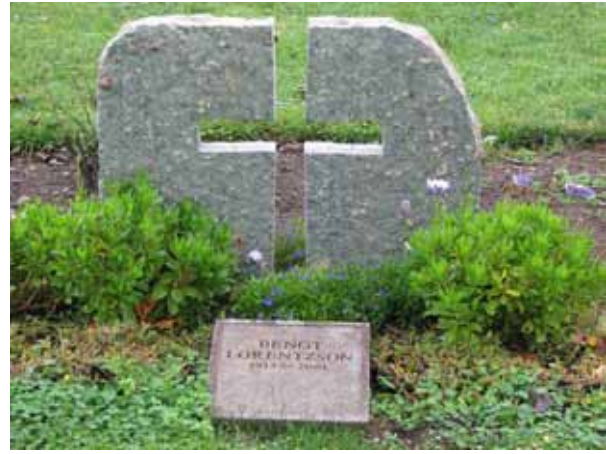
Modern kalkstensvård med "genombrutet" kors (KI Resmo kyrkog 020)

På södra delen av kyrkogården finns det vårdar från slutet av 1700-talet och fram till 2000-talet, med en jämn spridning från 1900-talets alla årtionden. Äldst är den redan nämnda gravtumban över häradsposten och hans hustru, från 1792. Strax intill finns ytterligare en gravvård från 1700-talet. Det är en grå kalksten på ett postament av röd kalksten. Den resta stenen avsmalnar upptill och krönet har profilerad kant. Vården restes år 1799 över prosten och kyrkoherden Israel Ahlqvist och hans maka. Från 1800-talet finns det fyra vårdar varav den äldsta är från 1882. En av gravplatserna från 1800-talet har stenram och grusad yta. Utanför stenramen är det en låg buxbomshäck. Två av de med grus belagda gravplatserna har murgrönekullar bevarade, sammanlagt fem stycken. En gravplats omgärdas av gjutjärnskedja mellan pollare av granit.