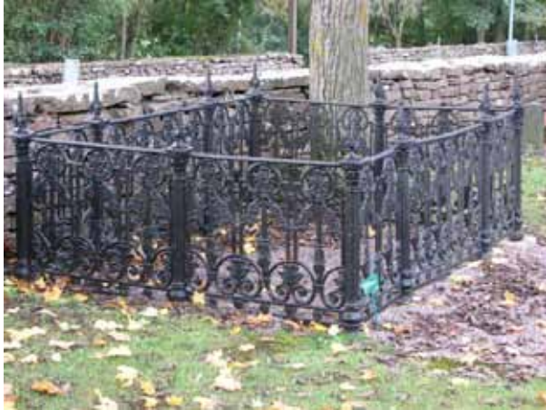
Vackert gjutjärnsstaket kv 02 över kyrkoherden C Ekvall (KI Resmo kyrkog 033)