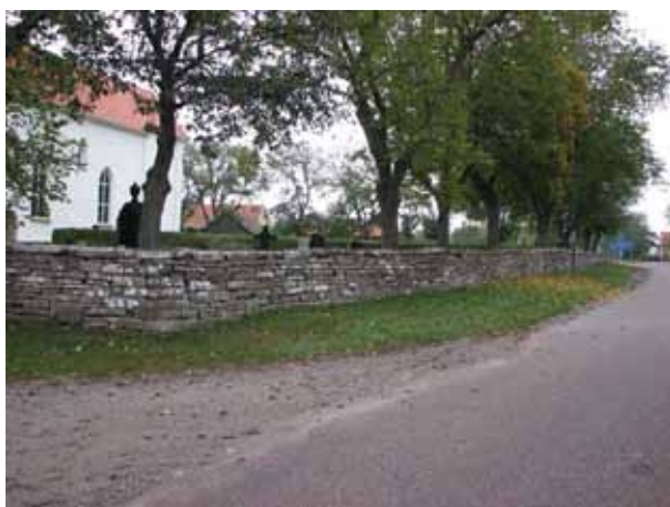
Kyrkogården omgärdas av en kallmurad kalkstensmur (KI Resmo kyrkog 002)

Kyrkogårdsmuren består av en drygt 1 meter hög kallmurad kalkstensmur.