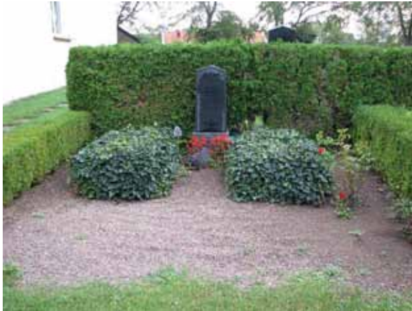
Två av kyrkogårdens bevarade murgrönskullar (KI Resmo kyrkog 031)