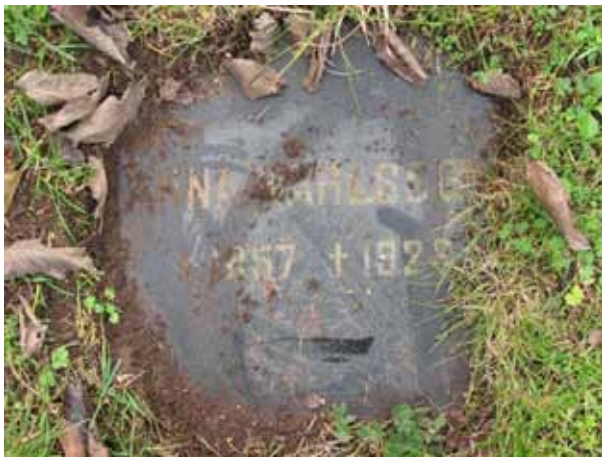
Trolig församlingsgravvård i kv 08 rest över Anna Karlsson 1928 (KI Resmo kyrkog 090)

I kvarteren finns påkostade familjegravvårdar från slutet av 1800-och början av 1900-talen men också enkla församlingsgravar från 1950-talet, i kvarter 08. Kvarteren har brukats kontinuerligt sedan slutet av 1800-talet och äldre vårdar har plockats bort och nya tillkommit vilket ger en blandning av gammalt och nytt. De äldre kvarvarande gravvårdarna från slutet av 1800-talet och 1900-talets första decennier, vårderna med bevarat staket samt församlingsgravvårdarna berättar kvarterets historia. Spåren i form av de äldre gravvårdarna, de ännu häckomgärdade och grusbelagda gravplatserna samt gravplatsen med smidesstaket, men även murgrönskullarna bör bevaras som en länk till hur kyrkogården tidigare sett ut. Större delen av kvarteren norr om kyrkan var grusgravar med murgrönskullar vilket kan ses på fotografier från 1935. Gjutjärnsvårderna samt gjutjärnsstaketet ska föras in på församlingens inventarieförteckning.