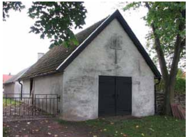
F d bårhuset utgör en del av den östra kyrkogårdsmuren (KI Resmo kyrkog 006)