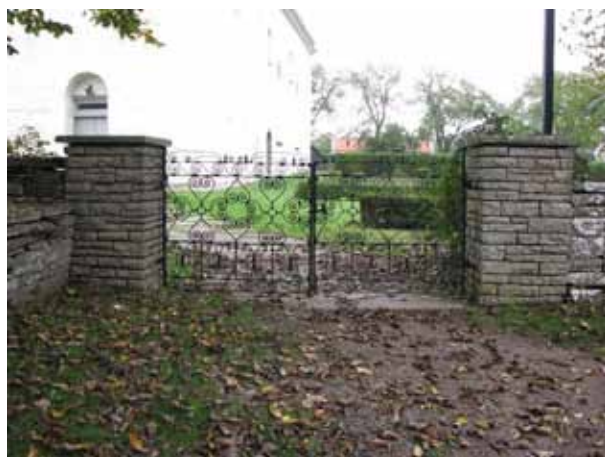
Ingången i väster. Dubbla smidesgrindar mellan murade portstolpar av kalksten (KI Resmo kyrkog 001)