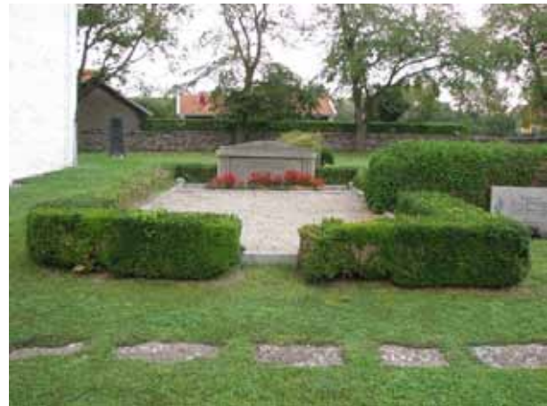
Den här gravplatsen har både stenram och buxbomsomgärdning (KI Resmo kyrkog 018)