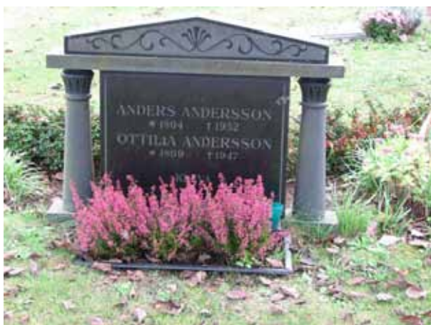
Klassicistisk vård i kv 06, rest 1947 (KI Resmo kyrkog 070)

I kvarter 8 finns den stora tomma yta som skall finnas tillgänglig som krigs kyrkogård vid behov. I samma kvarter intill muren i öster finns också möjlighet att begrava människor med annan trosuppfattning.