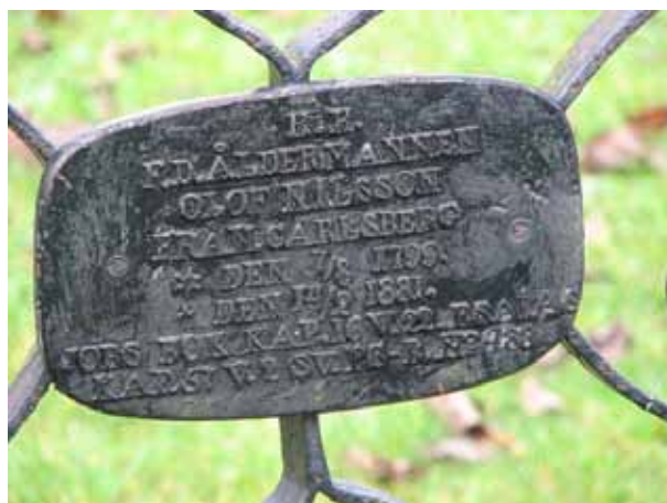
Textplattan sitter på insidan av smidesstaketet (KI Resmo kyrkog 040)