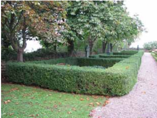
Översikt över kvarter 03 längs västra kyrkogårdsmuren, från söder (KI Resmo kyrkog 045)

vårdar placerade mot rygghäckar av häckoxbär. Vårdarna är vända mot öster, väster, norr och söder.