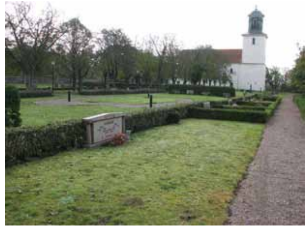
Kvarter 04 och i bakgrunden kvarter 05 från norr (KI Resmo kyrkog 048)