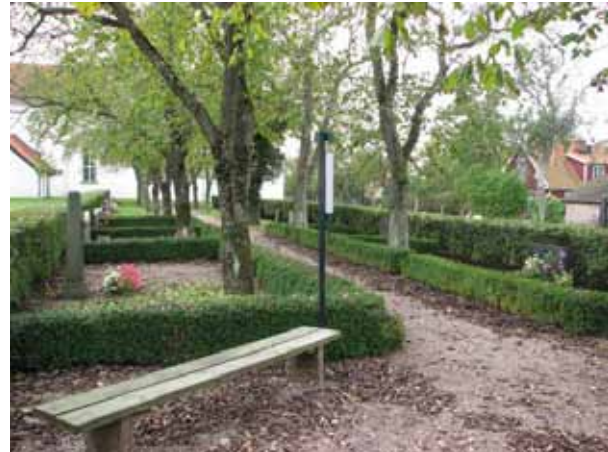
Översikt över kv 07 från norr (KI Resmo kyrkog 073)