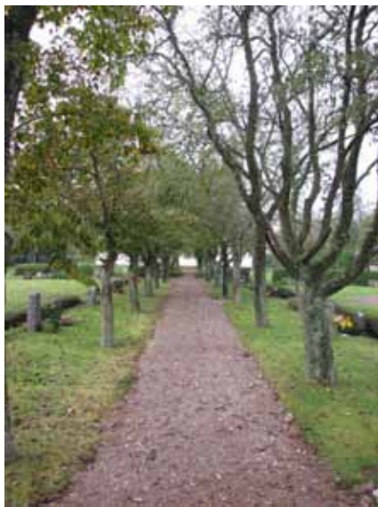
En allé av alm och ek finns på kyrkogården norra sida (KI Resmo kyrkog 009)

Gångarna går i ett rätvinkligt system, öst-väst och nord-syd på bägge sidor om kyrkan. Gångarna är belagda med grus. Fram till vapenhuset från huvudingången i väster leder en gång av kalkstensplattor lagda i gräsmatta. Mellan raderna i kvarter 2 är det gångar av ensamliggande kalkstensplattor.