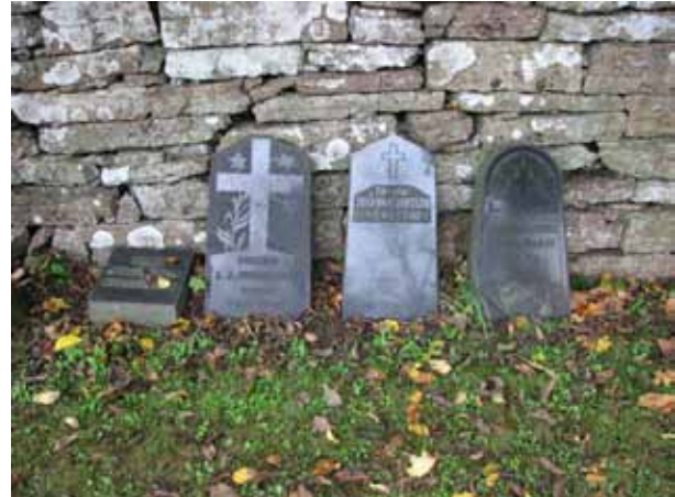
Gravvårdar tagna ur bruk står uppställda mot den östra kyrkogårdsmuren (KI Resmo kyrkog 007)