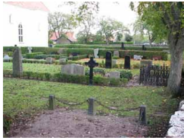
Översikt över kv 02 från sydväst (KI Resmo kyrkog 025)