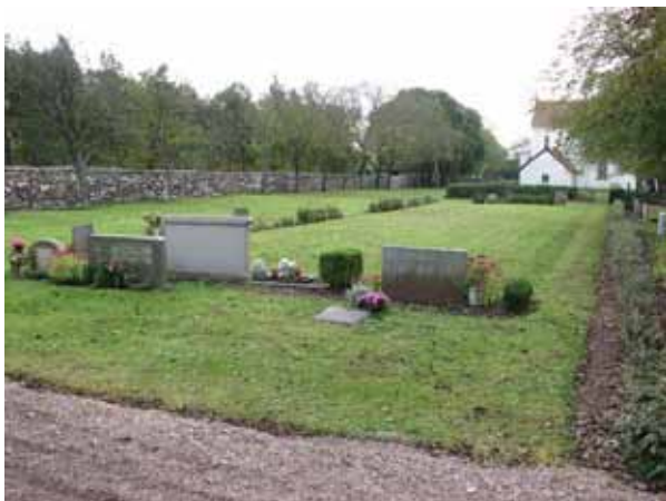
Kvarter 08 från norr (KI Resmo kyrkog 083)