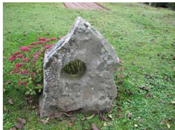
En gammal kvarnsten har återanvänts. På sidan sitter textplattan i form av en kopparskylt (KI Resmo kyrkog 101)