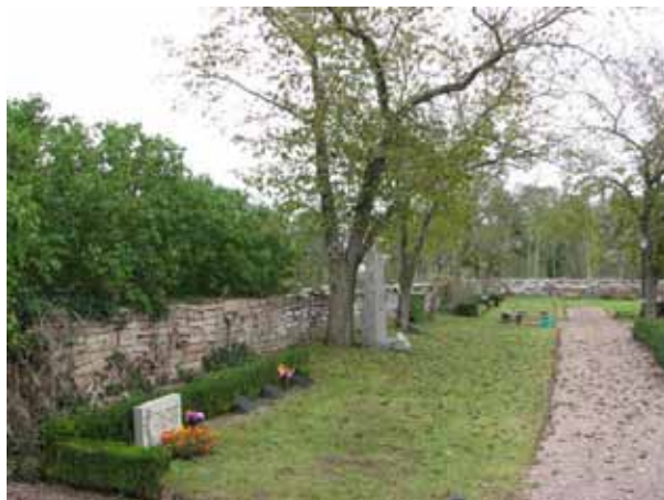
Översikt över kv 09 från väster (KI Resmo kyrkog 095)