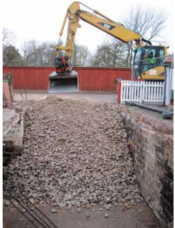
Fig 3. Grävmaskinen fyller källaren med makadam för att kunna köra ut på.

Förundersökningen började med att väggarna till den befintliga källaren först fylldes till hälften med makadam för att maskinen som skulle riva väggarna skulle kunna köra ut i källaren som att nå väggarna lägst bort. Väggarna revs sedan ner med hjälp av maskinen och lastades upp på lastbil och kördes därifrån, se fig. 3. När källarväggarna tagits bort rensades profilväggarna så gott det gick. Rasrisken var stor och delar av väggarna rasade medan arbetet pågick. Då det var så instabilt dokumenterades endast 1 meter av profilväggarna genom ritning resten genom fotografier.