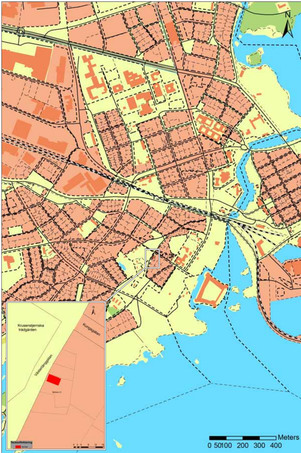
Fig 1. Undersökningsområdet.