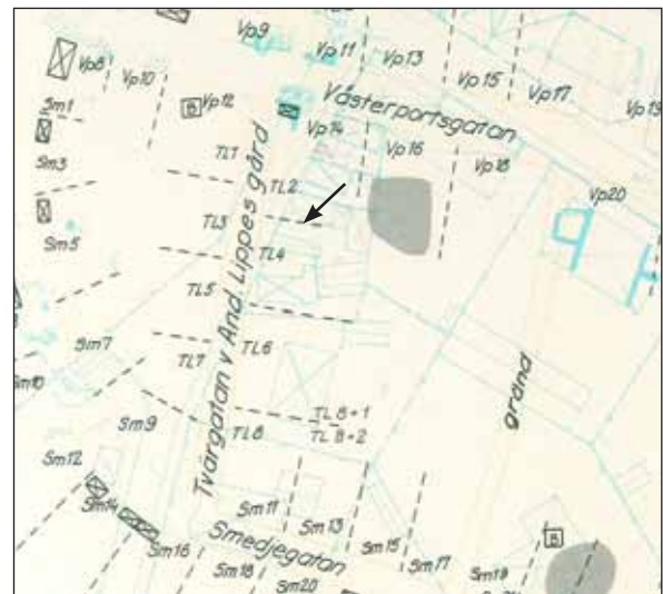
Fig 8. Gränsen mellan Tvärgatan And. Lippes gränd 2 och 4 markerad med en pil.

I det övre kulturlagret som påträffades en keramikskärva. Det var en skärva från ett sk Westerwaldkrus. Dessa stengodskrus kan da-