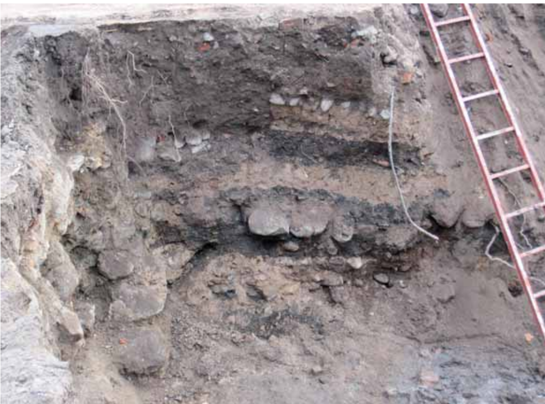
Fig 7. Endast en liten del i den södra profilväggen hade bevarade kulturlager, resten var förstört från tidigare grävningar.