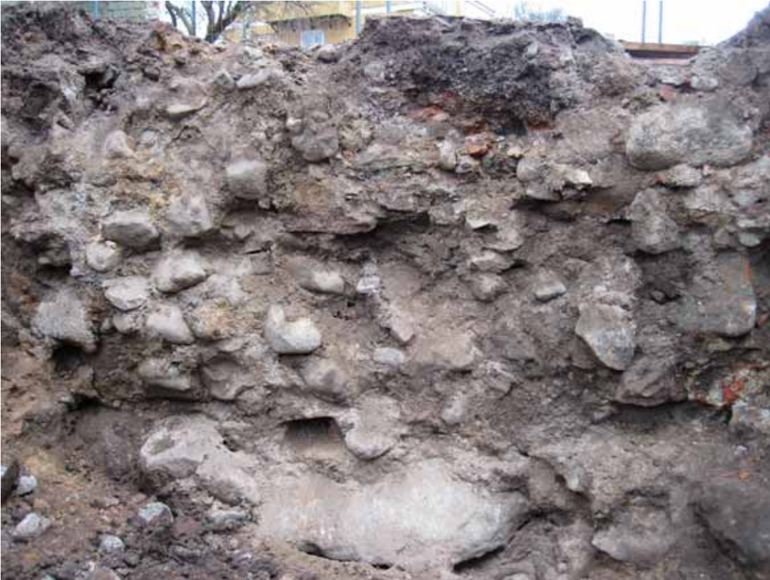
Fig 6. Den dåligt murade källarmuren i väster.