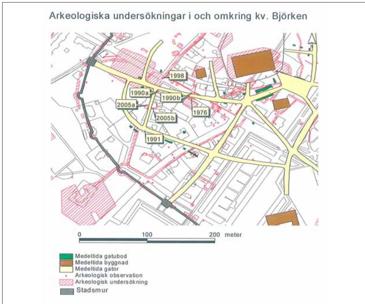
Fig 2. Den medeltida stadsplanen enl. Dagmar Selling. Årtalen refererar till tidigare undersökningar.

innan Gamla Staden förstördes och övergavs på 1600-talet. Fas 4 bestod av ett antal gropar som tillkommit under det befintliga husets tid, mellan 1700-talet och i dag.