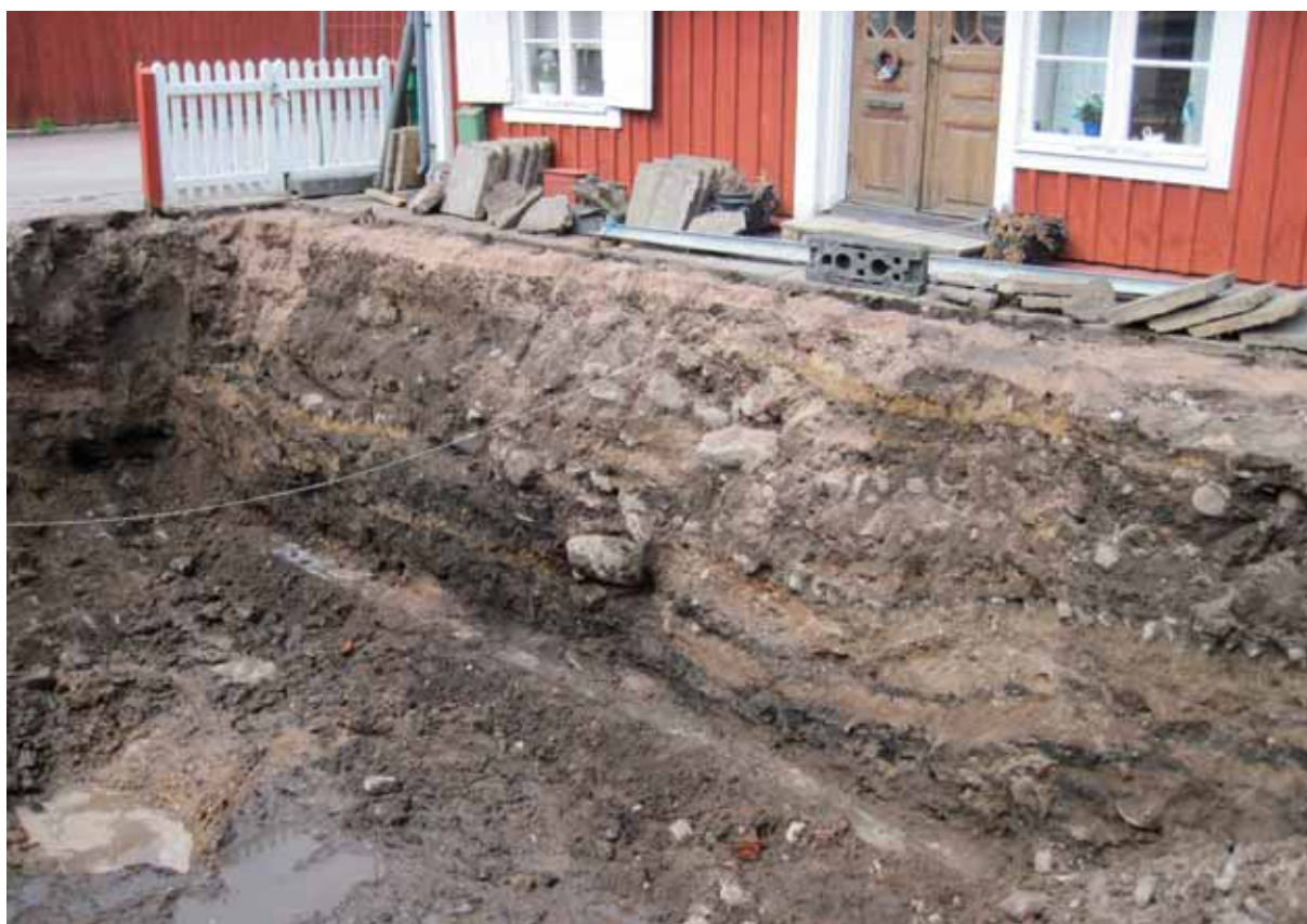
Fig 4. Flera olika kulturlager var bevarade i den norra profilen. Foto från SSO.

Man kunde se att kulturlagren var mer nedtryckta/hoptryckta i mitten av profilen. Möjligen har det stått något tungt, som ett spisröse, på just den delen som gjort att kulturlagren pressats samman hårdare just där.