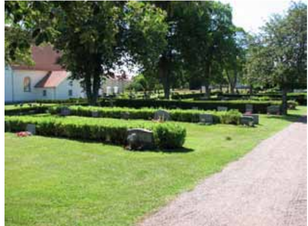
Översikt över kvarter VI (KI Ryssby kyrkog 161)