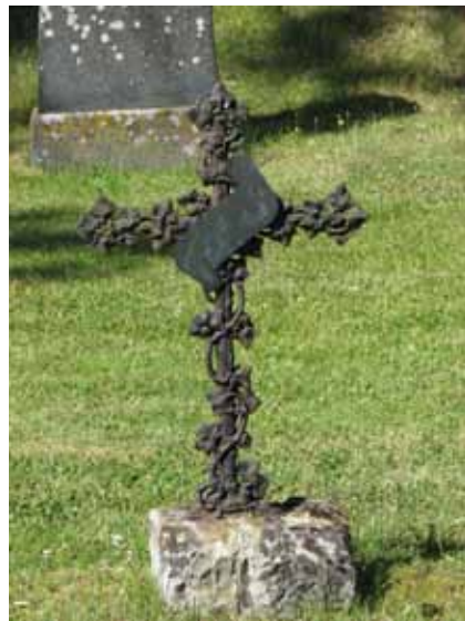
En ovanlig gjutjärnvård, rest 1902 uppställd intill bårhuset (KI Ryssby kyrkog 070)