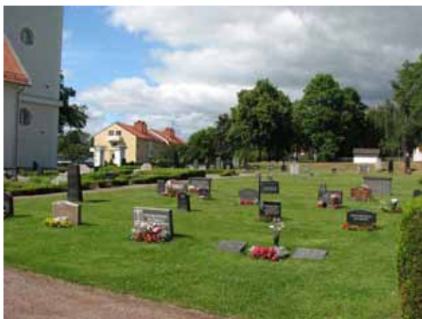
Översikt över kvarter III (KI Ryssby kyrkog 060)

I den yttre ramen av gravvårdar finns en hel del höga, äldre gravvårdar, medan de i de inre områdena har en lägre profil. I de bägge kvarterens mitt finns rester av linjegravssystem från 1920-talet fram till 1950-talet.