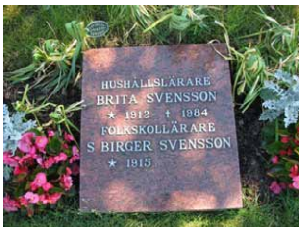
Liggande vård i urlunden (KI Ryssby kyrkog 181)