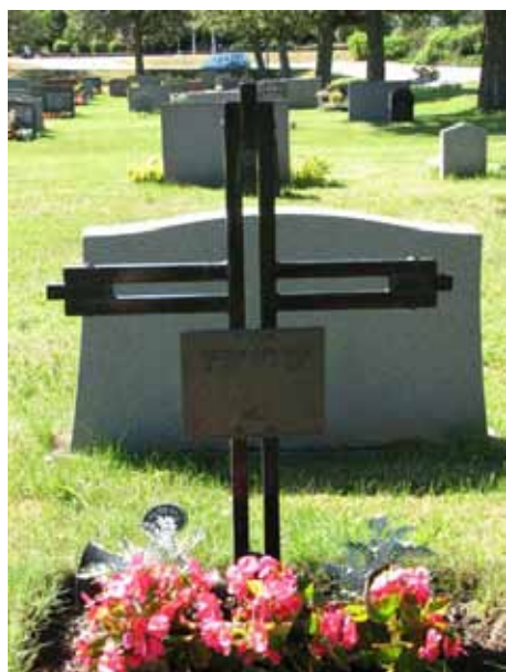
Modern smidesvård, kv VII (KI Ryssby kyrkog 171)