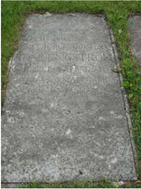
Vården över Jon Engström född 1794 och död 1870 på Knappegården (KI Ryssby kyrkog 026)