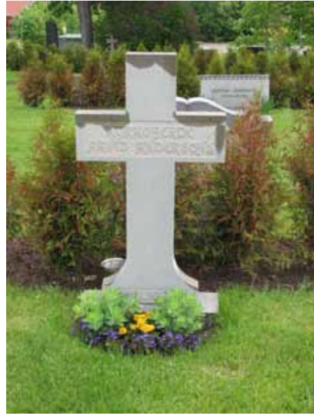
Korsformad, nytillverkad efter branden, vård i kalksten (KI Ryssby kyrkog 045)