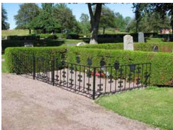
Familjen Rappes gravplats. Notera det fina gjutjärnsstaketet och sköldarna med namn på (KI Ryssby kyrkog 118)

I kvarteren anges den avlidnes yrkestitel framförallt på de köpta gravplatsernas vårdar i kvarterets ytterkanter. Vanligast är lantbrukaren, hemmansägaren och nämndemannen. Övriga titlar som förekommer är: smeden, slaktarmästaren, friherre, friherrinnan, mjölnaren, köpmannen, fiskaren, mästerlotsen, skepparen, fyrmästaren, trädgårdsmästaren, byggmästaren, landstingsmannen, båtsmannen, skräddarmästaren, sy och vävnadsläraren, distriktsveterinären, elinstallatören, kronolotsen, kyrkoherden, kronofogden, tullvaktmästaren, bryggerimästaren, kyrkvården, kyrkvaktmästaren, skeppstimmermannen, folkskollärarinnan, mjölnaremästaren, kontraktsprosten, handlanden, smidesmästaren, sjökaptenen, kronojägaren, lotsförmannen och ryttmästaren. By-/gårdsnamn anges på merparten av vårdarna.