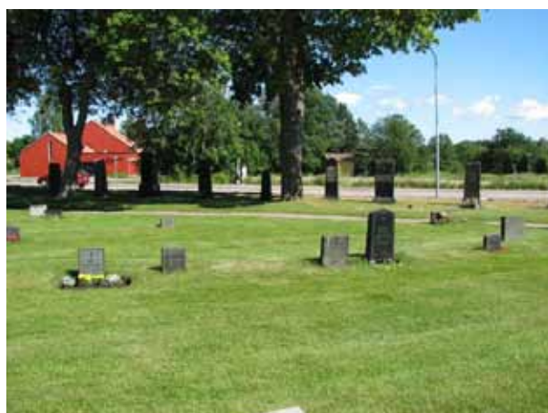
Man kan fortfarande följa linjegravssystemet även om flera vårdar tagits bort (KI Ryssby kyrkog 135)