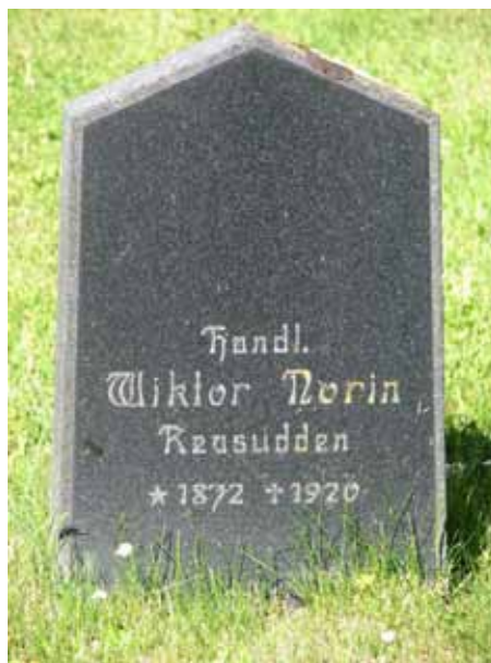
Den äldsta bevarade linjegravsvården i området, kv III (KI Ryssby kyrkog 087)

I kvarteren anges den avlidnes yrkestitel framförallt på de köpta gravplatsernas vårdar i kvarterets ytterkanter. Vanligast är lantbrukaren, hemmansägaren och nämndemannen. Övriga titlar som förekommer är: smeden, slaktarmästaren, friherre, friherrinnan, mjölnaren, köpmannen, fiskaren, mästerlotsen, skepparen, fyrmästaren, trädgårdsmästaren, byggmästaren, landstingsmannen, båtsmannen, skräddarmästaren, sy och vävnadsläraren, distriktsveterinären, elinstallatören, kronolotsen, kyrkoherden, kronofogden, tullvaktmästaren, bryggerimästaren, kyrkvården, kyrkvaktmästaren, skeppstimmermannen, folkskollärarinnan, mjölnaremästaren, kontraktsprosten, handlanden, smidesmästaren, sjökaptenen, kronojägaren, lotsförmannen och ryttmästaren. By-/gårdsnamn anges på merparten av vårdarna.