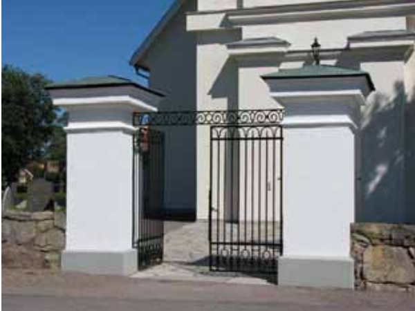
Ingången i väster (KI Ryssby kyrkog 203)