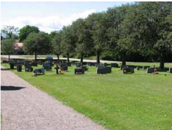
Översikt över kvarter VII (KI Ryssby kyrkog 162)

Kvarter V-VIII ligger längst i norr och nordost och utgörs av den utvidgning som gjordes på 1950-talet. I kvarteren finns platser planerade för nästan 1000 kistgravar och 138 urngravar. I områdets nordöstra del är kyrkogårdens senaste tillskott, minneslunden. Den invigdes 1997. Kvarteren omgärdas av den vallmur i väster och norr som uppfördes samtidigt med utvidgningen, i nordost är en stödmur och i söder utgör den gamla kyrkogårdsbegränsningen med den gamla trädkransen gräns. En höjdskillnad skiljer de olika delarna åt. En ingång finns från parkeringen i väster och en trappa leder upp till kyrkogården i nordost. Ytterligare en trappa och en grusgång förbinder den nya och den gamla delen. Urnlunden avgränsas med en låg vallmur. I kvarter V och VI står vårdarna mot häckar av spirea, tuja eller ölandstok. I kvarter VII och VIII finns inga rygghäckar. Ett par oxelträd är planterade inne i kvarteren. Trädkransen i norr utgörs också den av oxel. Gravvårdarna är placerade i gräsmatta. Vårdarna är låga och relativt jämnstora.