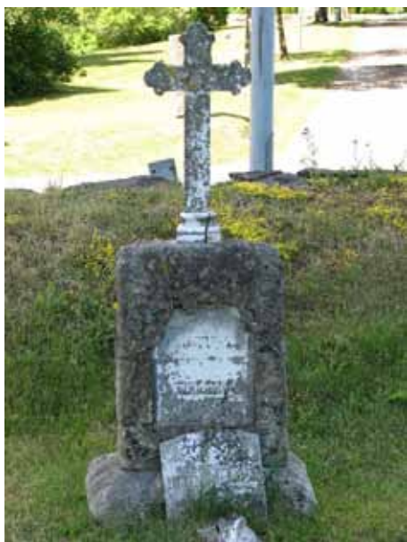
Sandstensvård med marmorplatta och kors. En marmorplatta till en idag försvunnen vård ligger framför (KI Ryssby kyrkog 064)

gjutjärnsstaket är en häst avbildad på grinden. Vårdarna är sköldformade plåtar som är fästa på staketet.