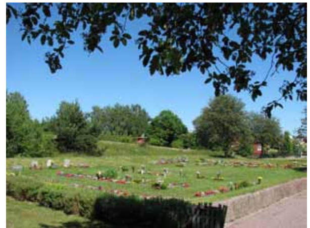
Översikt över urngravsområdet, kvarter VIII(KI Ryssby kyrkog 174)