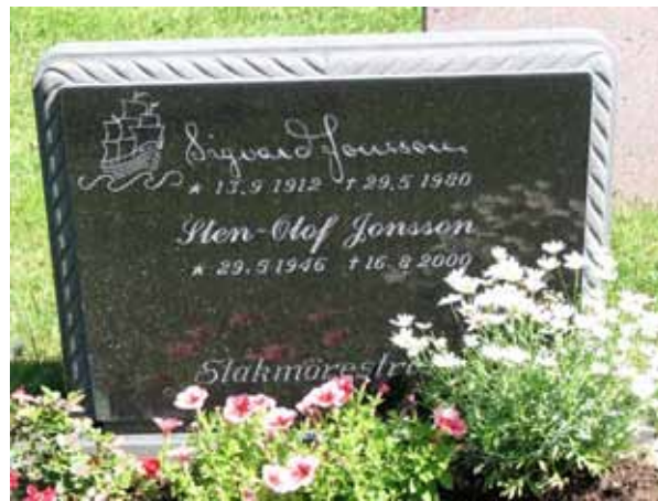
En lite ovanlig typ av modern vård (KI Ryssby kyrkog 166)