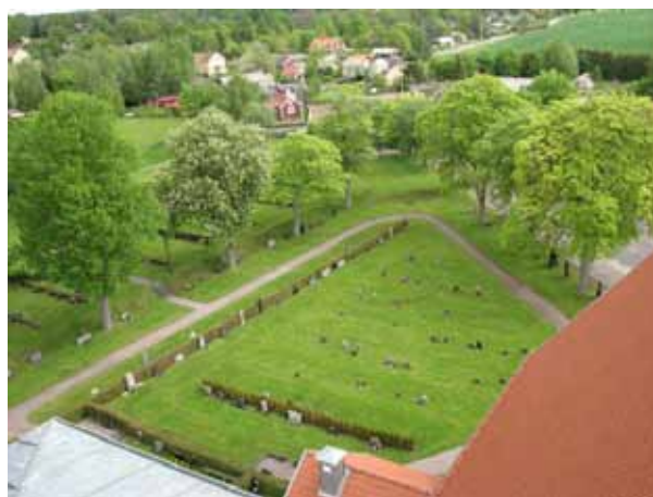
Översikt över kvarter IV (KI Ryssby kyrkog 055)