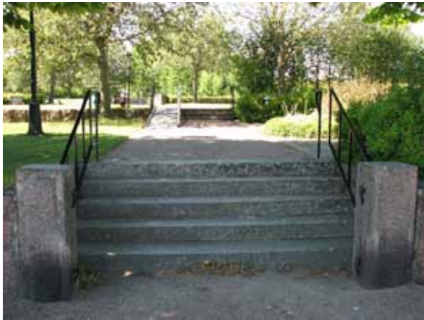
Två trappor leder upp till nivån på den nya delen av kyrkogården. Till vänster skimtar en stödmur från utvidgningen 1957 (KI Ryssby kyrkog 189)