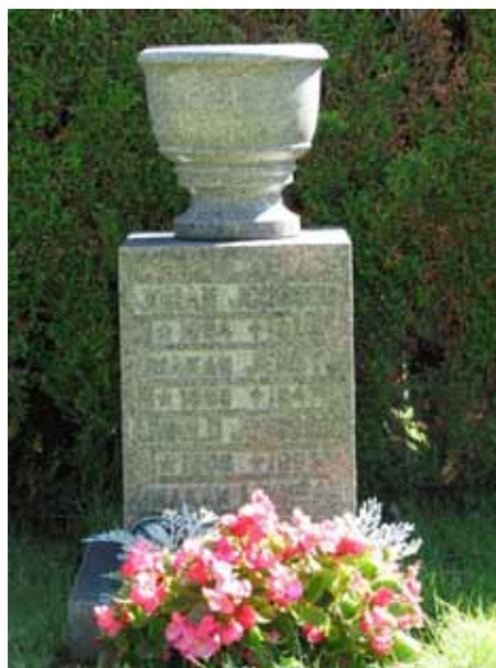
Lantbrukaren J.P Svenssons familjegrav, Pikemåla (KI Ryssby kyrkog 115) Vård från 1925 med urna (KI Ryssby kyrkog 126)