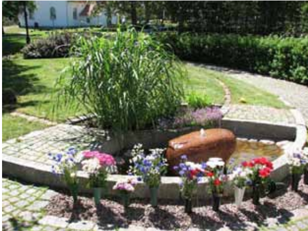
Minneslunden tillkom 1997 (KI Ryssby kyrkog 188)