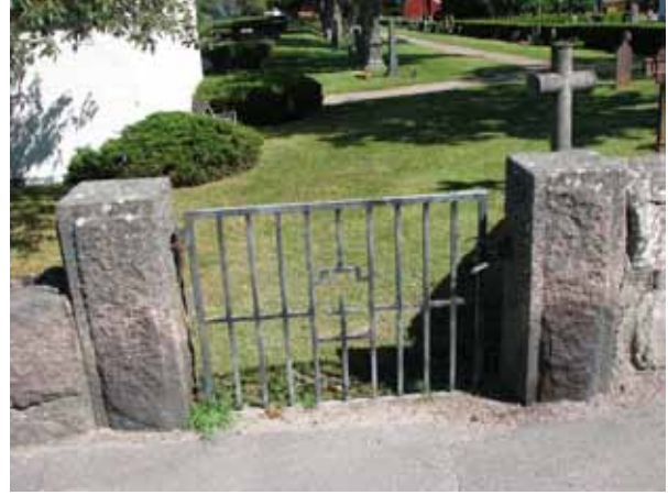
Grinden i nordväst som troligen användes mer innan utvidgningen. Idag är den "låst" och används ej (KI Ryssby kyrkog 196)

I väster: En ingång mitt för vapenhuset med svartmålade smidesgrindar mellan höga, kraftiga, vitputsade grindstolpar med tälttak av koppar. Ytterligare en ingång i väster, vilken sannolikt tidigare var en ingång in till den norra delen av dåvarande kyrkogården. I och med utvidgningen 1957 förlorade den sin betydelse och används numera inte utan är igensatt. Det är en svartmålad smidesgrind mellan stolpar av granit. Längst i nordväst finns en ingång mellan granitstolpar utan grind.