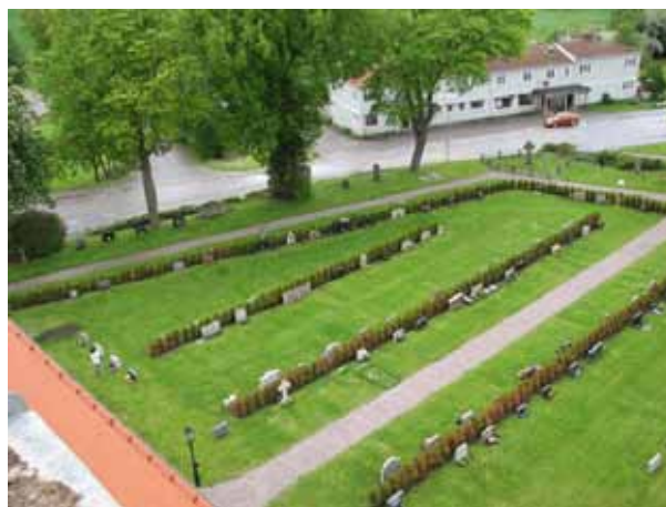
Översikt över kvarter II (KI Ryssby kyrkog 049)