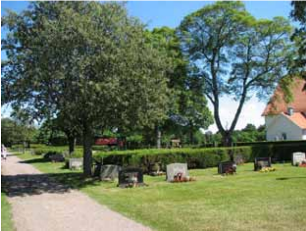
Översikt över kvarter V (KI Ryssby kyrkog 141)