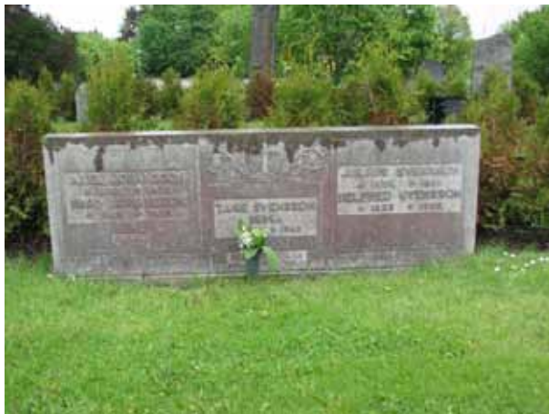
Bred familjevård från 1940-tal i kalksten (KI Ryssby kyrkog 039)