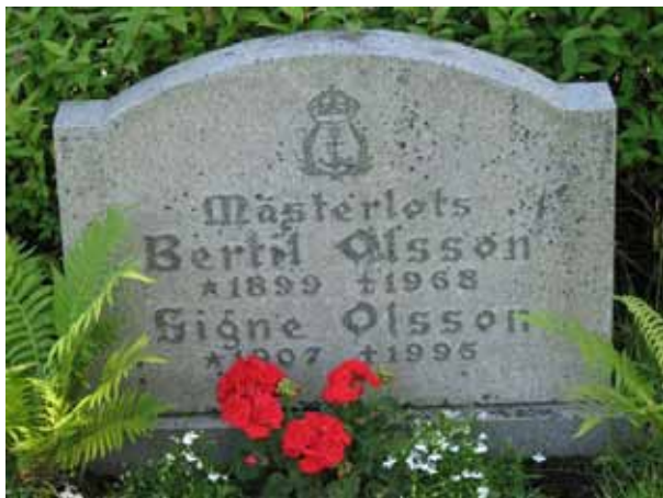
Ett fåtal vårdar i kvarteren har titlar (KI Ryssby kyrkog 144)

By eller gårdsnamn anges på drygt hälften av vårdarna. Den avlidnes yrkestitel anges på ett mindre antal av vårdarna. Hemmansägare är det vanligaste. Övriga titlar som finns i kvarteren är, skepparen, mästerlotsen, byggmästaren, postiljon, trädgårdsmästaren, charkuterihandlaren, nämndemannen, smedmästaren, affärsföreståndaren, skepparen, sadelmakarmästaren, fiskaren, montören, gästgivaren, hushållsläraren, folkskolläraren, smidesmästaren, bildhuggaren och sjökaptenen.