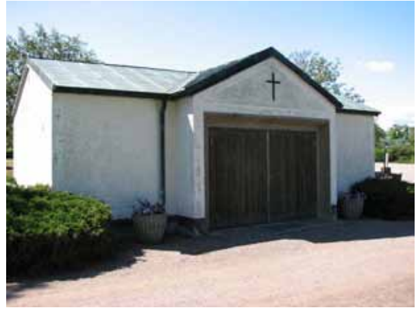
Bårhuset uppfört 1956 i den västra delen av kyrkogården (KI Ryssby kyrkog 199)