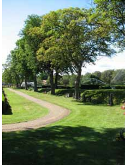
Grusade gånger och den äldre delen av kyrkogårdens trädkrans som är en del av kyrkogårdens gräns mellan den äldre och nyare delen (KI Ryssby kyrkog 214)