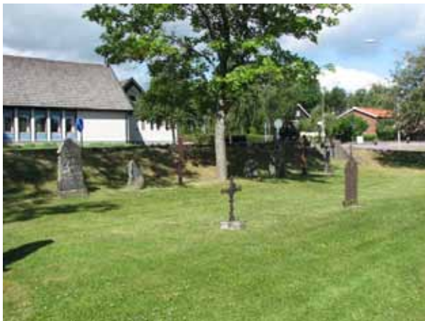
Musealt uppställda vårdar i kv III intill bårhuset (KI Ryssby kyrkog 069)

I samband med utvidgningen på 1950-talet och bårhusets uppförande avsattes en yta öster om det samma för att ställa upp vårdar som tagits ur bruk.