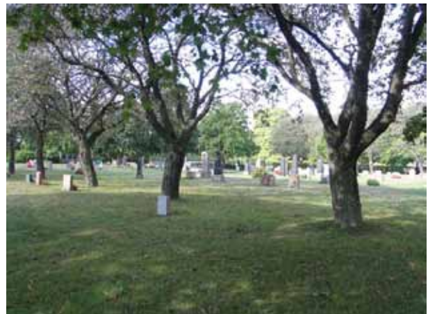
Rad med oxlar i östra delen av kvarter A. (KI Sandby kyrkog 018)