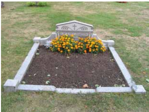
Gravplats omgärdad med stenram och belagda med öppen jord. Gravvården har en utformning typisk för 1940-50-talet. (KI Sandby kyrkog 038)