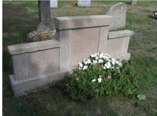
Påkostad gravvård av kalksten från 1940-talet i kvarter B. (KI Sandby kyrkog 033)