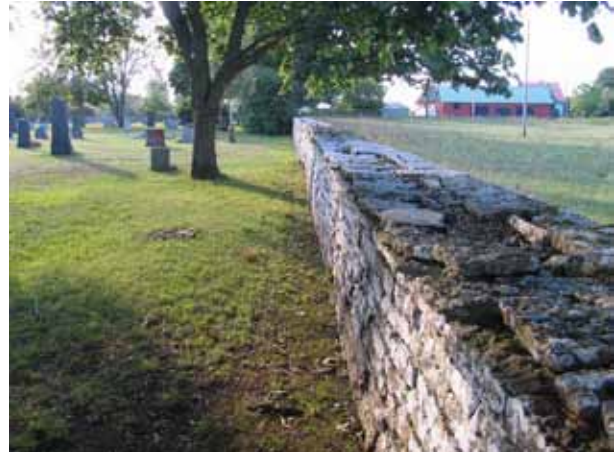
Kyrkogårdsmuren i söder. (KI Sandby kyrkog 007)