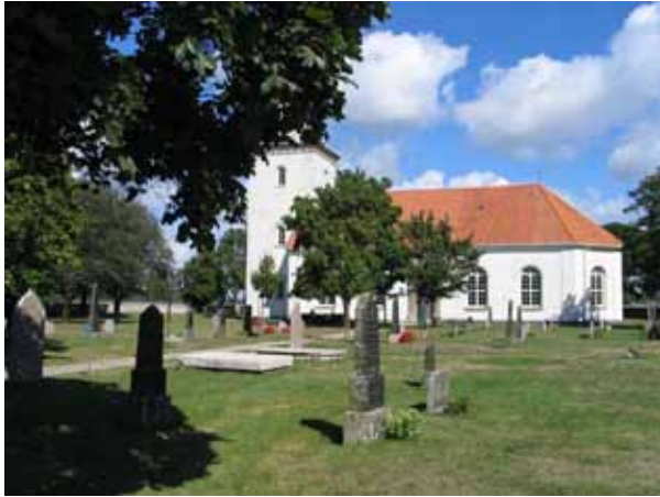
Delar av kvarter A från söder. (KI Sandby kyrkog 050)