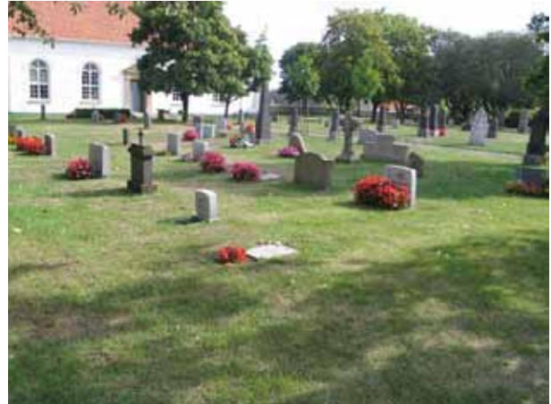
Delar av kvarter B från söder. (KI Sandby kyrkog 029)