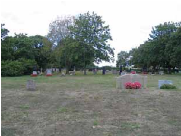
Kvarter C från öster. (KI Sandby kyrkog 035)