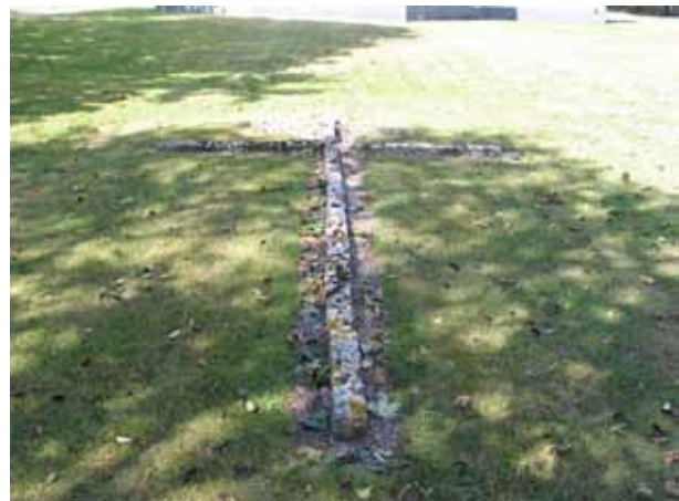
Patriarkerkorsen i gräsmattan öster om kyrkan. (KI Sandby kyrkog 057)