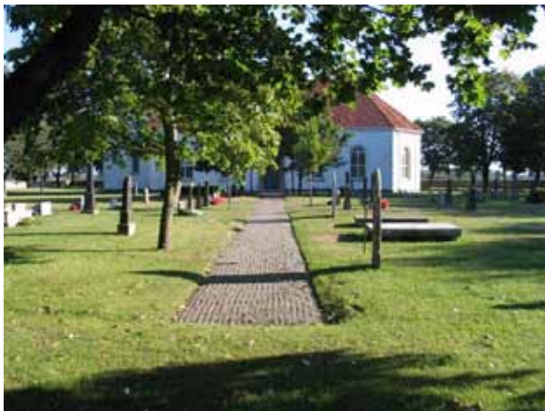
Grusgång från kyrkans södra ingång. Till höger i bilden syns de två gravtumborna och två runstenarna i kvarter A. (KI Sandby kyrkog 012)

Se vidare i de enskilda kvartersbeskrivningarna.