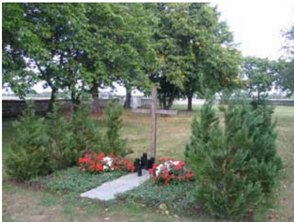
Minneslundan. (KI Sandby kyrkog 049)

Minneslundan anlades 1999 väster om kvarter B. Platsen omges i söder och i norr av häckar av tuja. I norra delen står ett enkelt träkors. Framför det finns rabatter, en yta belagd med kalksten där man kan placera ljus samt en hållare för blomvaser. I söder finns en bänk.