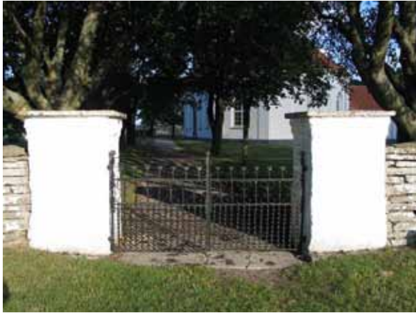
Ingången till kyrkogården i öster. Grindarna är smidda av August Klinth. (KI Sandby kyrkog 001)