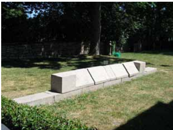
Minnesmonument över de brittiska sjömän som dog strax efter 1:a världskriget (KI Segerstads kyrkog 096)

I kvarteret finns ett en så kallad gemensamhetsgrav över 14 engelska sjömän från minsveparen Catspaw, som förläste utanför Segerstad en stormig vinternatt strax efter första världskriget. Kvarlevorna flyttades dock till Göteborg på 1960-talet meddelar en skylt på engelska som finns på monumentet.