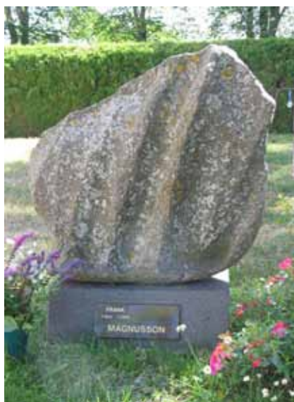
Naturen har format stenvården, rest 2004 (KI Segerstads kyrkog 035)