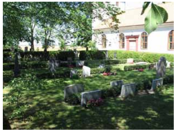
Översikt över kv B från SO (KI Segerstads kyrkog 043)