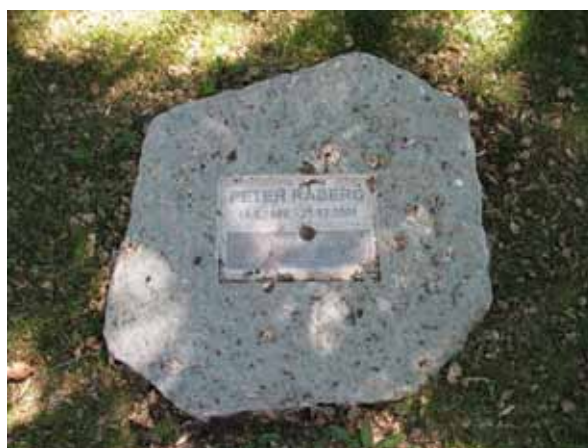
Modern, liggande, kalkstensvård (KI Segerstads kyrkog 079)