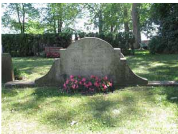
Bred kalkstensvård från 1930-talet (KI Segerstads kyrkog 033)

Som en del av nuvarande kvarter A finns kvarter F, se gravkarta. Kvarter F består av 5 gravplatser varav endast tre har kvar sina gravvårdar. Det var tidigare tänkt att vårdarna i kvarter F efter hand skulle tas bort. De vårdar som ingår i kvarter F behandlas i rapporten som en del av nuvarande kvarter A.