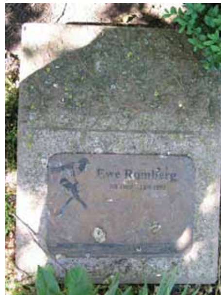
Liggande vård med kopparskylt (KI Segerstads kyrkog 057)