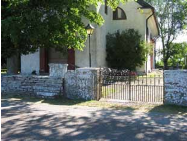
Svartmålad smidesgrind i väster. Notera klivstättan till vänster om grinden (KI Segerstads kyrkog 006)