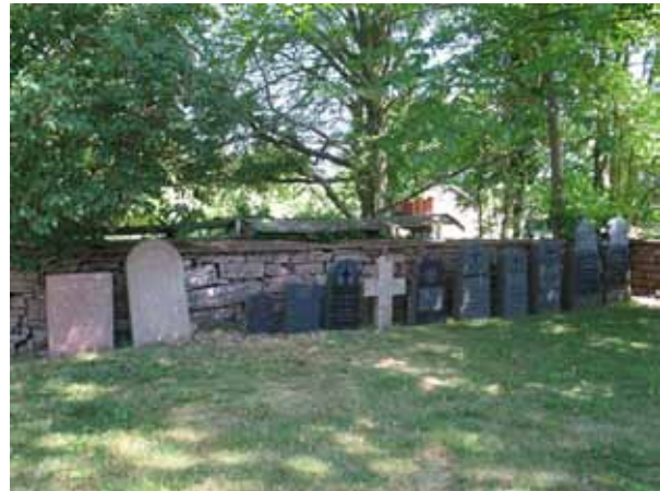
Vårdar som plockats bort står uppställda längs den norra muren (KI Segerstads kyrkog 064)