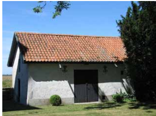
Före detta bårhuset ligger i kyrkogårdens nordvästra hörn (KI Segerstads kyrkog 088)