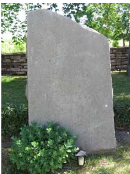
Konstnären Per Ekströms gravvård rest 1935 (KI Segerstads kyrkog 072)