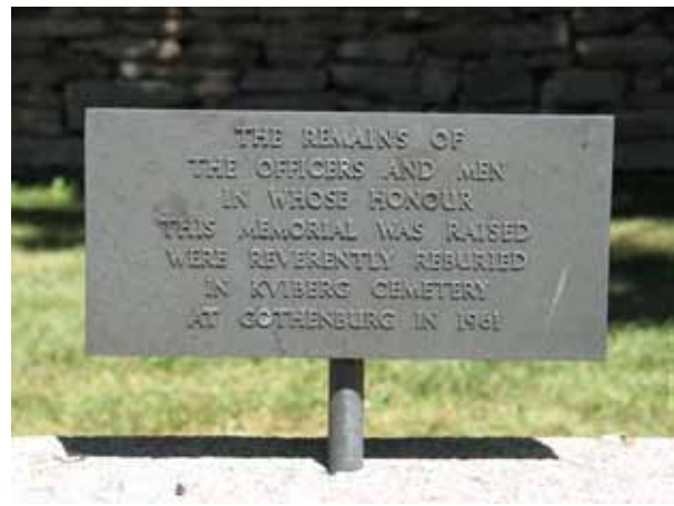
Skylden på minnesvården talar om att de inte längre ligger begravda här utan i Göteborg (KI Segerstads kyrkog 098)