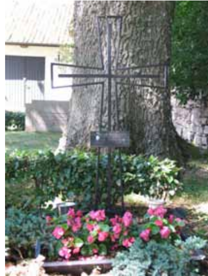
Översikt över kv D från SO (KI Segerstads kyrkog 086) Modern vård av järn, kv D (KI Segerstads kyrkog 095)