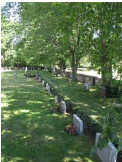
Översikt över kv C från SV (KI Segerstads kyrkog 076)