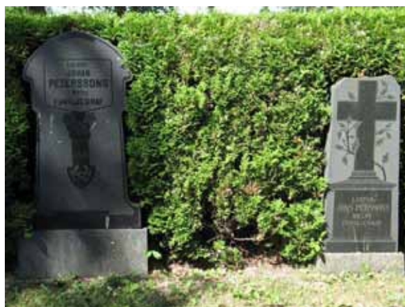
Två svarta blankpolerade, tidstypiska, granitvårdar över två lantbrukarfamiljer från Mellby, kv B (KI Segerstads kyrkog 048)

I kvarteren anges den dödes yrkestitel på en mindre del av vårdarna. De vanligaste är hemmansägare och lantbrukare. Övriga titlar är korpralen, sjökaptenen, skräddaremästare, smedmästaren, nämndemannen, nämndemannens dotter, fyrmästare, handlanden, kopparslagarmästaren, åldermannen och hemmansägaren. By-/gårdsmamn anges på merparten av vårdarna.