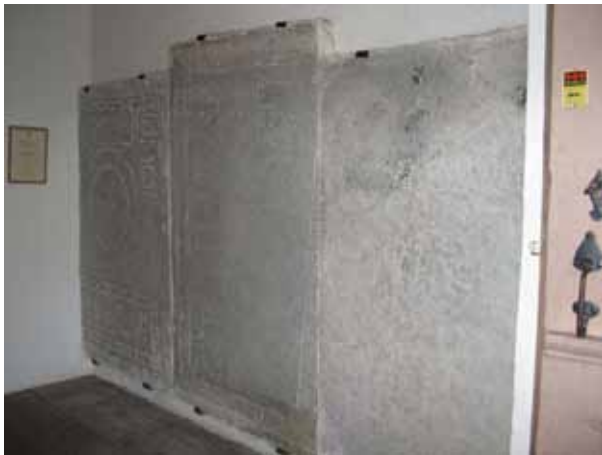
Gamla gravhällar, från 1600- och 1700-talen, hänger på väggarna inne i vapenhuset (KI Segerstads kyrkog 013)

uppbyggnaden med parställda pelare samt de raka eller flackt trekantiga krönen. På de flesta kyrkogårdar infördes regler för hur höga gravvårdarna fick vara. Från slutet av 1950-talet och framåt blev gravvårdarna enklare och mer enhetligt utformade. Vårdarna är rektangulära med ett enkelt kors eller blomsterslinga som dekor. På 1970-talet började man att dekorera gravvårdarna med talldungar och uppgående solar. Under 1990-talet kan man se en uppluckring av bestämmelserna kring gravvårdarnas utformning. Idag är formerna mer varierande och ofta mjukare. Under 1900-talets första hälft var det vanligt att man omgärdade gravplatserna och belade dem med grus. På Segerstads kyrkogård har funnits omgärdningar i form av häckar och stenramar. Idag finns endast enstaka rester kvar av detta. Under 1900-talets första hälft var det också vanligt att ange den dödes yrkestitel på gravvården. På Segerstads kyrkogård finns gravvårdar med titlar men inte i någon större omfattning. Titlarna försvann i det närmaste i mitten av århundradet. På landsortskyrkogårdar har det under hela 1900-talet varit vanligt att ange från vilken by eller gård den döde kommer. På Segerstads kyrkogård finns det angivet på majoriteten av vårdarna.