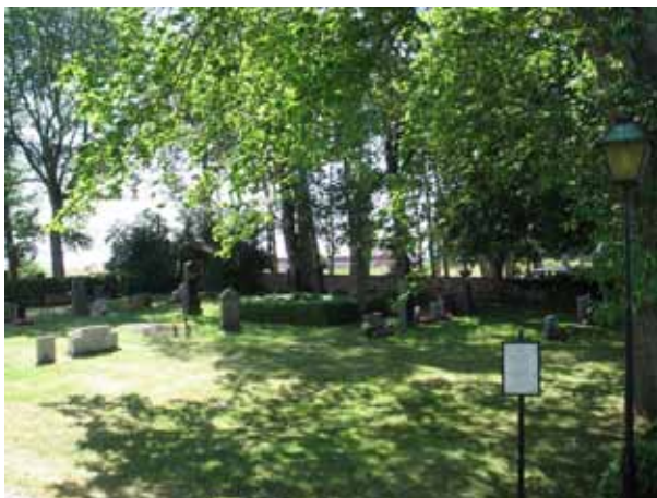
Översikt över kvarter A från NV (KI Segerstads kyrkog 019)