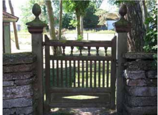
En enkel trägrind leder in till kyrkogården i söder (KI Segerstads kyrkog 016)