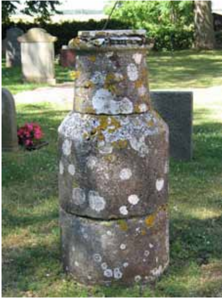
Solur av kalksten i kv A, delar av 1100-tals kyrkan (KI Segerstads kyrkog 038)