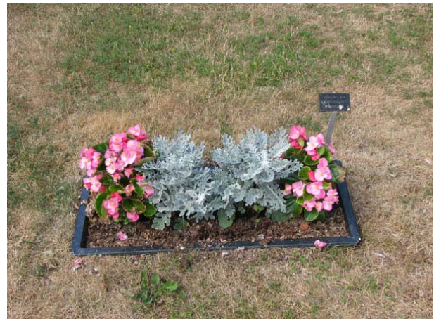
Vissa gravplatser saknar vård och endast en plantering visar platsen (KI Smedby kyrkog 110)