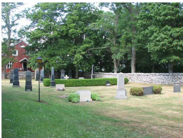
Översikt över den norra sidan av kyrkogården från sydost (KI Smedby kyrkog 109)