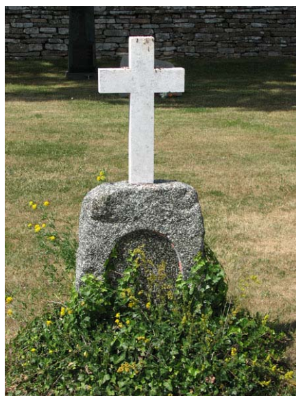
Granitvård med marmorkors från 1892 söder om kyrkan (KI Smedby kyrkog 079)