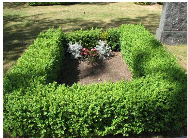
Gravplatsen har ingen vård men platsen omgärdas av buxbom och gravplanen är belagd med jord (KI Smedby kyrkog 081)