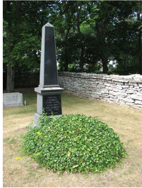
Kyrkogårdens enda murgrönskulle och en obeliskformad vård på norra sidan av kyrkan rest över sjökaptenen A Peterson och hans hustru 1892. De avled med endast några dagars mellanrum (KI Smedby kyrkog 102)