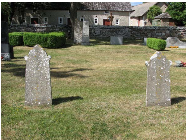
Två kalkstensvårdar, den till vänster rest 1859 och den till höger 1845 (KI Smedby kyrkog 074)

På ungefär hälften av alla vårdar är den dödes yrkestitel angiven. Vanligast är lantbrukare. Andra titlar som förekommer är kontraktsprosten, hemmansägaren, sjökaptenen, kantor och folkskolläraren, trädgårdsmästaren, smedmästaren, skepparen, nämndemannen, snickarmästaren, ”machinisten”, kyrkovaktmästaren, lärarinnan, köpmannen, prosten, kyrkoherden, provinsialläkaren, advokaten, sjöingenjören, lärarinnan, kyrkovärden och professorn. By/gårdsnamn anges på merparten av vårdarna.