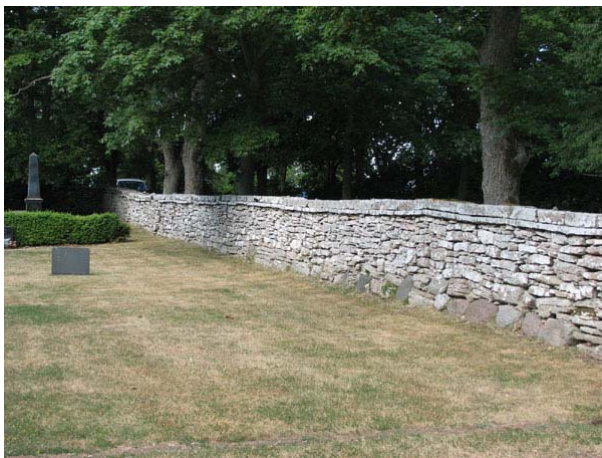
Kalkstensmuren i norr. Notera inslaget av gråsten i botten av muren (KI Smedby kyrkog 111)

Hela kyrkogården omgärdas av en kallmurad kalkstensmur med visst inslag av gråsten. På 1990- och 2000-talet har delar av muren restaureras då träden gör att den rasar.