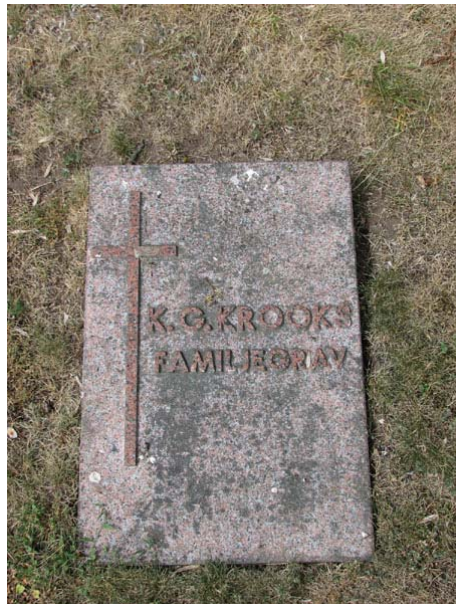
En av kyrkogårdens få liggande vårdar på norra sidan av kyrkan (KI Smedby kyrkog 095)

Kyrkogården omgärdas åt alla håll av kyrkogårdsmuren i kalksten. Sammanlagt skall det enligt gravkartan finnas 535 gravplatser. Kyrkogården har idag ingen kvartersindelning och gravplatserna ligger utspridda i ett oregelbundet mönster. Det finns inte heller några markerade gångar. Flera av gravplatserna var ända fram till början av 1990-talet omgärdade med häckar av dessa återstår endast ett fåtal. Alla vårdarna är vända mot väster och öster och hela kyrkogården är insädd med gräs.