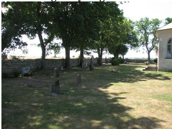
Översikt över det östra området från norr (KI Smedby kyrkog 028)