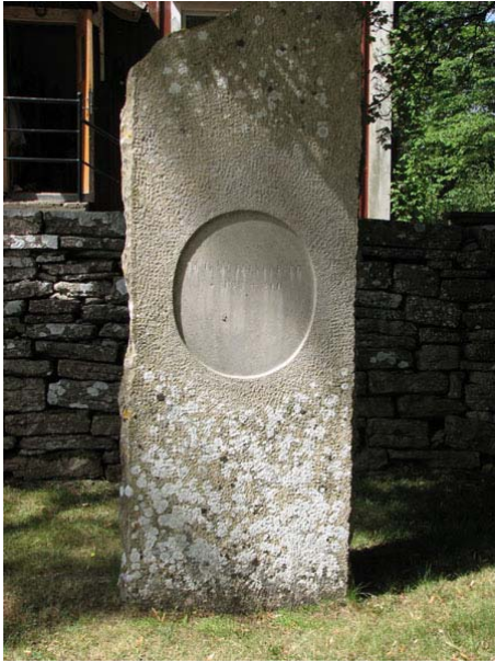
Nationalromantisk kalkstensvård rest 1900 över M G W Falkenberg på norra sidan av kyrkan (KI Smedby kyrkog 097)