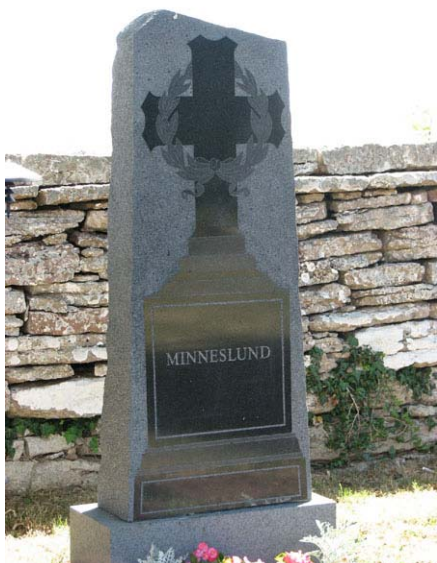
En äldre vård har återanvänts i minneslunden (KI Smedby kyrkog 037)