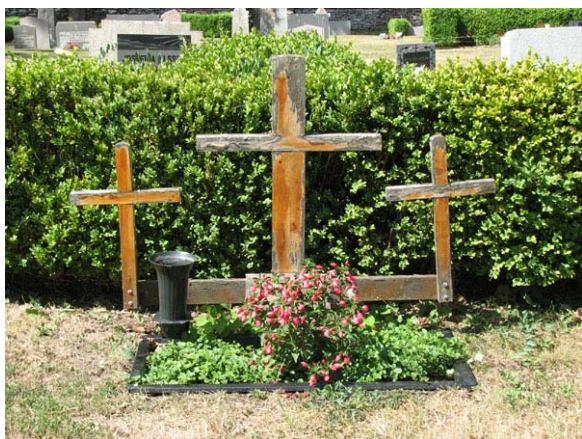
Trävård rest 1995 på södra delen av kyrkogården (KI Smedby kyrkog 055)

dock själva vårderna ut att vara gjorda senare. Kanske har den ersatt en tidigare vård eller möjligen har man slipat om stenen. Den äldsta vårderna på den norra sidan är från 1867. Under 1900-talet är det en jämn spridning av vårdar från de olika årtiondena. Materialen är främst svart och grå granit, men även röd förekommer. De äldsta vårdarna och flertalet av vårdarna från 1800-talet är dock gjorda i kalksten. På den norra sidan är de flesta vårdarna höga stående, blankpolerade svarta granitvårdar från slutet av 1800-talet och början av 1900-talet. Två vårdar på södra sidan, är gjorda i trä, varav den ena föreställer tre kors och den andra ett enkelt kors. En granitvård har ett kors av marmor. Ett fåtal vårdar är korsformade. Enstaka vårdar har nationalromantiska stildrag och vårdarna från 1930-talet är mycket breda. Norr om kyrkan växer det buskar av tuja eller buxbom vid ett par av gravplatserna och i området finns kyrkogårdens enda bevarade murgrönskulle. Kyrkogårdens enda gravplats med stenram finns söder om kyrkan och dess plan är grusad och två gravplatser har låga buxbomsomgärdningar och jordbelagda ytor. Norr om kyrkan är gravplatserna koncentrerade till den västra delen och i den östra finns en stor tom gräsyta. Enstaka gravplatser har ingen vård utan markeras endast med en plantering.