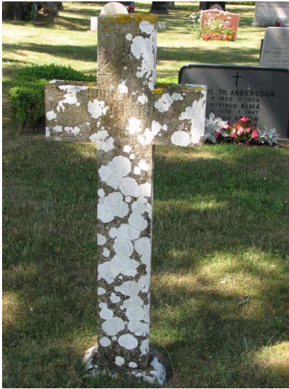
Korsformad vård i kalksten rest 1864 (KI Smedby kyrkog 060)