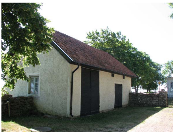
Redskapsbod och toalett i en byggnad i nordöstra hörnet utanför kyrkogården (KI Smedby kyrkog 026)