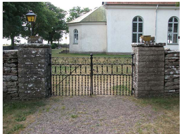
Huvudingången i det nordöstra hörnet. Smidesgrindar mellan murade stolpar av kalksten (KI Smedby kyrkog 114)