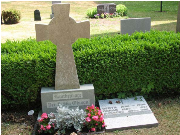
En kalkstensvård i form av ett ringkors med sockel av grå granit (KI Smedby kyrkog 103)