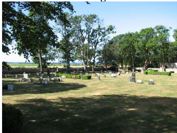
Översikt över kyrkogården söder om kyrkan från nordost (KI Smedby kyrkog 004)