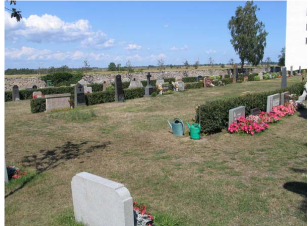
Kvarter B från sydost. (KI Stenåsa kyrkog 018)