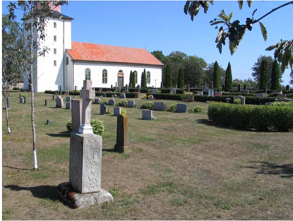
Kvarter A från sydväst. Till höger i bilden skymtar minneslundan omgärdad av en tujahäck. (KI Stenåsa kyrkog 012)