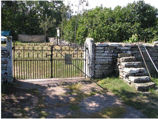
Kyrkogårdens ingång i söder. (KI Stenåsa kyrkog 007)

Kyrkogården har en ingång i norr och en i söder. Båda har dubbla smidesgrindar mellan stolpar av kalksten. Till vänster om grinden i söder och till höger om grinden i norr finns klivstättor av kalkstensflisor.