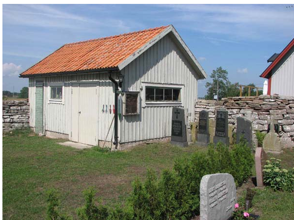
Redskapsboden och uppställningsplats för gravvårdar i nordväst. (KI Stenåsa kyrkog 004)

finns också vårdar av kalksten. Att ange den dödes yrkestitel är relativt vanligt. Det är också vanligt att man anger från vilken by eller gård den döde kommer.