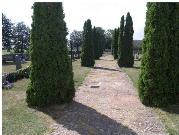
En gång belagd med kalkstensflis och kantad av tujor går söderut från kyrkans södra ingång. (KI Stenåsa kyrkog 010)