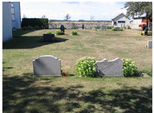
Kvarter D från öster. (KI Stenåsa kyrkog 038)