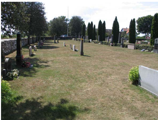
Kvarter C från norr. (KI Stenåsa kyrkog 029)