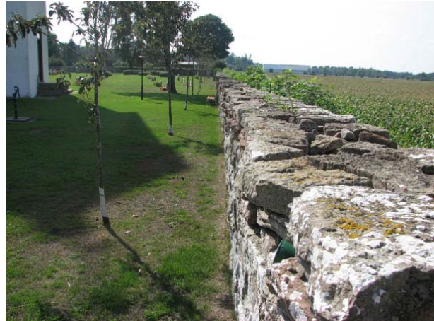
Kyrkogårdens mur och nyplanterade oxlar i väster. (KI Stenåsa kyrkog 005)