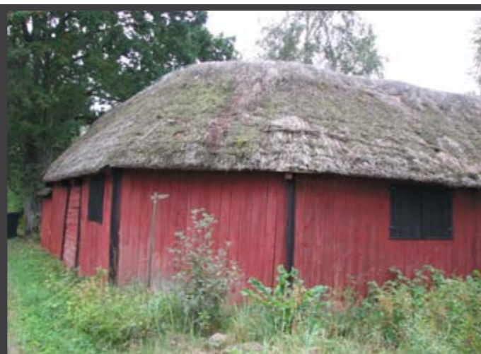
Ett för norra Öland karaktäristiskt krokhus med rundat, "dösad", hushörna. Moning med nät. Vedborm, Högby socken.