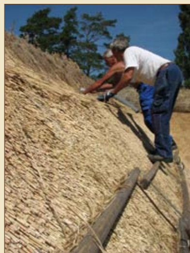
Vasstak under pågående läggning. Föra, norra Öland.

• Om det finns eller funnits takkråkor bör de antingen få behålla sin individuella form, eller göras efter lokal förebild.