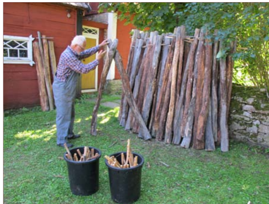
Hinkar med handtäljda enepinnar som ska hålla ihop hängen samt hång innan de sätts upp på taket.

Hembygdsgårdarna ska kunna fungera som referensobjekt i sin trakt, så att man ska kunna se hur gamla byggtekniker, såsom t ex stråtak, utfördes förr i tiden. Eftersom det idag är få yrkesmän som lägger alla vasstak uppstår en likriktning där unika lokala särarter försvinner. Det är därför viktigt att gamla stråtak som finns på hembygdsgårdar idag dokumenteras noga, och om man hittar lokala särarter i bygden kanske något av detta kan återinföras också på hembygdsgården, eller i alla fall visas upp i informationsmaterial.