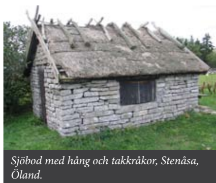
Sjöbod med hång och takkräkor, Stenåsa, Öland.

Stråttak används som en gemensam benämning för vassstak och halmtak. Halmtaken har en lång tradition på landsbygden i Kalmar län. Också vassstak har lagts länge i länet vid vassrika kuster och insjöar. Till skillnad från t ex Skåne, där man också använder vass på sina bostadshus, så är det i vårt län bara på ekonomibyggnader som stråttak har lagts som yttertak. På Öland finns dock exempel på att halm lagts under torvtaket på bostadshuset. Ladugårdar, sjöbodar och ängslador är