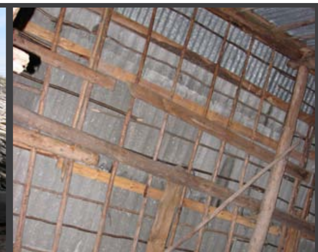
Under ett plåttak kan man hitta resterna av ett bevarat raveltak. Övetorp, Algotrum.