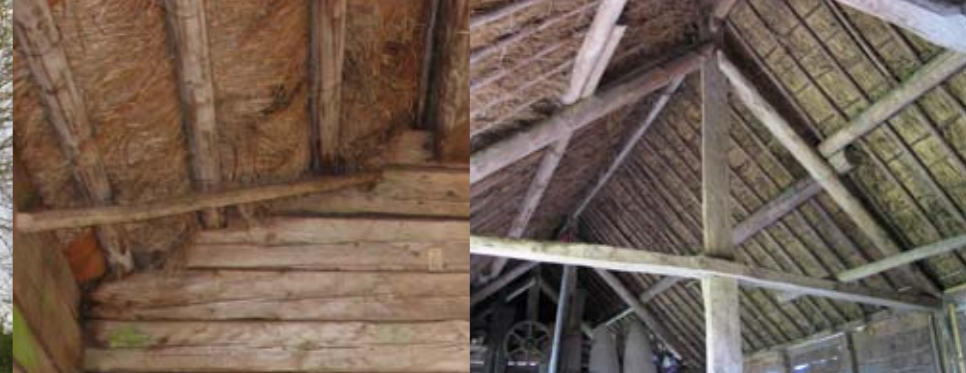
Ängslada med halmtak, bundet i åsar som vilar mellan gavelröstets stockar. Stångsmåla, Vissefjärda, Småland.