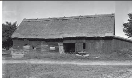
Stenlada med nylagt vassstak med hång. Övra Segerstad, södra Öland.

Stråttaken är viktiga som genuin faktabank för gamla byggtkniker och har ofta mycket höga kulturhistoriska värden. Stråttaken påverkar också upplevelsen av en kulturmiljö positivt. Det är viktigt både för oss som lever i den och för våra besökare. Säker bidrar stråttaken till att locka turister till Öland. Låt oss hjälpas åt att bevara mångfalden av stråttak i länet!