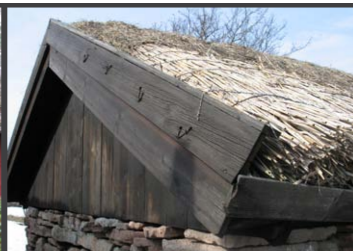
Exempel på sjöbod med hål i vindskivan för fäste av binderaften. Sjöbod i Horn, Högby socken, norra Öland.