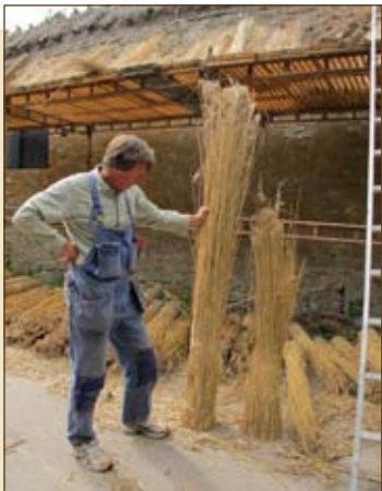
Olika längder på vassen sorteras och används på olika delar av taket.