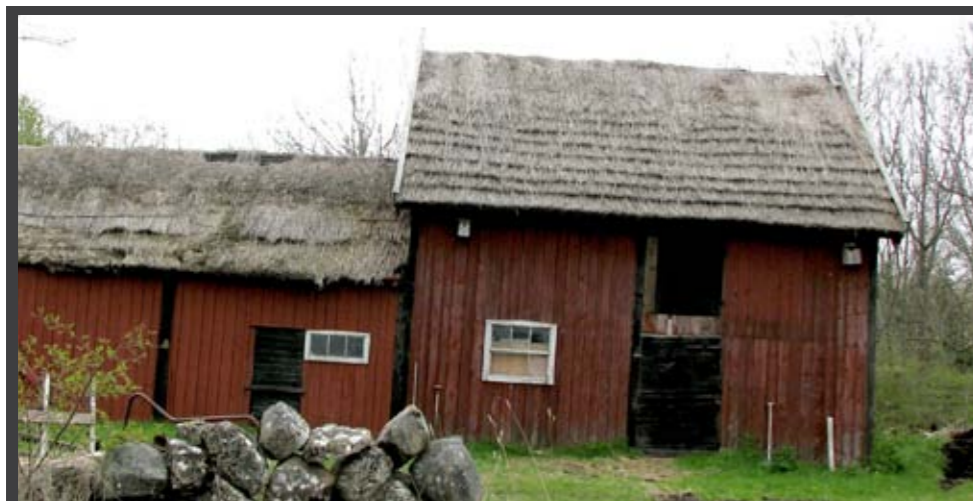
Vassstak lagt i etapper med raka kanter, en utrotningshotad metod. Horns kungsgård, norra Öland.

Högsulekonstruktionen är intimt förknippad med stråttak och skiftesverk. Högsulan är en bärande stolpe som går från golvet upp till taknocken. Den öländska högsulan är unikt utformad. Här finns idag bara drygt 20 stycken kvar. Högsulor finns också i andra delar av Sverige och världen, t ex på Gotland och i Halland, men inte utförda på samma sätt som på Öland. Har du en komplett eller delar av en högsulekonstruktion i din lada så är den ett sista minne från en mycket älderdomlig byggnadsteknik, kanske med anor ända från järnåldern.