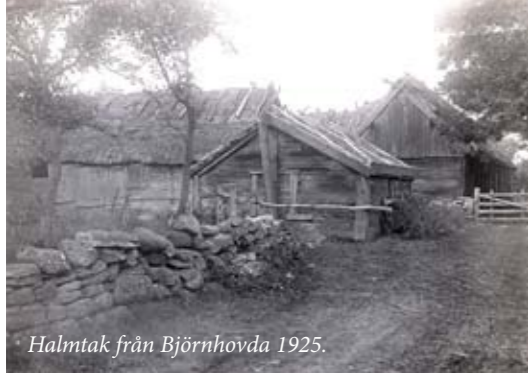
Halmtak från Björnhovda 1925.

▼ Också på fastlandet var halmtak under en period det vanligaste tak-täckningsmaterialet på ladugårdar. Ebbetorp utanför Kalmar 1925.