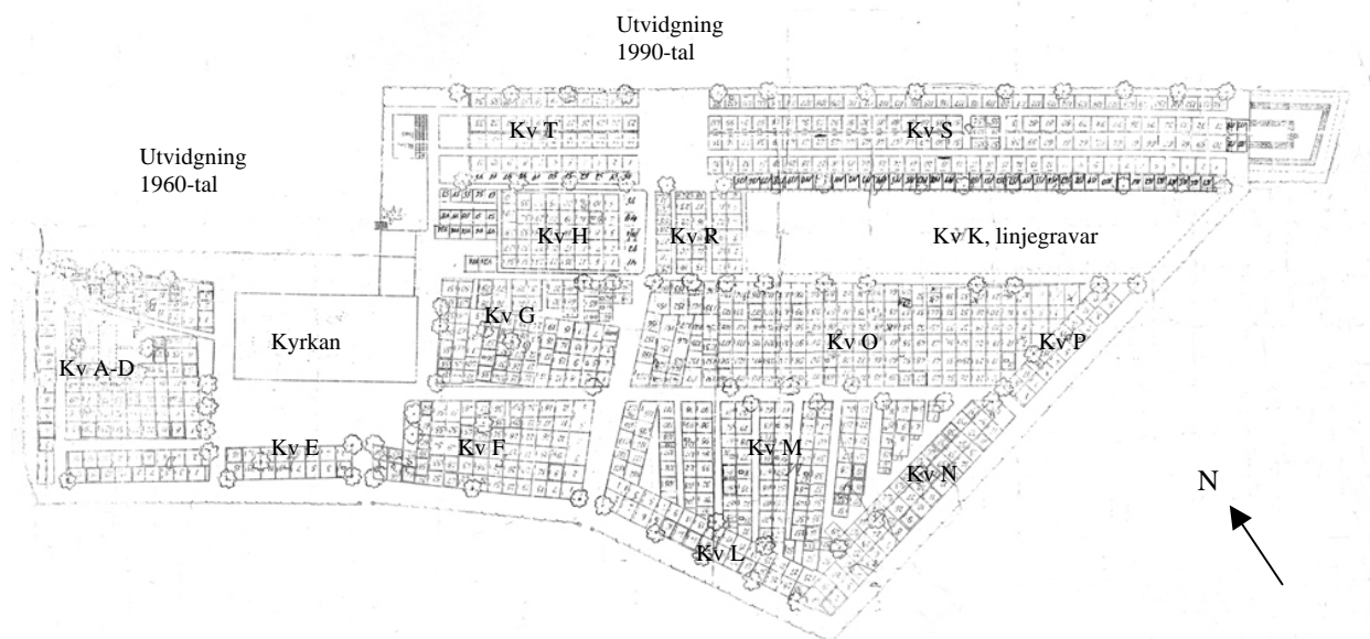
Torsås kyrkogård. Utvidgningarna från 1960-talet och 1990-talet är inte inritade på kartan men deras positioner är markerade.

På 1960-talet fanns åter behov av nya ytor för begravnin g och ett stort område norr om kyrkan ansågs lämpligt. År 1965 var planerna klara och ca 450 gravplatser tillkom efter ritningar av Gösta Engstedt, Kalmar. Området togs i bruk först 1967 och anlades med gravplatser mot rygghäckar. Urngravar anlades i den nya ytans östra del. I områdets mitt var planerat för en damm som aldrig utfördes. Utvidgningen kallades Nya kyrkogården som idag går under förkortningen NK.