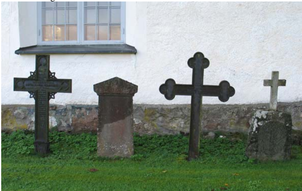
Några av vårdarna i museiuppställningen. Två gjutjärnskors syns på bilden samt en vård av kalksten och en av granit och vit marmor. Samtliga bör införas på församlingens inventarieförteckning. (KI Torsås kyrkog 040)

Norr om kyrkans norra fasad står ett 20-tal gamla vårdar i vad man kan kalla en museiuppställning. Fem av dem är gjutjärnskors, tre är av kalksten och resten av granit. Bland vårdarna finns flera som är ovanliga och gamla, varav flera från tiden kring 1800-talets mitt. Den äldsta är ett gjutjärnskors över Magnus Dahleri död 1843. En av vårdarna är av granit kombinerat med ett kors i vit marmor. Merparten av dessa vårdar bör införas på församlingens inventarieförteckning.