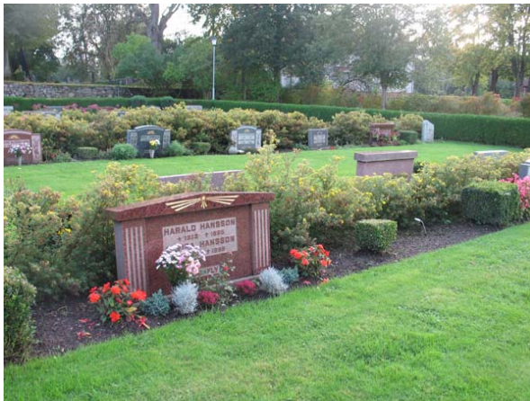
Kvarter NK, norr om kyrkan. Olika typer av vårdar förekommer, men flera bär ännu klassicismens formspråk. (KI Torsås kyrkog 166)