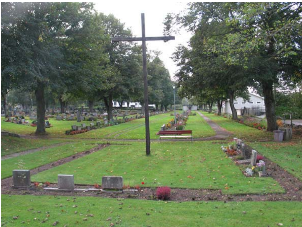
Urnlunden, kvarter U. (KI Torsås kyrkog 157)