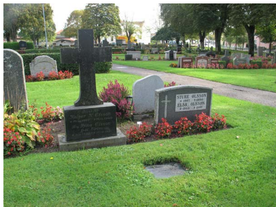
Gravplatsen i kvarter G över familjen Olsson, ägare till Olssonska gården i Torsås. (KI Torsås kyrkog 086)

I kvarter G finns gravplatsen över familjen Olsson, ägare till Olssonska gården, som är ett av Torsås kommuns två byggnadsminnen. Hantverksmässigt utförd är vården av smide och glas, från 1970-talet, över makarna Strömgren i kvarter M.