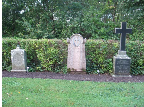
Ytterligare tre vårdar i kvarter C. Gravstenen längst till vänster saknar sitt kors av vit marmor. Den mittersta vårdan är av röd kalksten och rest över kyrkoherden Ahlqvist samt maka, döda 1854 respektive 1843. (KI Torsås kyrkog 060)