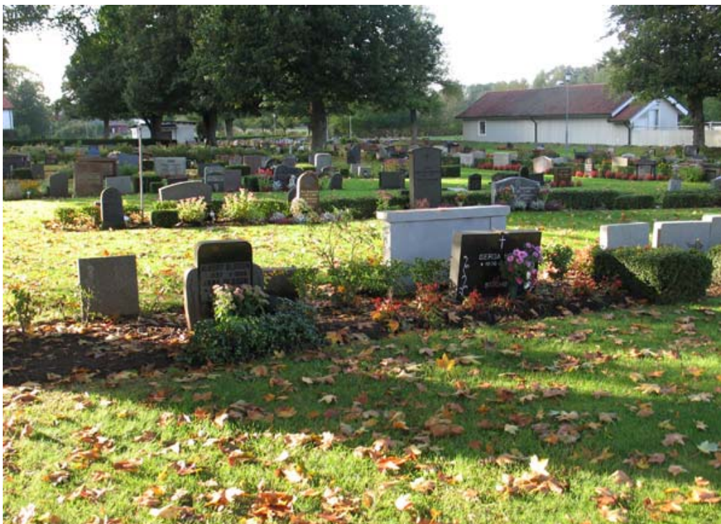
Kvarter K mot nordväst. Notera den lägre profilen på gravvårdarna. (KI Torsås kyrkog 136)

Kvarter K utgörs av en långsmal yta i kyrkogårdens östra del. Områdets profil är lägre än för tidigare beskrivna kvarter eftersom vårdarna är lägre. Vårdarna står tätt och är ryggställda. I vissa partier är de placerade mot rygghäckar av häckoxbär. Kvarteret tillkom troligen på 1910-talet och användes som linjegravsområde. Detta framgår än idag av typen av vårdar och inskriptionerna. I raderna kan linjegravssystemet följas under 1910-talet och in på 1920-talet. En linje löper går 1930-talet och en bit in på 1940-talet.