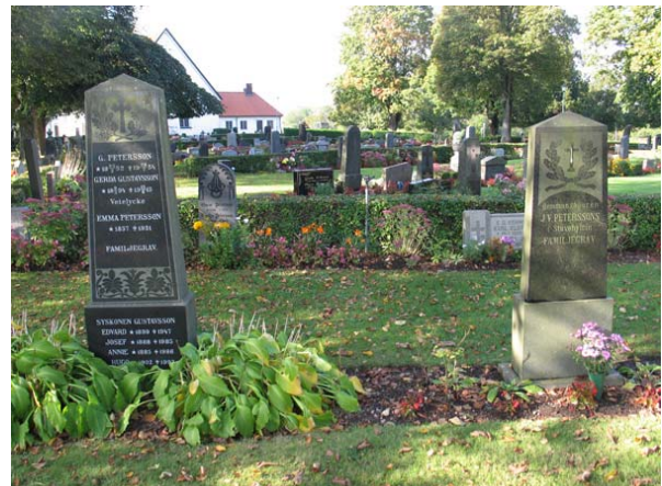
Del av kvarter N med utblick över M. Två av vårdarna från tiden kring sekelskiftet 1900- Den vänstra har använts kontinuerligt av samma familj sedan 1915 och rymmer persondata för ett stort antal personer. (KI Torsås kyrkog 109)

Vid vissa gravplatser finns delar av stenramar bevarade, vilket visar att platsen tidigare varit omgärdad och grusbelagd. Vid en del gravplatser finns liggande vårdar som antingen tillkommit senare än ”huvudstenen”, eller är tidigare stående stenar som vid något tillfälle lagts ned. Flera av de höga vårdarna av svart eller grå granit från sekelskiftet har under sen tid återanvänts. I något fall har man behållit den gamla inskriptionen och låtit göra en ny på den forna baksidan.