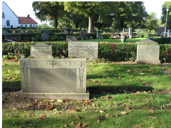
Kvarter N med några vårdar från 1900-talets mitt. (KI Torsås kyrkog 111)