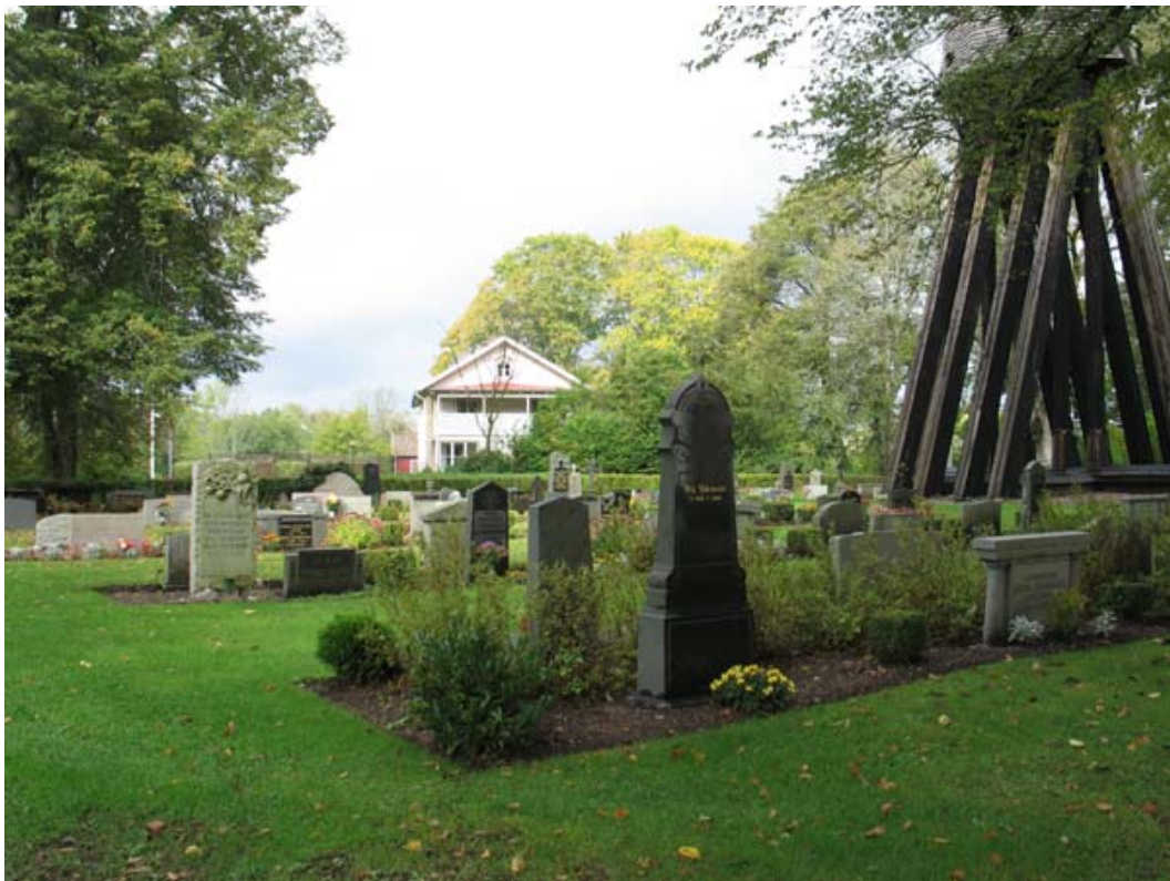
Kvarter D och A. Prästgården syns i bakgrunden, klockstapeln till höger i bild. (KI Torås kyrkog 046)

Kvarteren A-D ligger väster om kyrkan och kvarter E söder om. Området utgör den äldsta delen av dagens kyrkogård. Mitt i området väster om kyrkan står klockstapeln. Stora, höga träd som ingår i trädkransen inramar ytan, tillsammans med kyrkogårdsmur. Gravvårdarna står i rader i gemensamhetsplanteringar, ibland med rygghäck av oxbär, ölandstok, rosor eller måbär. Intrycket av gravvårdarna är blandat med vårdar från hela 1900-talet. Enstaka äldre vårdar finns också, speciellt i kvarter C.