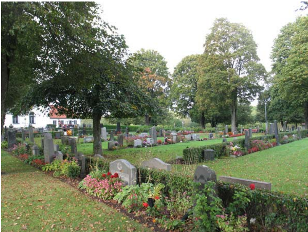
Del av kvarter L och M. Foto taget mot nordväst. (KI Torsås kyrkog 102)