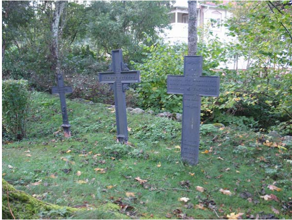
De tre gjutjärnskorsen i kvarter C. (KI Torås kyrkog 058)