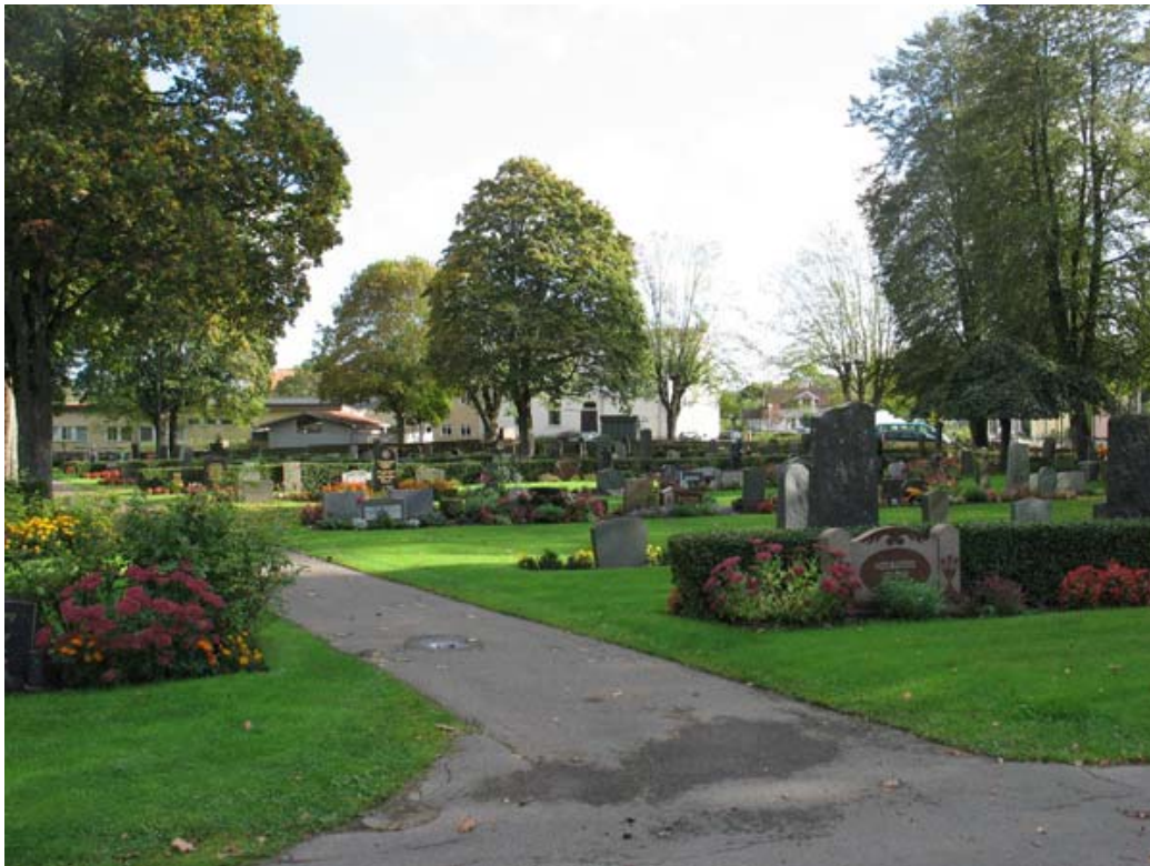
Översiktsbild över kyrkogårdens östra del. Gången går mellan kvarteren M och O. (KI Torsås kyrkog 098)

Längdriktningen förstärks av de långa gångarna och de gamla träden som markerar gångarnas placering samt fungerar som omgivande trädkrans. Kvarteren har olika former. Kvarter L, N och P ligger i kyrkogårdens utkant medan H, M, O, och R ligger i kyrkogårdens mittparti. Kvarteren F och G ligger närmast kyrkan i väster. Kvarter G är lite högre beläget i terrängen än övriga kvarter. Samtliga kvarter består av rader av främst familjegravvårdar. Vårdarna är mestadels placerade ryggställda. Rygghäckar, som förekommer i vissa partier, består av tuja, häckoxbär, rosor eller ölandstok. I vissa områden finns små korta häckar av buxbom mellan gravplatserna. Gravvårdarna uppvisar en stor variationsrikedom.