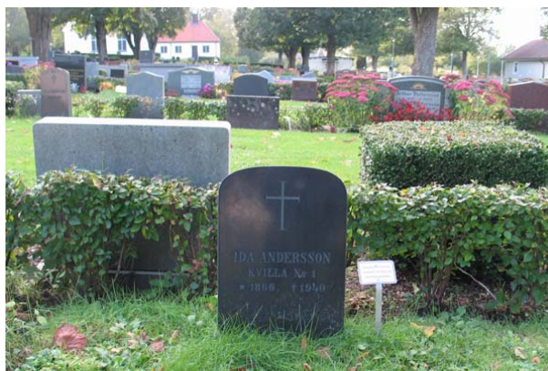
Linjegravvård från 1941 över Ida Andersson, Kvilla nr 1. Gravstenens storlek och utformning är typisk för linjegravar. (KI Torsås kyrkog 139)