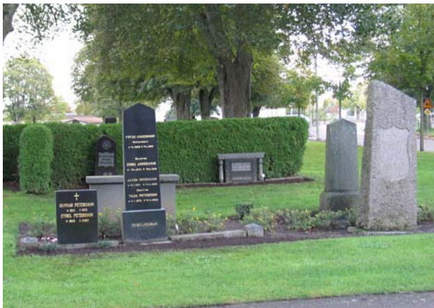
Kvarter F från väster. Olika typer av vårdar. De höga är från tiden kring sekelskiftet 1900. Den bevarade stenramen visar att gravplatsen tidigare varit grusad. (KI Torsås kyrkog 066)