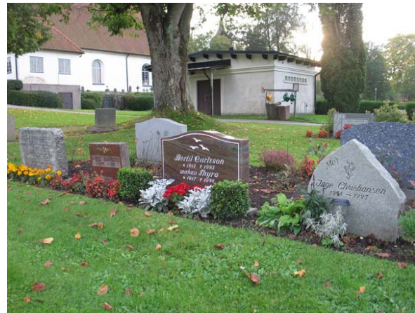
Kvarter NK, nordost om kyrkan. Här är vårdarna mer varierade till sin utformning. (KI Torsås kyrkog 170)