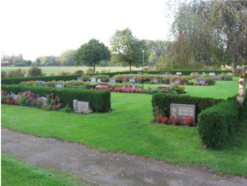
Kvarter NK norr om kyrkan med jämnstora vårdar mot rygghäckar. Tujahäckarna delar in, och skärmar av området. (KI Torås kyrkog 163)