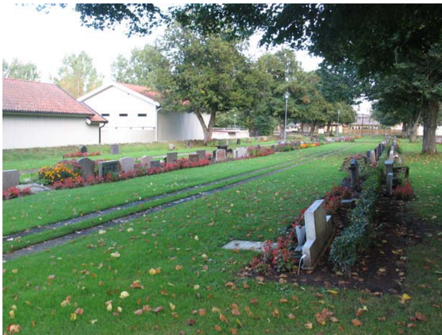
Kvarter S med rader av låga vårdar i gräsmattan. Trädraden till höger i bild markerar den gamla kyrkogårdsgränsen. (KI Torsås kyrkog 148)

köpman, fabrikör, lantbrukare, polisman, ”f d smålandshusaren och muraremästaren”, glasmästare, statens justerare och lokförare. By- eller gårdsnamn finns angivet på många av vårdarna.