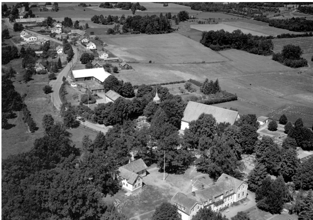
Flygfoto taget 1950. Om man tittar noga framgår att stora delar av kyrkogården var anlagd med grusade gravplatser omgärdade av stenramar eller låga häckar.

År 1949 genomfördes en enkätundersökning av Växjö stift i samtliga församlingar. Frågorna gällde kyrkogårdens historia och nuvarande utseende. I enkätsvaret för Torsås kyrkogård framgår att kyrkogården var planterad med häckar av liguster, buxbom och tuja och att det fanns rikligt av träd såsom alm, ask, lind och lönn. På frågan om gravtyper angavs att gravplatserna i de flesta fall var köpta men att det emellanåt förekom begravning i allmänna linjen. Vidare att kyrkogården förr varit indelad i gravplatser för de olika byarna ”...vilket inverkat menligt på kyrkogårdens planläggning”. Gravkullar fanns vid den här tiden både ovala och runda, men familjegravarnas platser var ofta utslätade och gravplanen belagd med grus eller singel. Vissa regler hade införts; höjden på vårdarna fick inte vara mer än 80 cm och stenramar var förbjudna på nya kyrkogården (oklart vilka kvarter som menas). När det gäller vårdarna var det vanligast med grå eller svart granit och att gårdsnamn, persondata och bibelcitat fanns angivet. Hällar förekom vid denna tid nästan inte alls, och gravstenarna var vanligen av svart eller grå granit. På frågan om gravstenar som vårdas av församlingen och andra märkvärdiga vårdar svarade uppgiftslämnaren att det fanns flera vårdar över kyrkoherdar som vårdades av församlingen. Den äldsta vården på kyrkogården var då liksom nu gjutjärnskorset över Professorn och Theol Doctorn Magister Magnus Dahleri död 1843. Vården står numera i museiuppställningen norr om kyrkan.