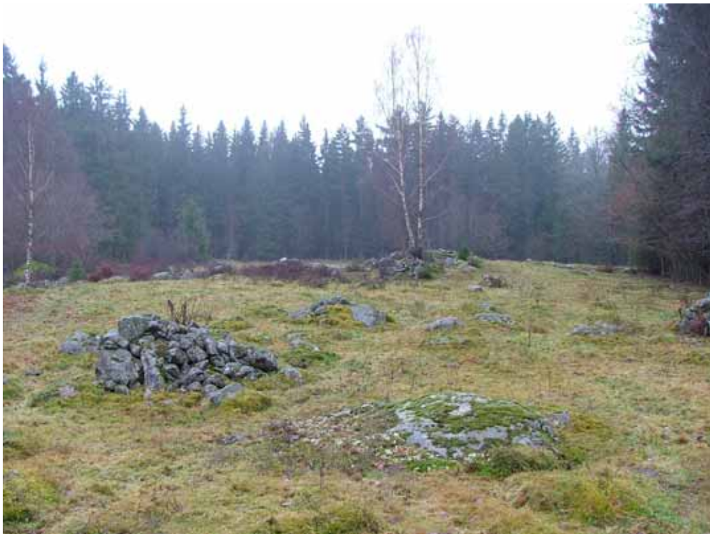
Fig. 2. Fossil åkermark (nr 9) med röjningsrösen, terrasskanter och låg grad av stenröjning. Den betade kulturmiljön åskådliggör på ett tydligt och pedagogiskt sätt hur jordbruk bedrevs förr.

F.ö. finns en halvt förruttnad hankgärdesgård (bunden med ståltråd) i gränsen mellan Riddaretorps och Hagnebos utmarker, samt flera diken norr om den fossila åkermarken (nr 9) i områdets södra del.