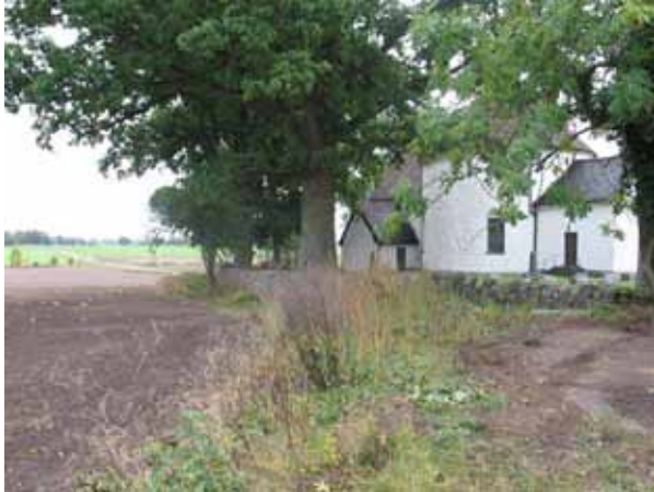
Vallmuren och träden på norra sidan. (KI Voxtorp kyrkog 013)

norra. På den del av muren som löper vid klockstapeln finns dock ingen vall och muren är av en annan karaktär och murad i en annan tid än den övriga. Troligen skedde detta i och med att kyrkmurens sträckning ändrades i samband med uppförandet av ekonomibyggnaden 1960. Runt om kyrkogården är det ask, ek, lönn och poppel planterade.