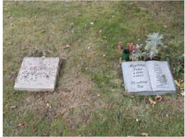
Liggande gravvårdar (KI Voxtorp kyrkog 044)