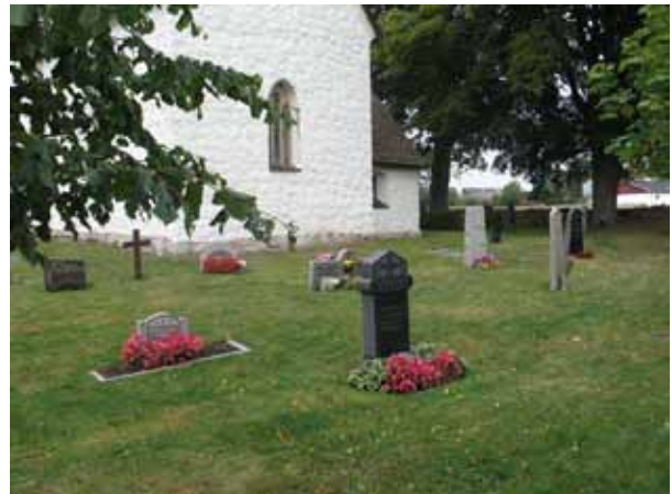
Södra delen, öster om kyrkan från sydväst (KI Voxtorp kyrkog 021)