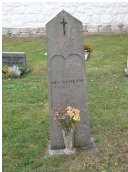
Kalkstensvård rest 1875 över Nils Wistrand (KI Voxtorp kyrkog 037)