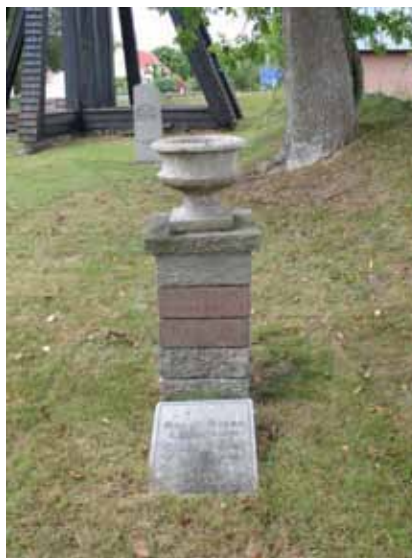
Kalkstenspelare med urna från 1936 (KI Voxtorp kyrkog 046)