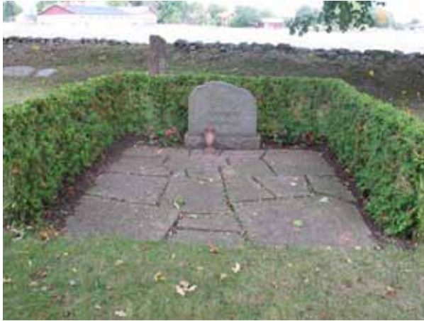
Den enda gravplatsen som omgärdas av en häck på kyrkogården (KI Voxtorp kyrkog 041)