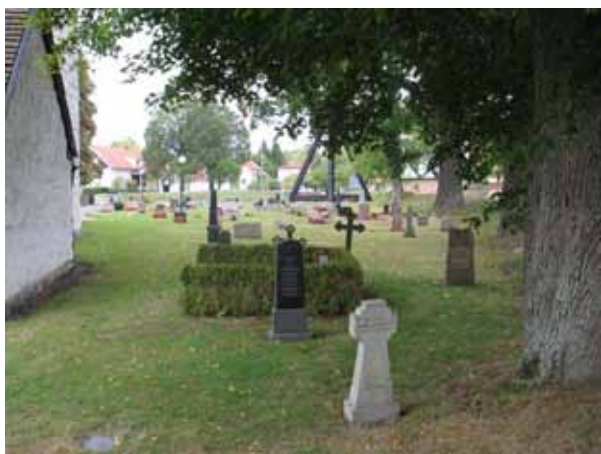
Översikt norra delen från öster (KI Voxtorp kyrkog 039)

Den södra delen av kyrkogården rymmer flertalet av de äldsta gravarna. Området karaktäriseras av en stor blandning och gravvårdar från alla 1900-talets årtionden men domineras av höga resta i framförallt svart granit. De vårdar som är från mitten av 1800-talet och äldre samt gjutjärnsvårderna skall föras in på inventarieförteckningen. Grusgravar var tidigare vanliga på Voxtorps kyrkogård och de få som finns kvar bör bevaras. Liksom även detaljer, så som stenramar, som påminner om grusgravarnas tid.