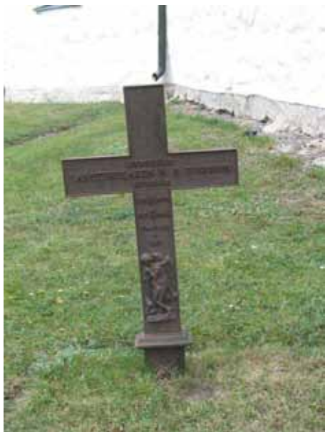
Gjutjärnsvård, kyrkogårdens äldsta gravvård från 1829 (KI Voxtorp kyrkog 034)