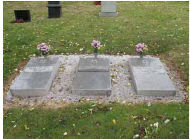
Liggande gravvårdar på södra delen (KI Voxtorp kyrkog 029)