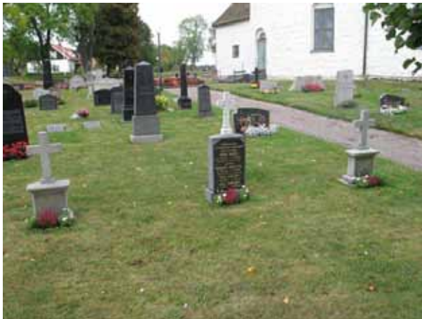
Gravvårdar med kors i marmor, södra delen (KI Voxtorp kyrkog 032)

Södra delen omfattar området söder och öster om kyrkan. Området delas i två delar av grusgången som löper i öst – västlig riktning genom kyrkogården. Åt söder avgränsas området av kyrkogårdsmuren och i norr av grusgången och kyrkan. Den södra delen av kyrkogården rymmer 351 gravplatser. Generellt är det de höga resta vårdarna som ger området dess karaktär. Kronologiskt finns här en jämn spridning under alla 1900-talets årtionden. Alla gravvårdarna står i rader vända mot öster. Förutom ett fåtal bevarade grusgravar är hela området insått med gräs.