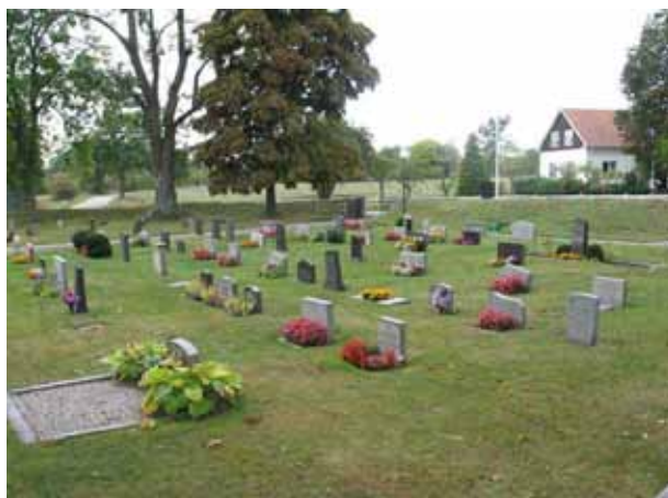
Översikt norra delen från norr (KI Voxtorp kyrkog 047)