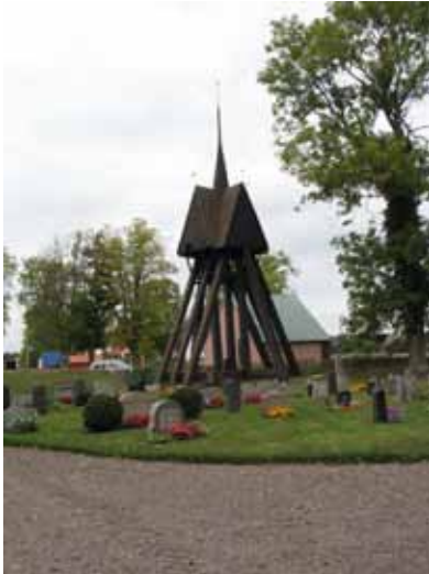
Klockstapeln av okänd ålder (KI Voxtorp kyrkog 052)

Utanför muren i det nordvästra hörnet intill klockstapeln finns pannhuset. Det uppfördes under åren 1959-60 i lättbetong, med putsad fasad och koppartak. Huset innehåller också förråd. På andra sidan gatan i sydväst är församlingshemmet.