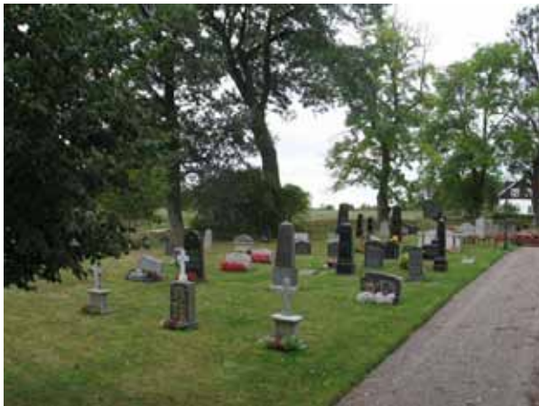
Södra delen från nordöst (KI Voxtorp kyrkog 019)