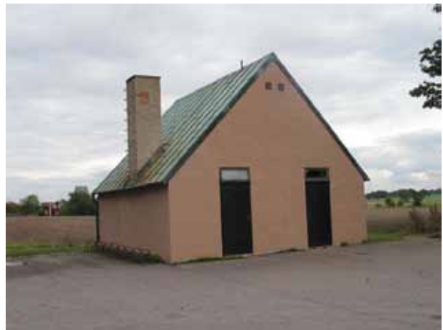
Ekonomibyggnad byggd 1960 utanför kyrkogårdens nordvästra hörn (KI Voxtorp kyrkog 053)