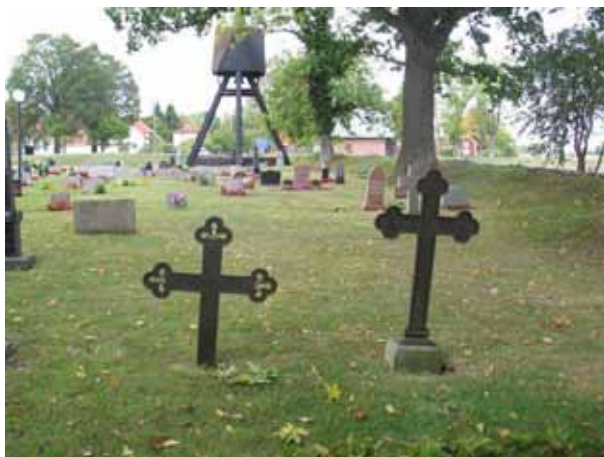
Gjutjärnsvårdar på norra delen. Det vänstra rest över S Johansson 1881 det högra saknar text (KI Voxtorp kyrkog 042)

Norra delen utgörs av de gravvårdar som finns på den norra sidan om kyrkan. I söder avgränsas området av grusgången och kyrkan och åt norr avgränsas området av kyrkogårdsmuren. Alla gravvårdarna, utom en, står i rader vända mot öster. Området rymmer 300 gravplatser. Generellt är de låga rektangulära vårdarna som ger områdets dess karaktär. I det nordvästra hörnet är klockstapelns placerad. Endast en grusgrav är bevarad och resten av området är insått med gräs.