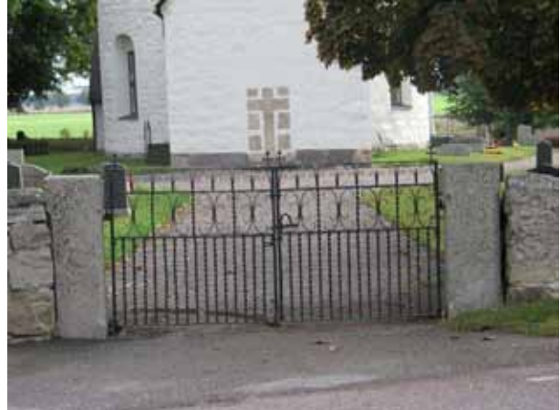
Ingång från norr. Det står år 1896 på grindarna (KI Voxtorp kyrkog 001)