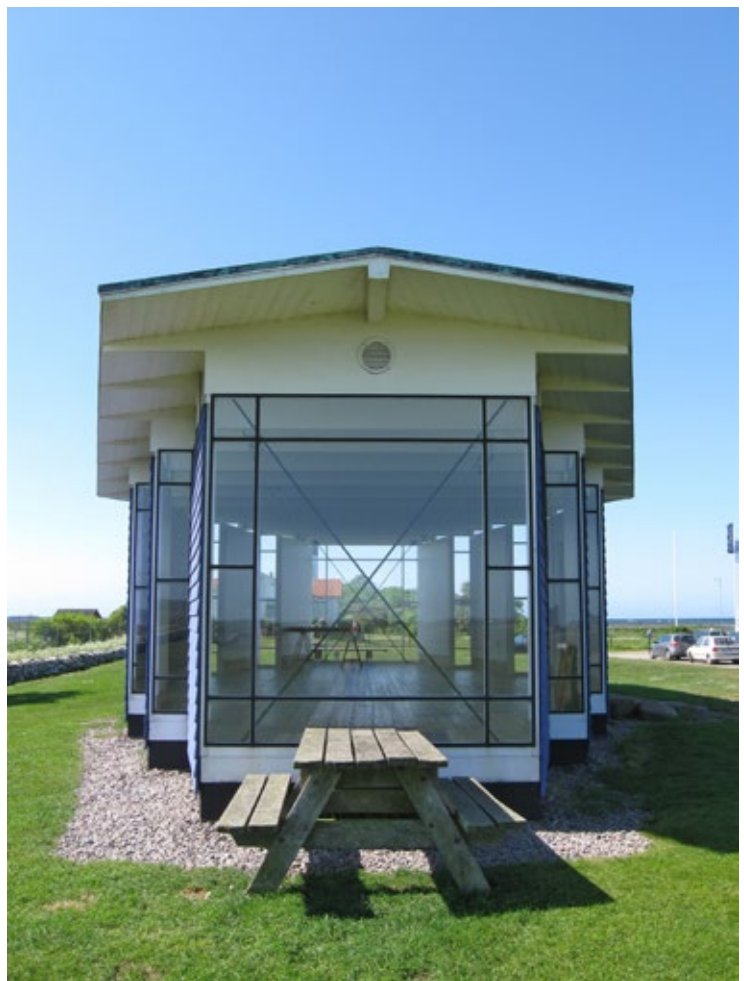
Fågelmuseets norra gavel.