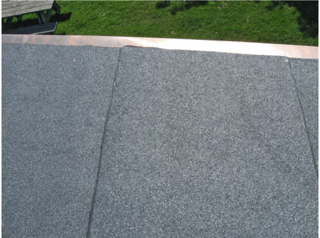
Ny takfotsplåt och papp.