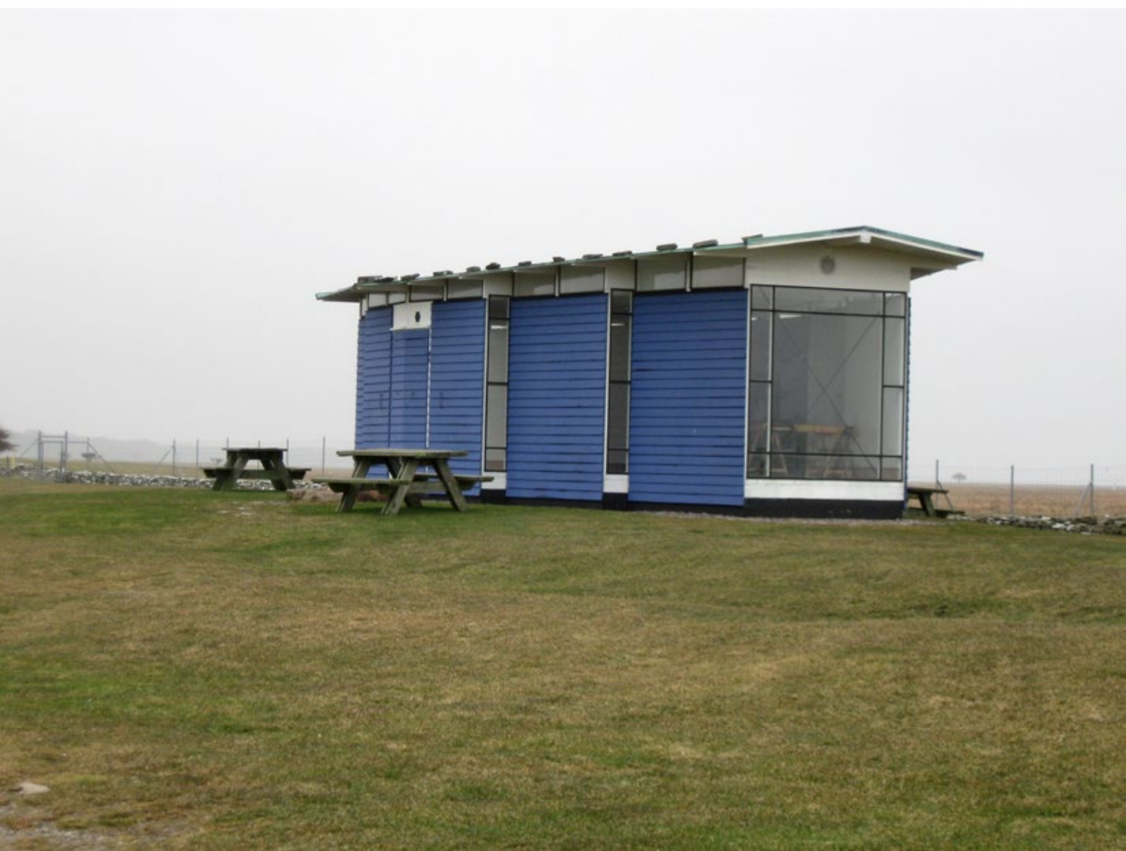
Fågelmuseet före åtgärd.