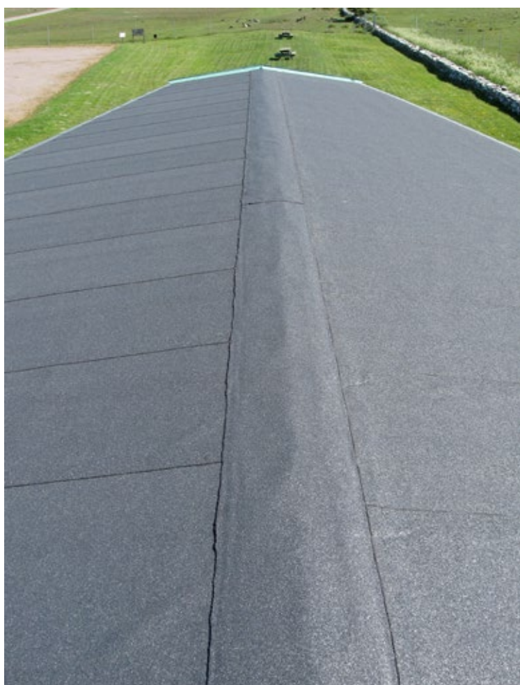
Taket efter åtgärd.