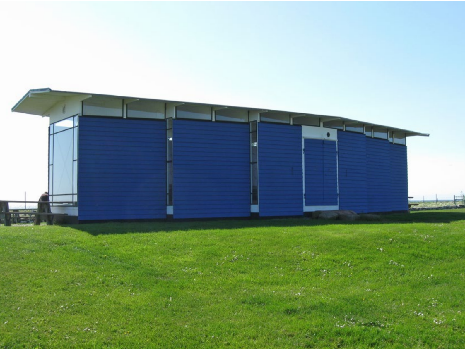
Fågelmuseet efter åtgärd.