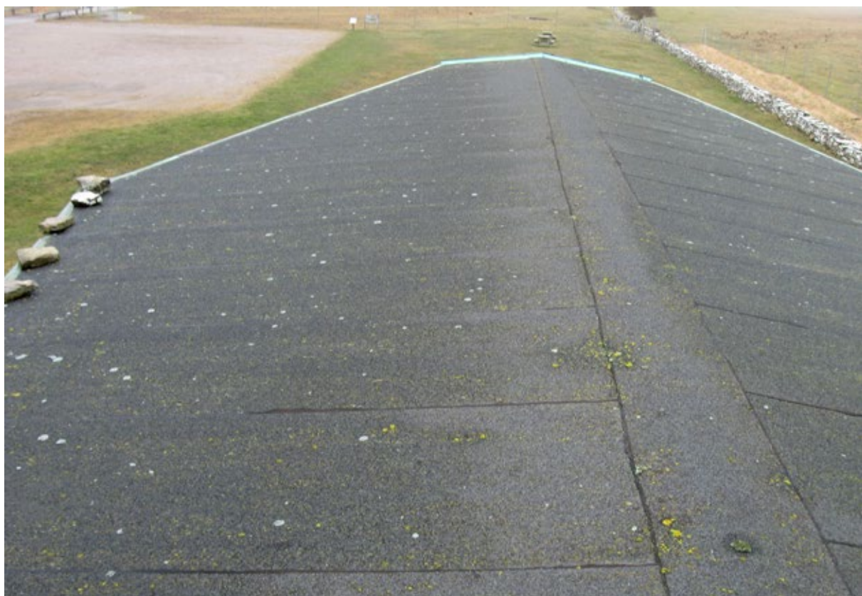
Taket före åtgärd.