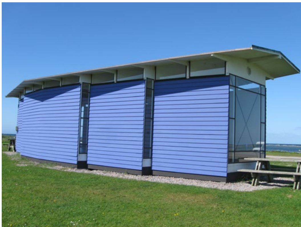
Takfoten efter åtgärd.