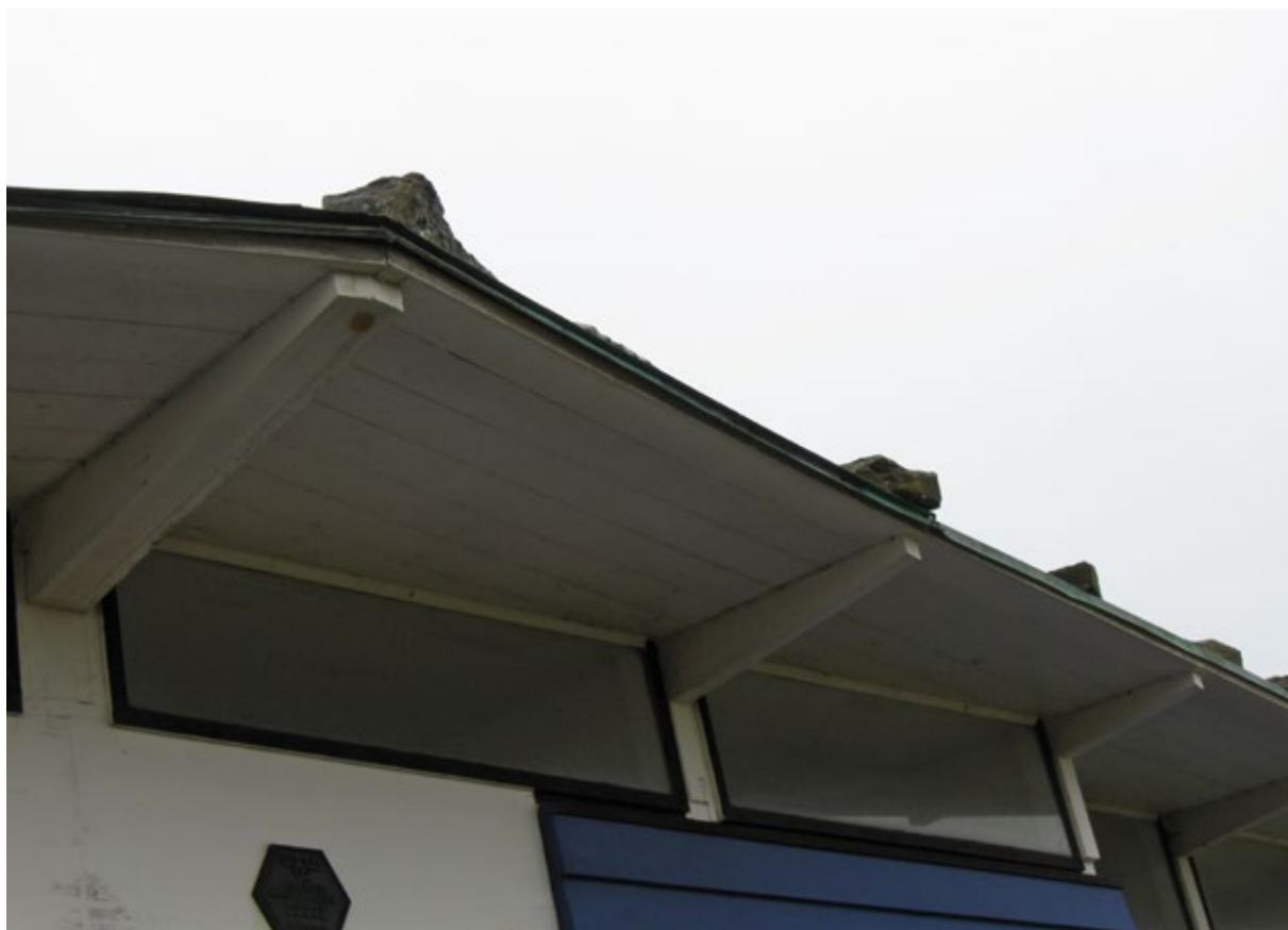
Takfoten före åtgärd.