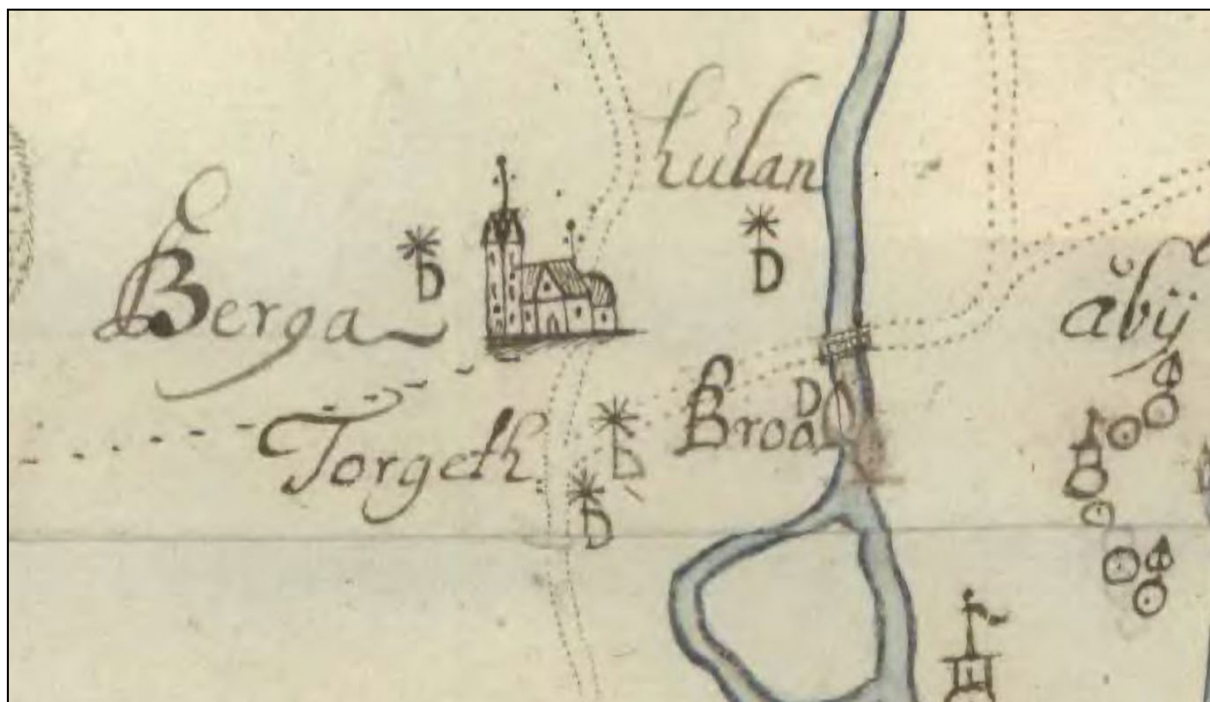
Figur 1. Kyrkans utformning på häradskartan över Sunnerbo från slutet av 1600-talet.

Biskopen i Linköping hade en tydlig koppling till Berga under 1200-talet och han ägde flera gårdar i området. Biskopen fick år 1279 även tillåtelse av Kung Magnus Ladulås att anlägga en köpstad vid Berga, vilket om så skett hade gjort Berga till den sjunde medeltida staden i Småland. Planen på en stad i Berga förvekligades dock aldrig och försvann helt då biskopen dog år 1282 (Larsson 2009:73; Larsson 1975:107). Att Berga är en plats med tidig strategisk betydelse genom dess läge vid ån och Laganstigen är tydlig. En väg, med anor från åtminstone yngre järnålder, löpte även via Rydaholm, Moheda och förband den centrala