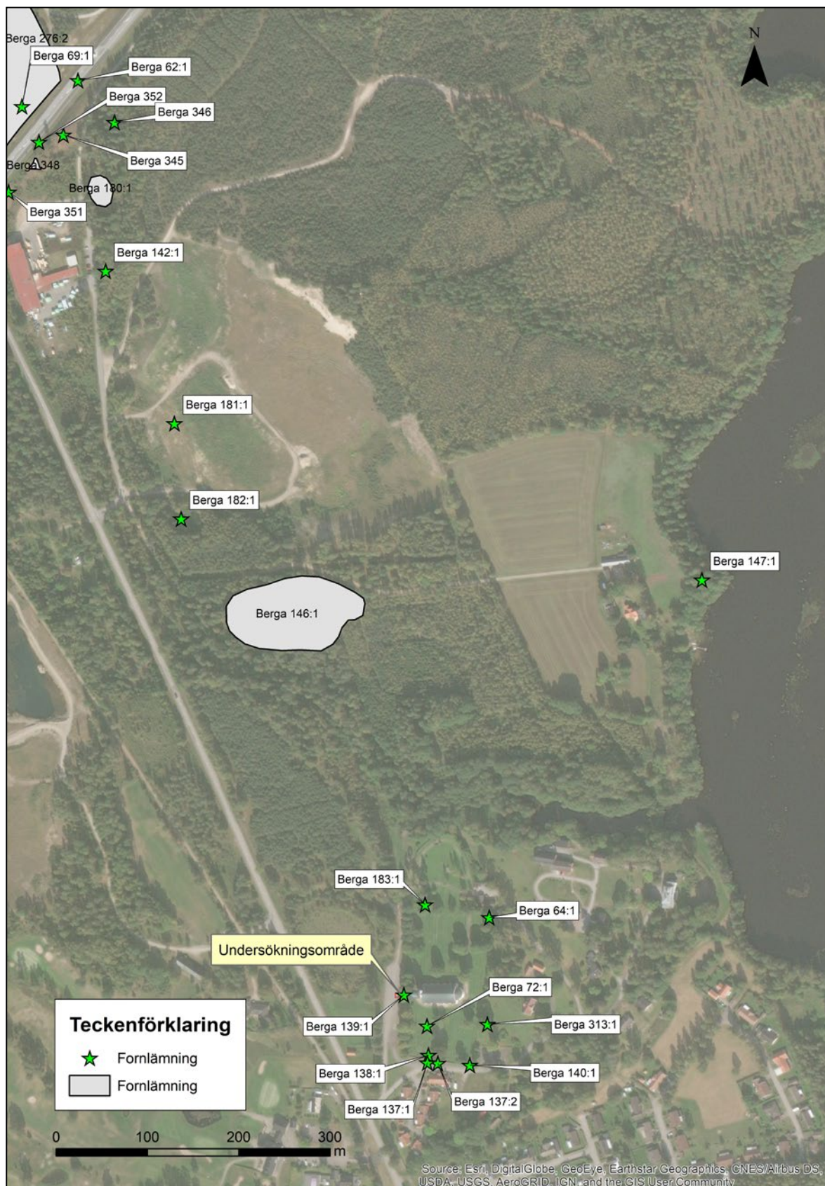
Figur 2. Registrerade fornlämningar i närområdet.