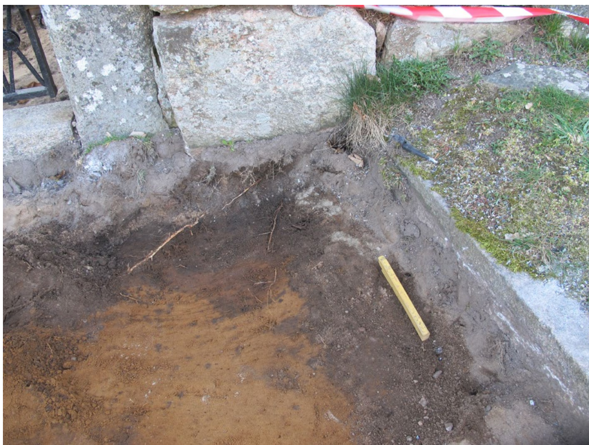
Figur 3. Rännformad nedgrävning in mot kantstenarna på trappkonstruktionen. Nedgrävningen gick dock djupare ner än vad de befintliga kantstenarna låg, vilket kan tyda på att den kan kopplas till en äldre trappkonstruktion. Foto mot SÖ.

Den västra änden av trappan närmast parkeringen var helt uppbyggd av påfört grus, sten och betong. Den plana etagen som följde därefter hade en orangeaktig sand med spridda fläckar av humöst material under sättsanden. Sannolikt rör detta sig om delar av en naturlig markhorisont. In mot kantstenarna fanns en upp till ca 0,30 m bred remsa med humös sand med bitvis inslag av