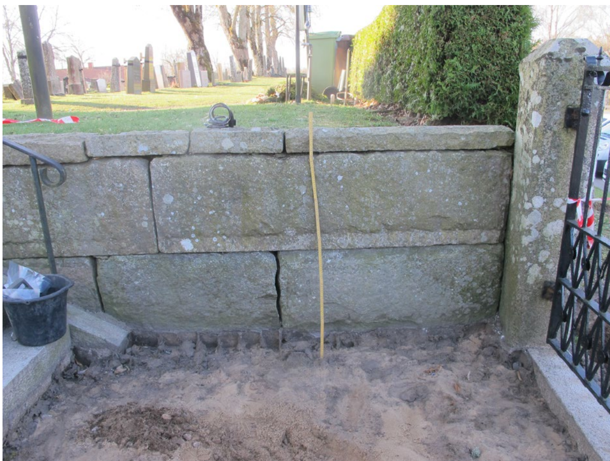
Figur 4. Nivåskillnaden på ytan där rännan framkom och dagens kyrkogård. Foto mot S.

Skaftet till kritpipan var 40 mm långt och vägde ca 9 gram.