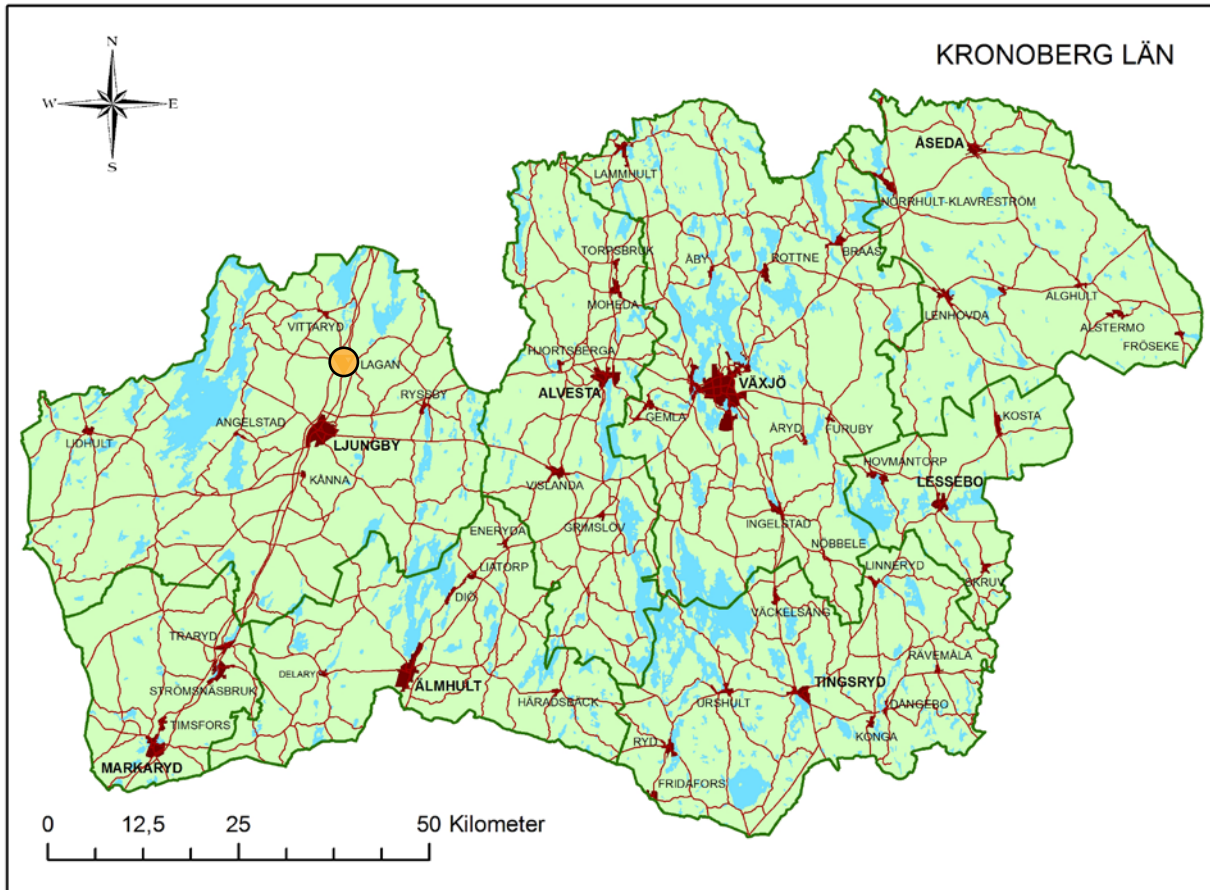
Karta över Kronobergs län med platsen markerad.