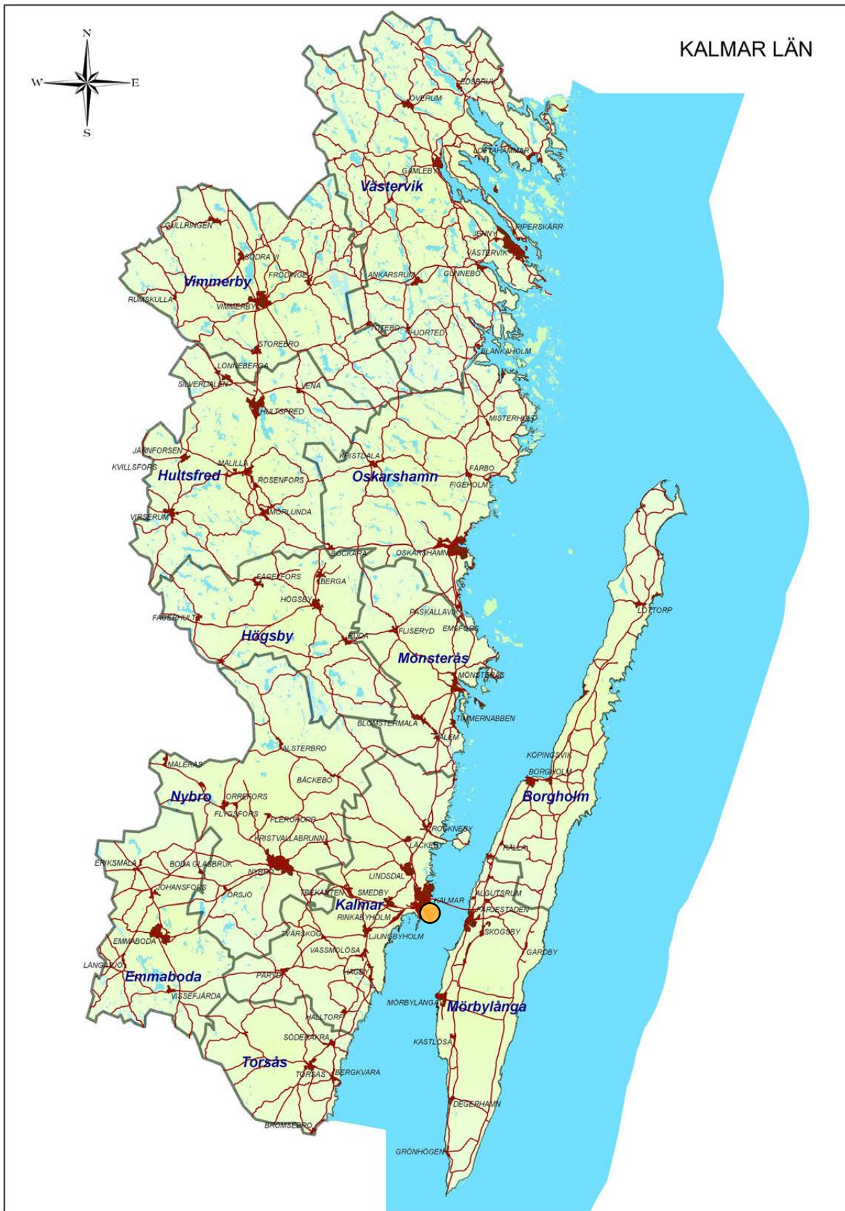
Karta över Kalmar län med platsen markerad.