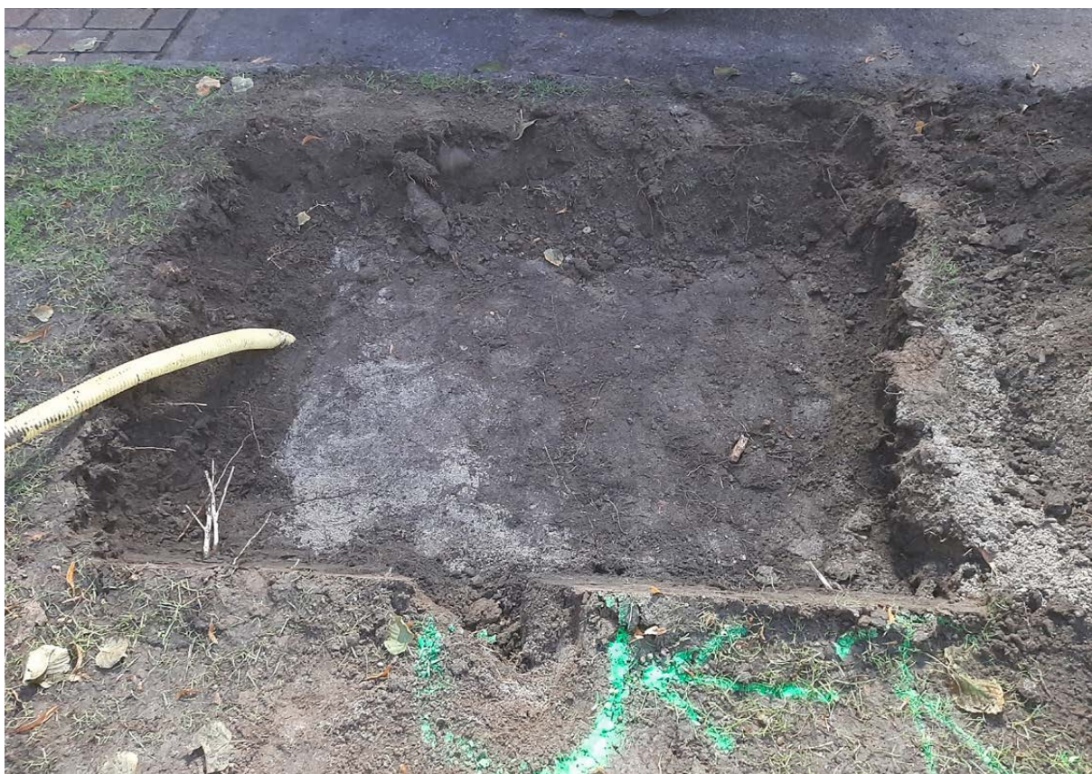
Figur 3. Den urschaktade gropen för fundamentet till den digitala skylten. Foto från sydöst.

Vid schaktningen påträffades inga historiska lämningar sannolikt på grund av det ringa schaktdjupet och lämningar efter eventuella stensatta kontexter eller kulturlager kan finnas djupare ner. Detta gör att framtida schaktningsarbeten på platsen kan komma att kräva ytterligare antikvariska insatser för att säkerställa kunskapen om Kalmars medeltida stad och stadsplan.